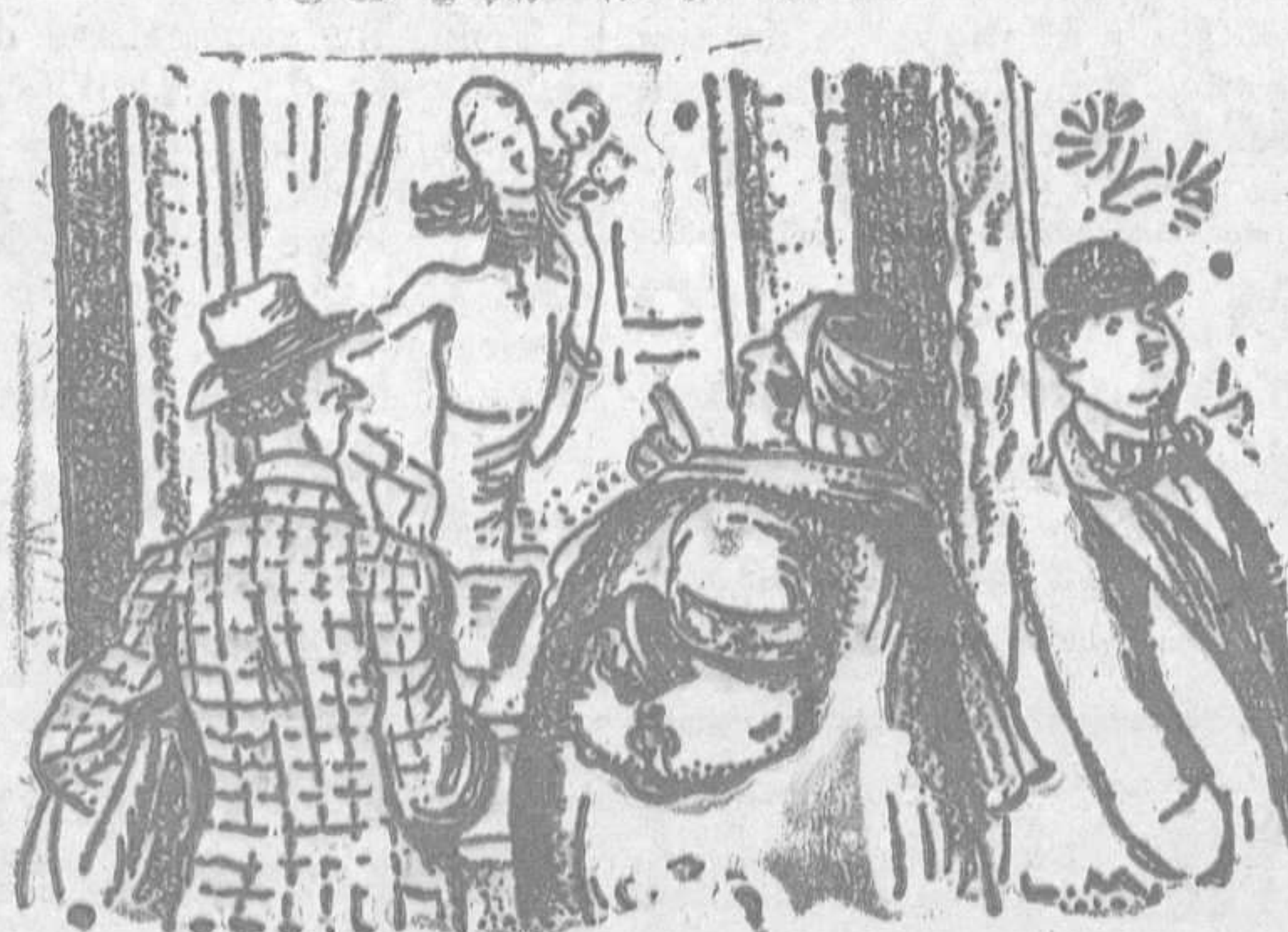
—Pregunta dónde vive el pintor. Quiero que me haga un retrato igual.