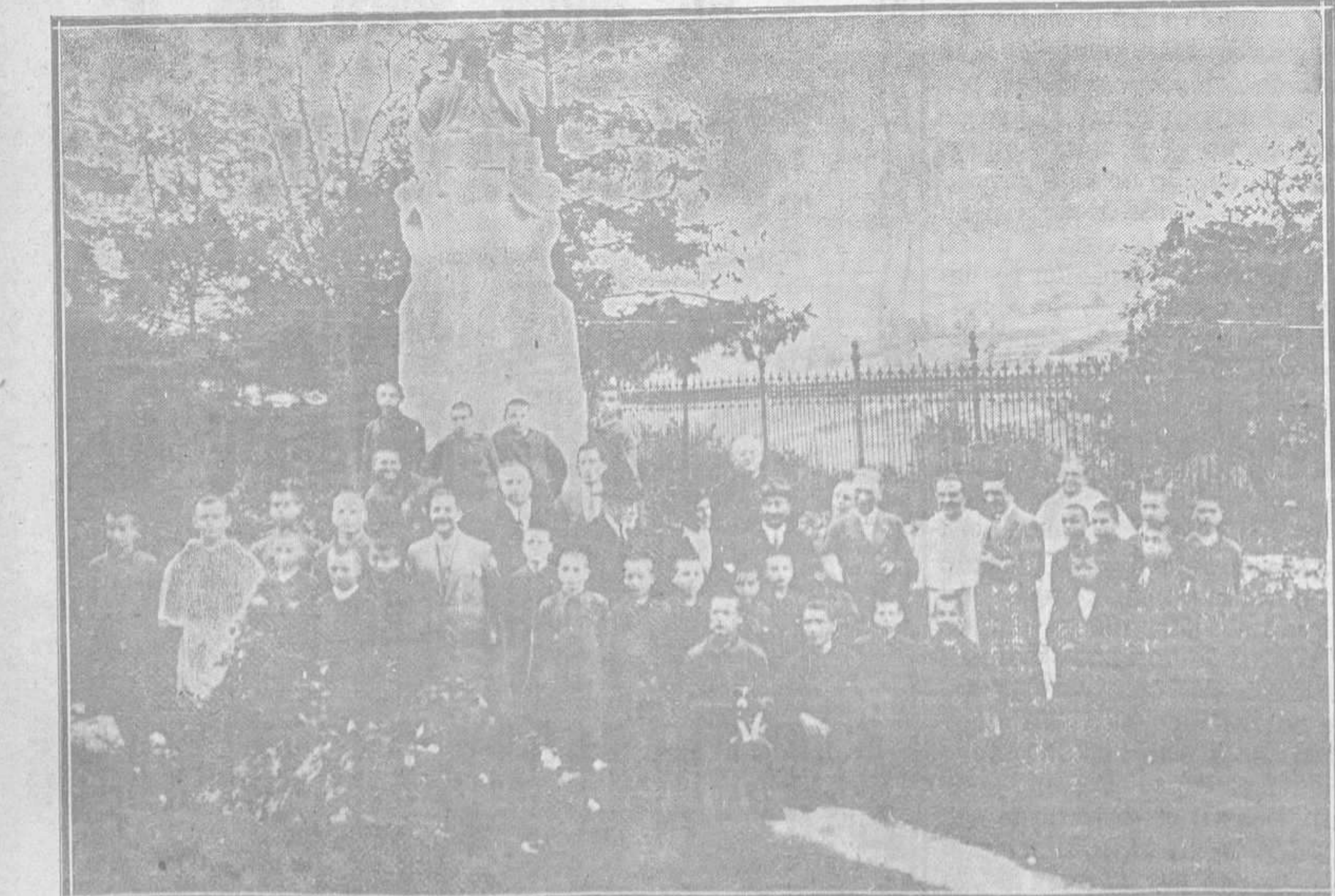
EN EL REFORMATARIO «COVADONGA».—Con ocasión de la festividad de la Virgen de la Merced, se celebró en el Reformatorio de niños delincuentes una hermosa fiesta a la que asistieron el general Zuvillaga, los religiosos dirigentes, las personas que forman el Tribunal y los niños corrigidos.

Este número ha sido visado por la censura