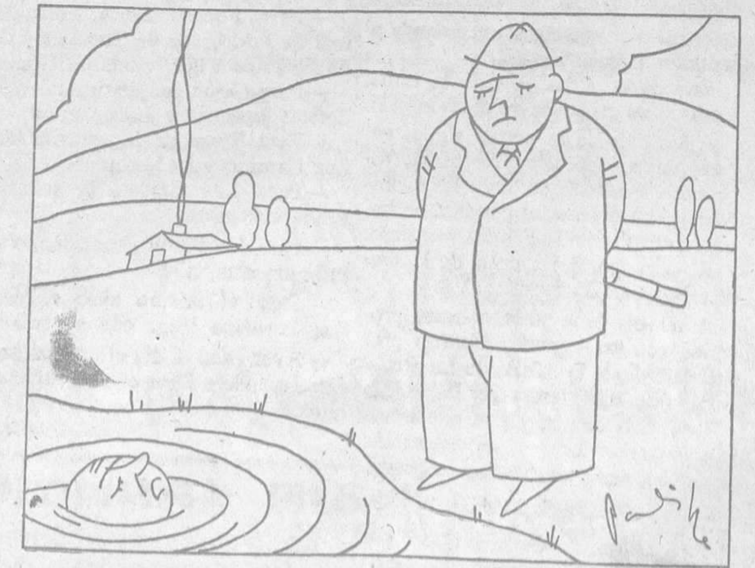
—¡Pobre Pérez! ¡Ya decía yo que en cuanto probara el agua se moriría!