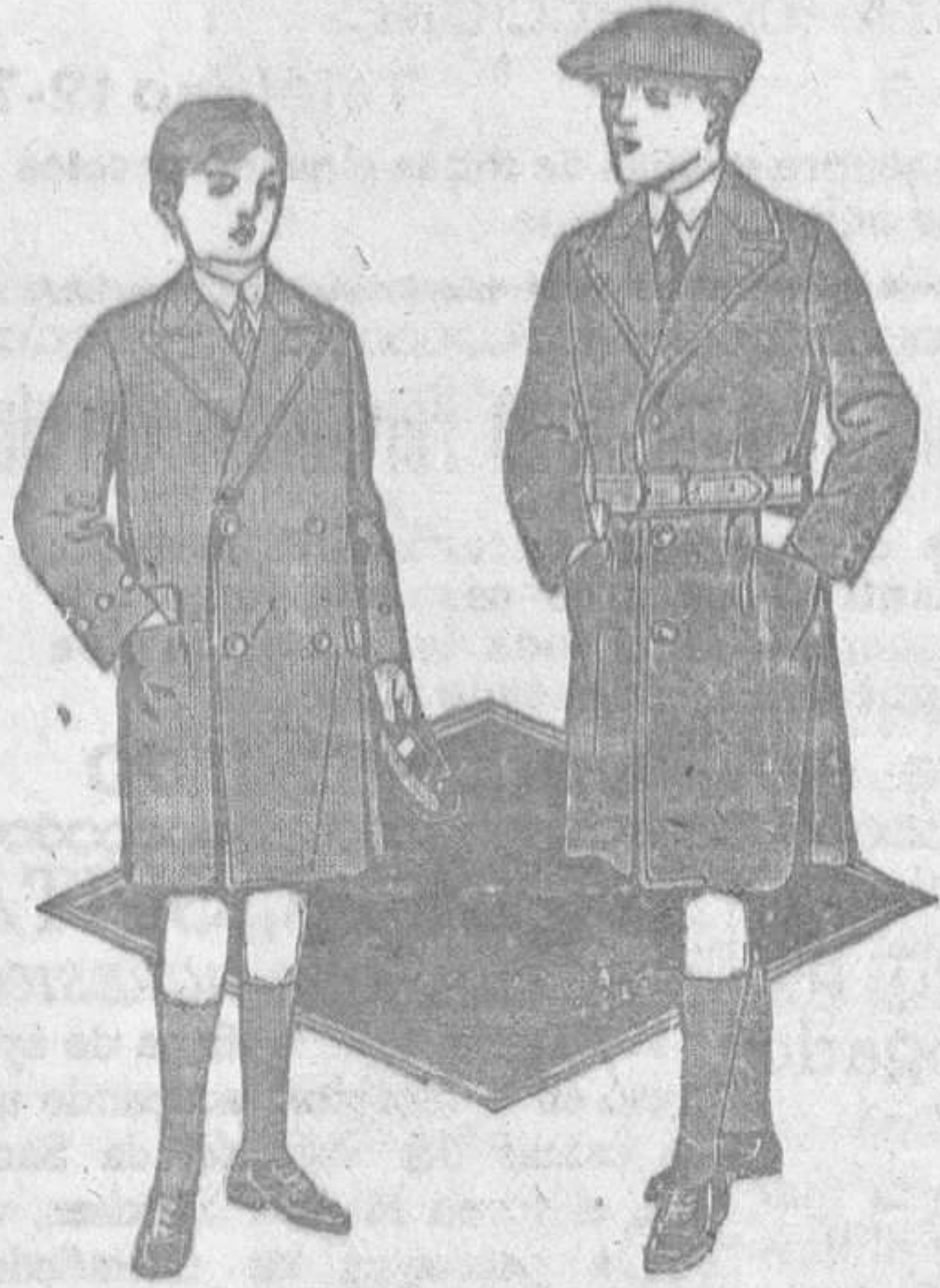
Abrigo niño, en vicuña de lana, azul marino, con botones de metal dorado y bordado en la manga, todo forrado en lana. Para 8 años. Ptas. 26. Aumenta y disminuye 1 peseta por talla.