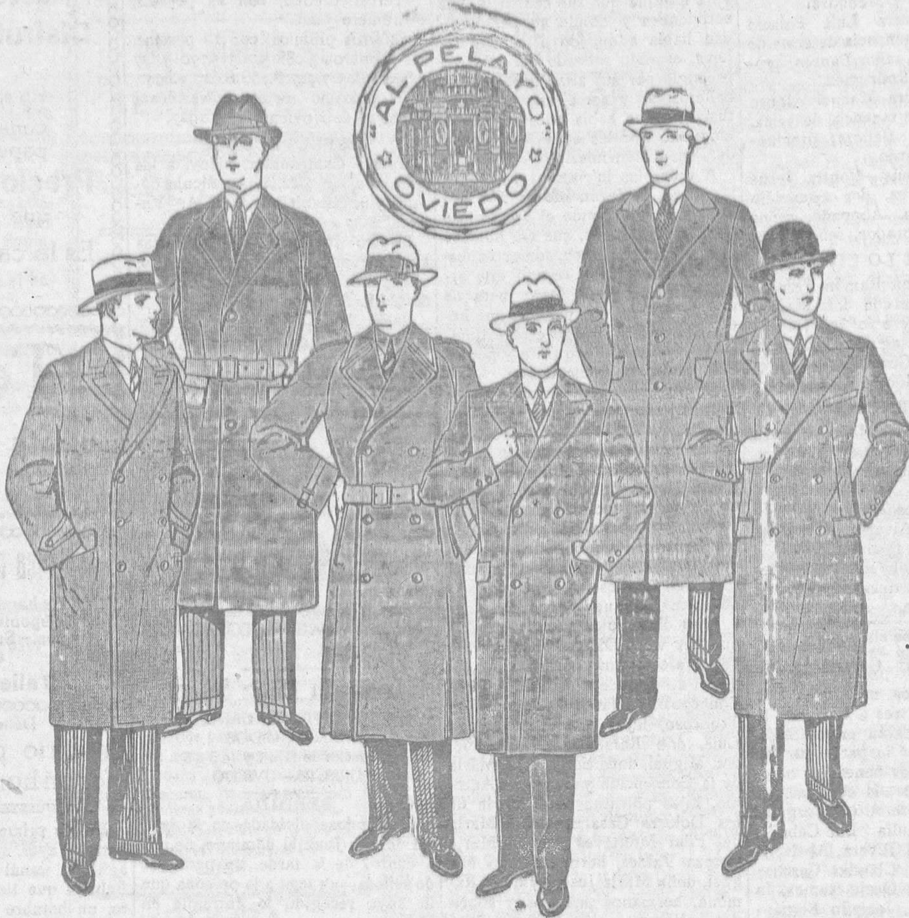
Abrigo forma recta, cruzado de excelente paño pluma, colores de novedad. Ptas. 39