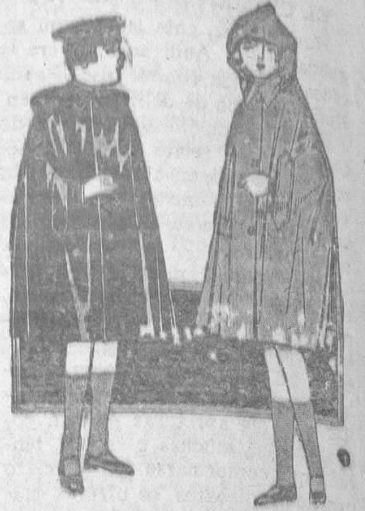
Capita para niño con capucha, muy práctica, en hule negro, café y gris, buena calidad. Para cuatro años. Ptas. 9,50.