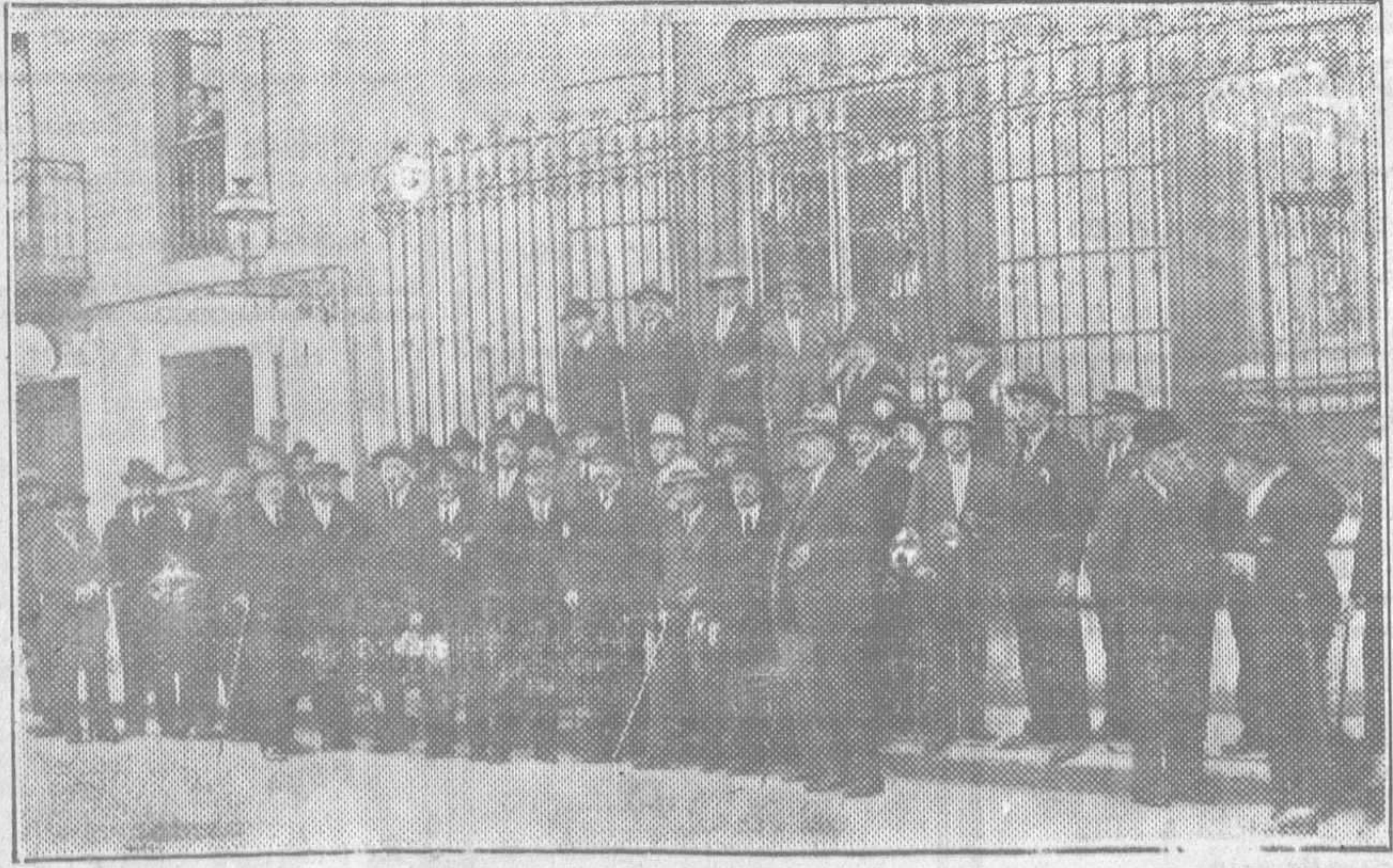
LA ASAMBLEA PROVINCIAL DE MEDICOS — Los assembleístas después de la reunión celebrada el domingo en esta capital

También asistieron los señores Gobernador civil, Alcalde, Presidente de