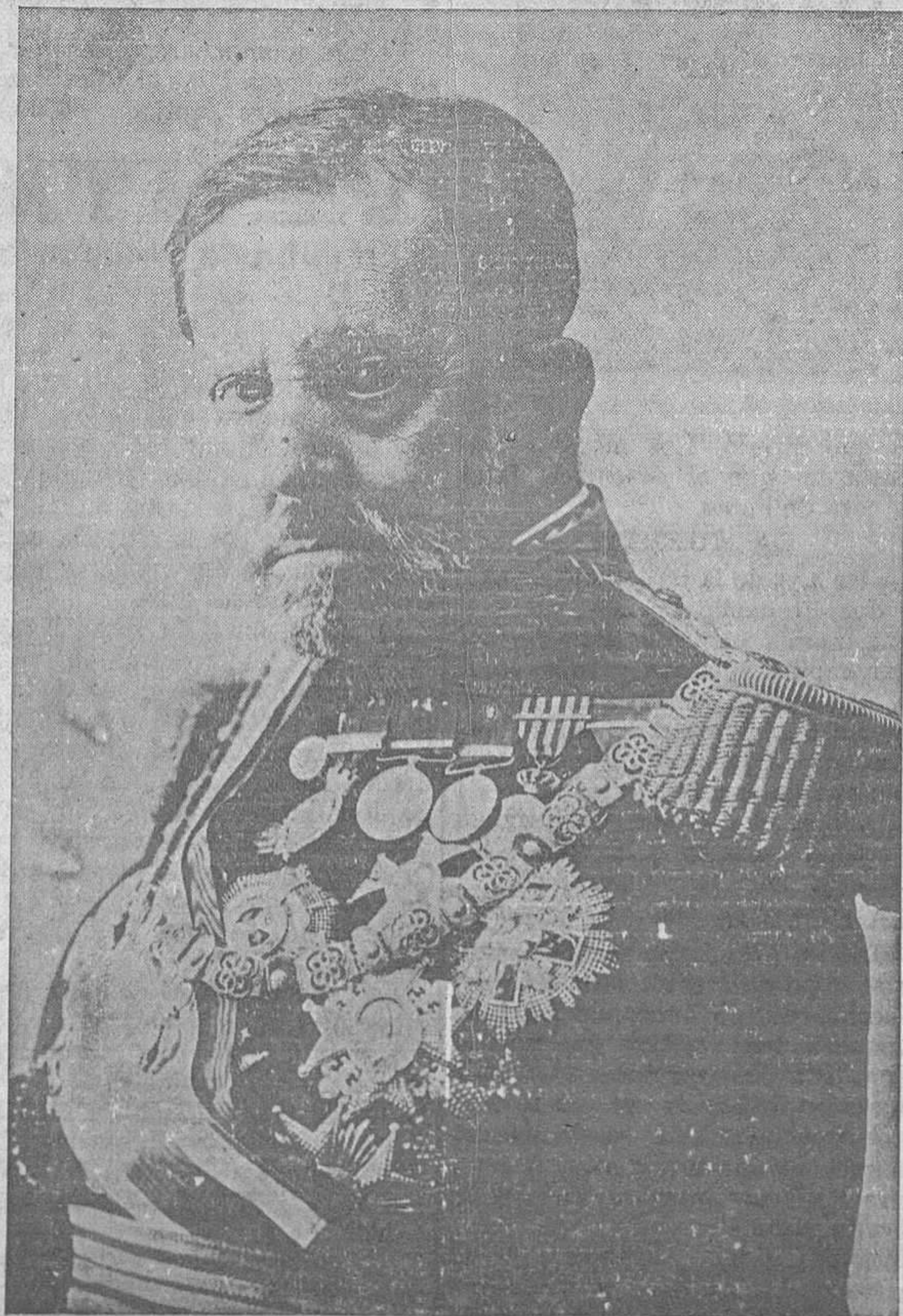
El ilustre general don Valeriano Weyler, duque de Rubi, verdadero caudillo del Ejército español, que ha fallecido ayer en Madrid, y del cual puede decirse que se lleva consigo muchas victorias y una gran parte de la historia

Añadió que había almorzado con el Consejo de Administración del Banco de Francia, después de visitar dicho Establecimiento bancario.