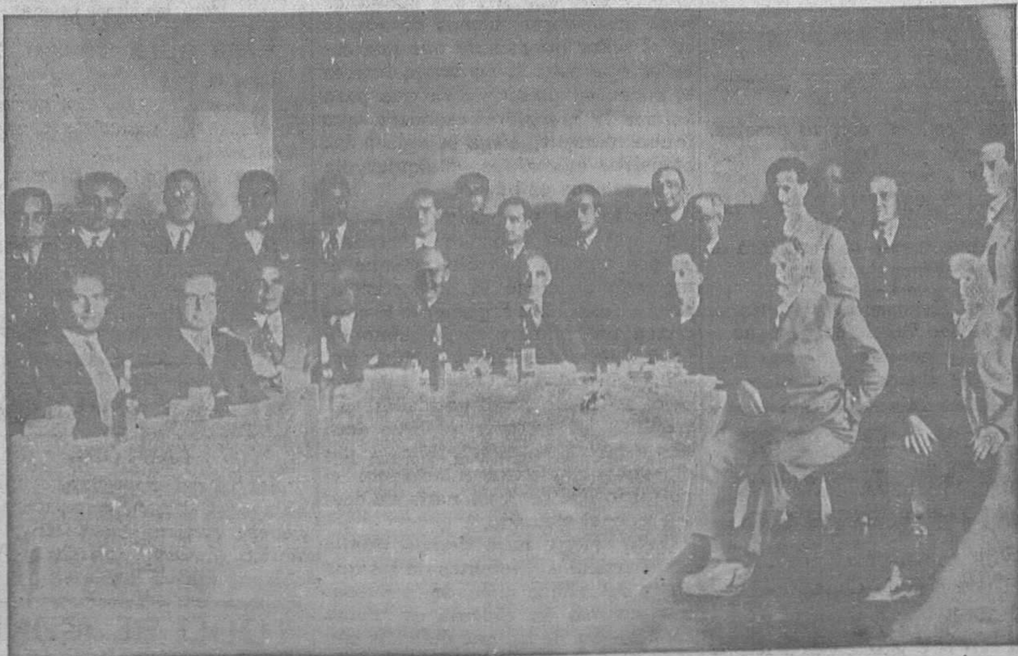
UN ACTO DE FRATERNIDAD.—Siguiendo la costumbre de años anteriores, el domingo se reunieron en fraternal banquete los catedráticos de los Institutos de Gijón y Oviedo, reinando en el acto la mayor camaradería, cambiándose impresiones sobre la reforma de la Segunda Enseñanza y acordándose por último enviar un telegrama de adhesión al presidente de la Asociación de Catedráticos, por la labor que dicha entidad viene realizando en defensa de los compañeros.