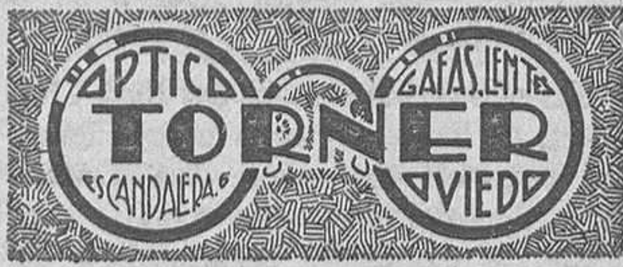
Despacho recetas Sres. Oculistas

Unido a esto la delicada restauración que reputados artistas ovetenses están haciendo del retablo, altar mayor e imagen de San Agustín, todo hace presagiar un felicísimo éxito a estos espléndidos cultos en honor del Santo Obispo de Hipona.