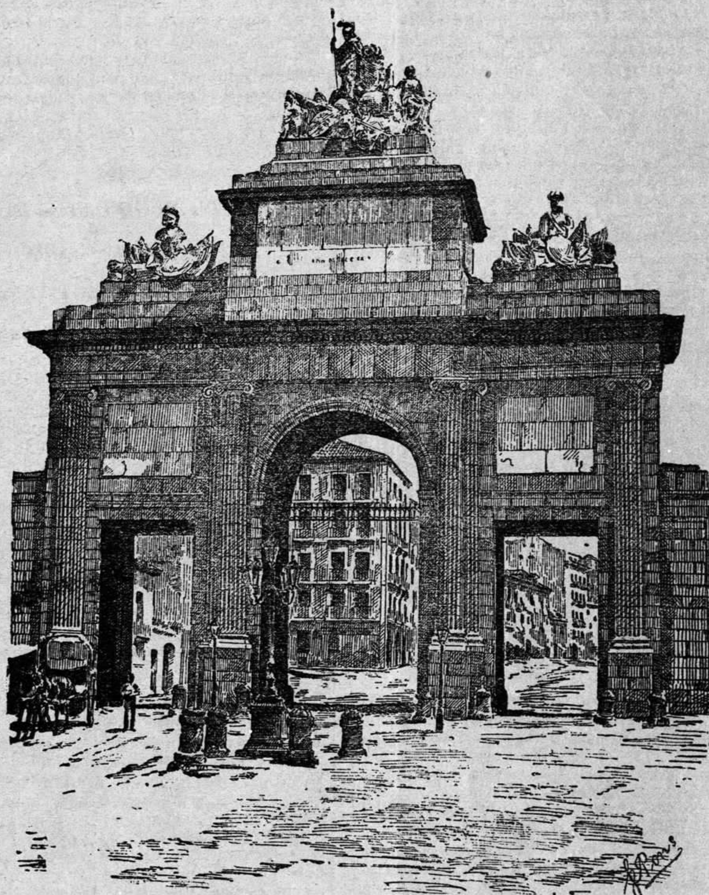
Madrid — La puerta de Toledo

asistimos hoy, no á su paso de este mundo al otro, á la traslacion del viejo cuerpo suyo de la cama, donde soportara la triste agonía, que ha durado un lustro, al sitio de su eterno reposo. Nada tan trágico en los anales de nuestra edad, como ese derribamiento desde los altos de la mayor gloria posible á los surcos de la mayor desesperacion y miseria. Yo conocí, el mismo día y á la misma hora, por Auteuil, barrio extremo de París, una tarde tristísima del mes de Diciembre de 1866, á dos prototipos de sendas zonas sociales opuestas; al prototipo del combate, Pedro Bonaparte, primo hermano célebre de Napoleón III, aquél Pedro que asesinó á un periodista llamado Victor Noir; y al prototipo del comercio, Fernando de Lesseps, primo hermano célebre de la condesa de Montijo, aquel Fernando que abrió el istmo de Suez. Sabía este que yo me hallaba refugiado en una casita del parque de Montmorency, donde á mis faenas literarias me consagraba por completo, ganándome con la pluma una vida, la cual, gracias á mis amigos, había podido