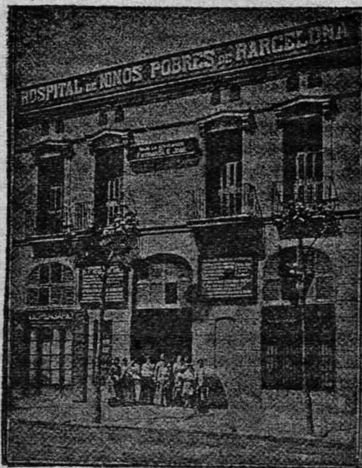
Hospital de niños pobres de Barcelona.

Hubo durante estos populares y tradicionales festejos, según el lujoso programa, lo siguiente: iluminaciones caprichosas, sorprendentes y variadas colecciones de fuegos artificiales, la mayor parte de ellas de los reputados pirotécnicos hijos de Alonso, de Palencia, dianas, retretas y paseos con músicas, los famosos Gigantones y cabezudos ; Santo Sudario; 2.000 raciones de pan para los pobres del Concejo; músicas del país (tamborileteros y gaiteros); verbenas; banda de música (municipal y militar); magníficos bailes de etiqueta, de sociedad y campesines; algunas corridas de toros en el espacioso y lindo circo taurino de Buenavista; panoramas vistosos, entre ellos, el de la Rigolade y el del célebre gigante aragonés; diversas funciones religiosas; bonitos y