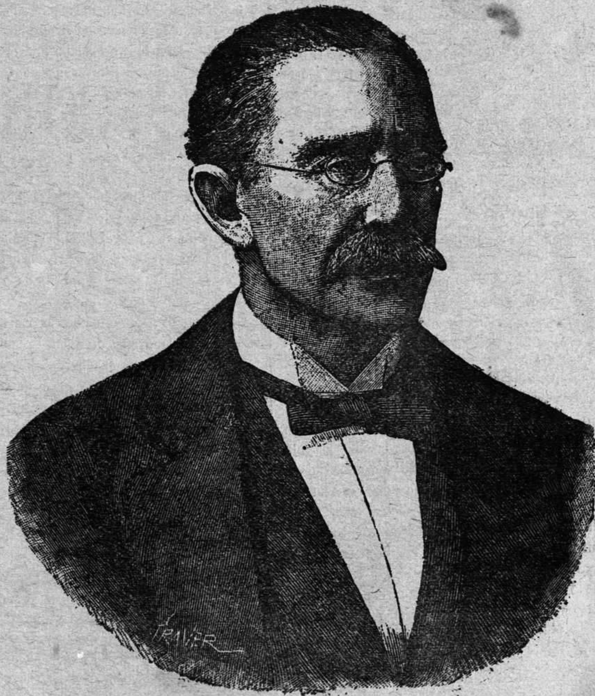
D. Aureliano Fernández Guerra y Orbe

NACIÓ EN GRANADA EL 16 DE JULIO DE 1816 † EN MADRID EL 7 DE SEPTIEMBRE DE 1894