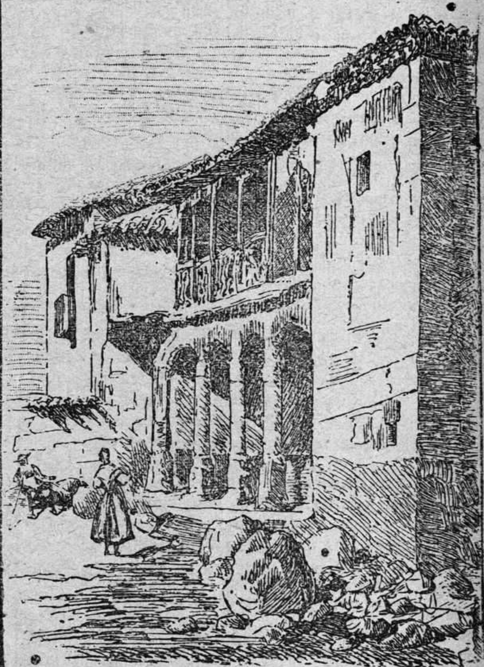
SALAMANCA. —Monumento á la memoria de Cristóbal Colón en la aldea de Valcuebo,