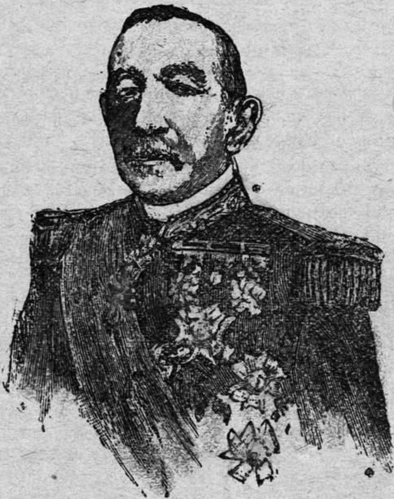
EL CAPITAN GENERAL DON JOSÉ GUTIERREZ DE LA CONCHA MARQUÉS DE LA HABANA

la cruz laureada de San Fernando, con cuya distinción ha premiado el Gobierno su heroico comportamiento en la guerra de aquella isla.