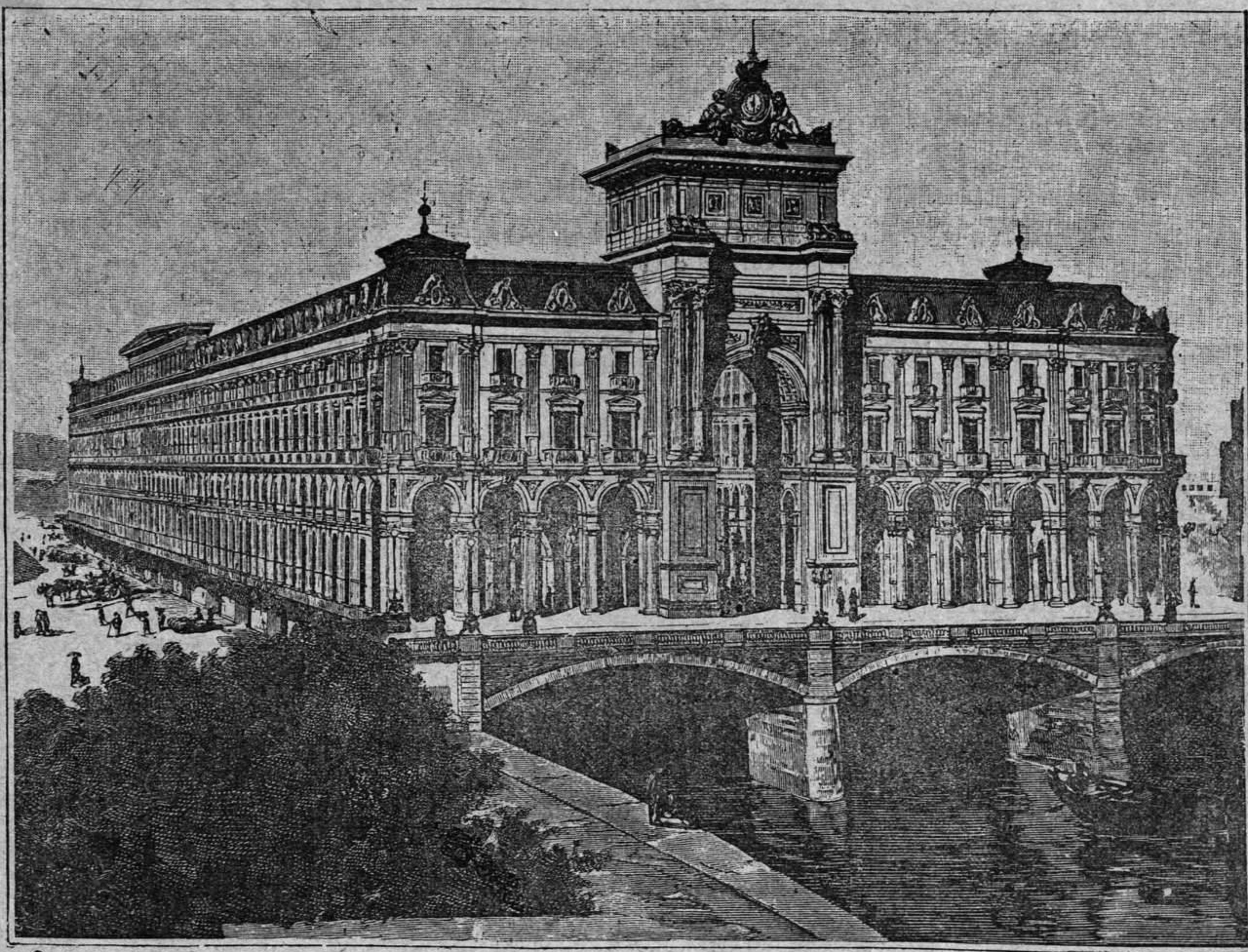
B LBAO—Puente colosal cubierto y sirviendo de base á construcciones monumentales sobre el Nervion

en que han tenido que verificarse todos los trabajos.