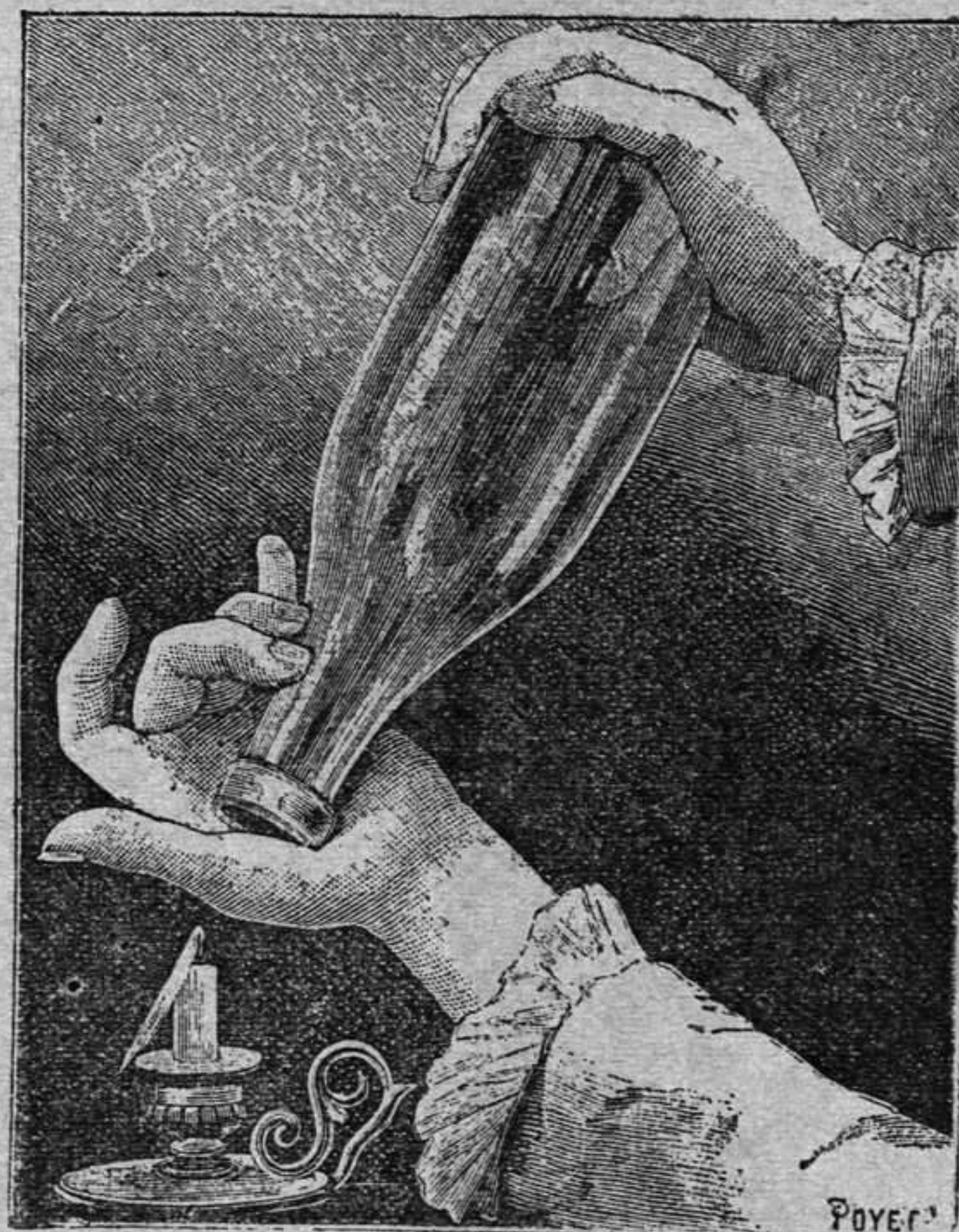
Modo de poner la botella para apagar una bujía con el aire comprimido

En este momento debe destaparse en parte la boca de la botella por un repentino movimiento de la mano izquierda, inverso del que sirvió para cerrarla, y de modo que se escape el aire comprimido por una abertura sensiblemente igual á la que sirvió para la insuflacion (grabado).