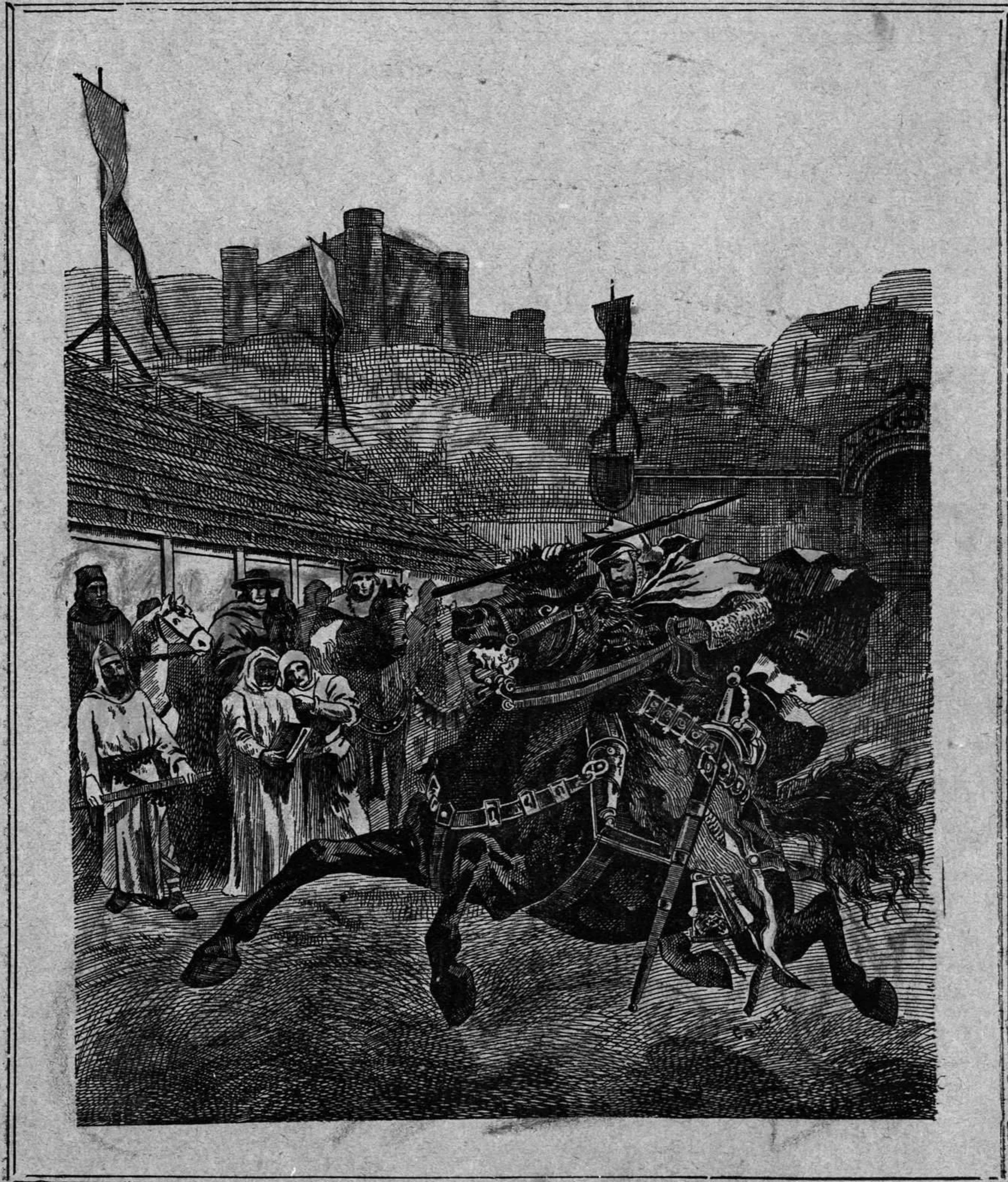
Célebre desafío entre los reyes de Aragon y Sicilia (año 1283):—D. Pedro el Grande de Aragon en el palerque de Burdeos, recorriendo el área de la liza.