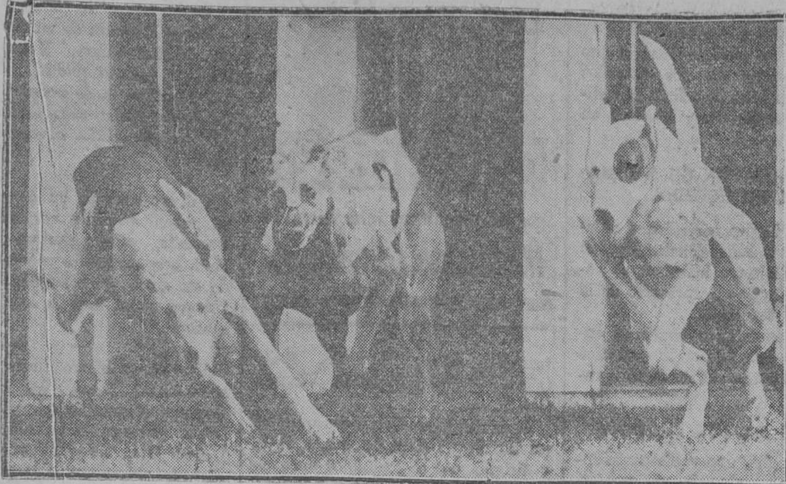
Tres galgos que literalmente vuelan a la señal de partida, en las carreras de ensayo celebradas en Londres para seleccionar los mejores perros que han de competir en las carreras que próximamente se inaugurarán en Sur Africa