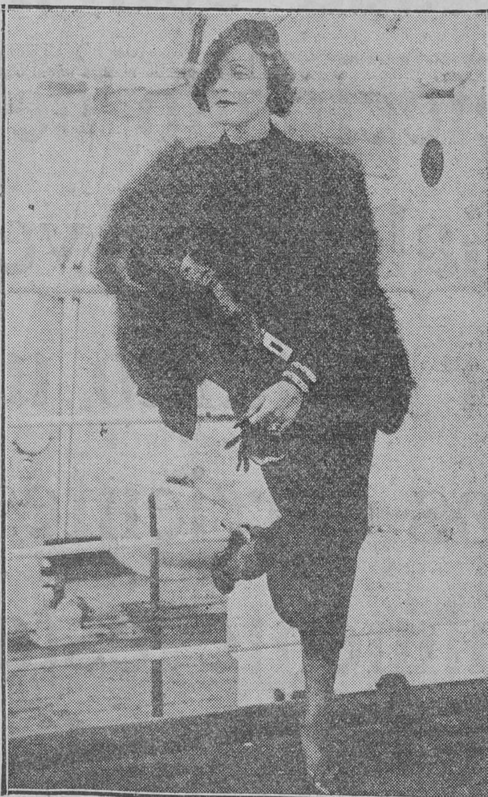
Marlene Dietrich, actriz de la pantalla, regresa a Nueva York, esta vez sin su característico atavío masculino, que tantos dolores de cabeza le causó en Europa