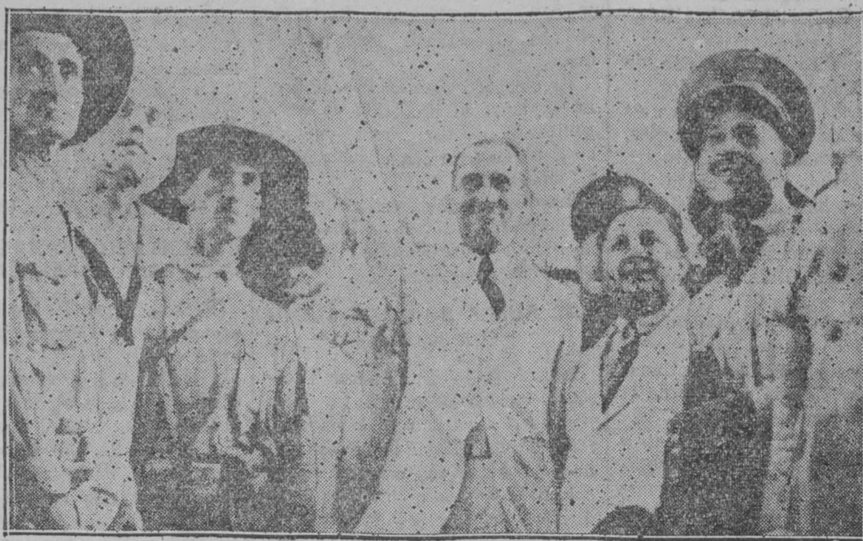
El doctor Ramón Grau San Martín, elegido presidente de Cuba por la Junta que asumió el Gobierno después del golpe de cuartel que derrocó al doctor Céspedes, saludado por la multitud, que lo aclama, después de haber tomado posesión en el palacio presidencial de la Habana