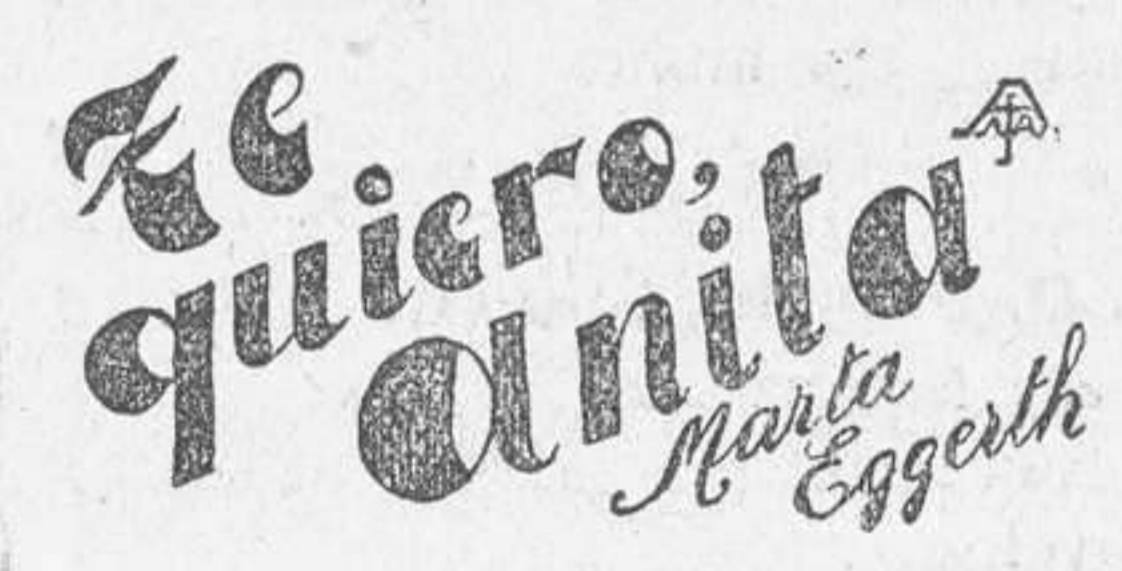
LA PELICULA DEL AVION Y DEL METRO

Nada conviene tanto al «cinema», en efecto, como el espectáculo de la vida, del placer de vivir, de las bellezas naturales.