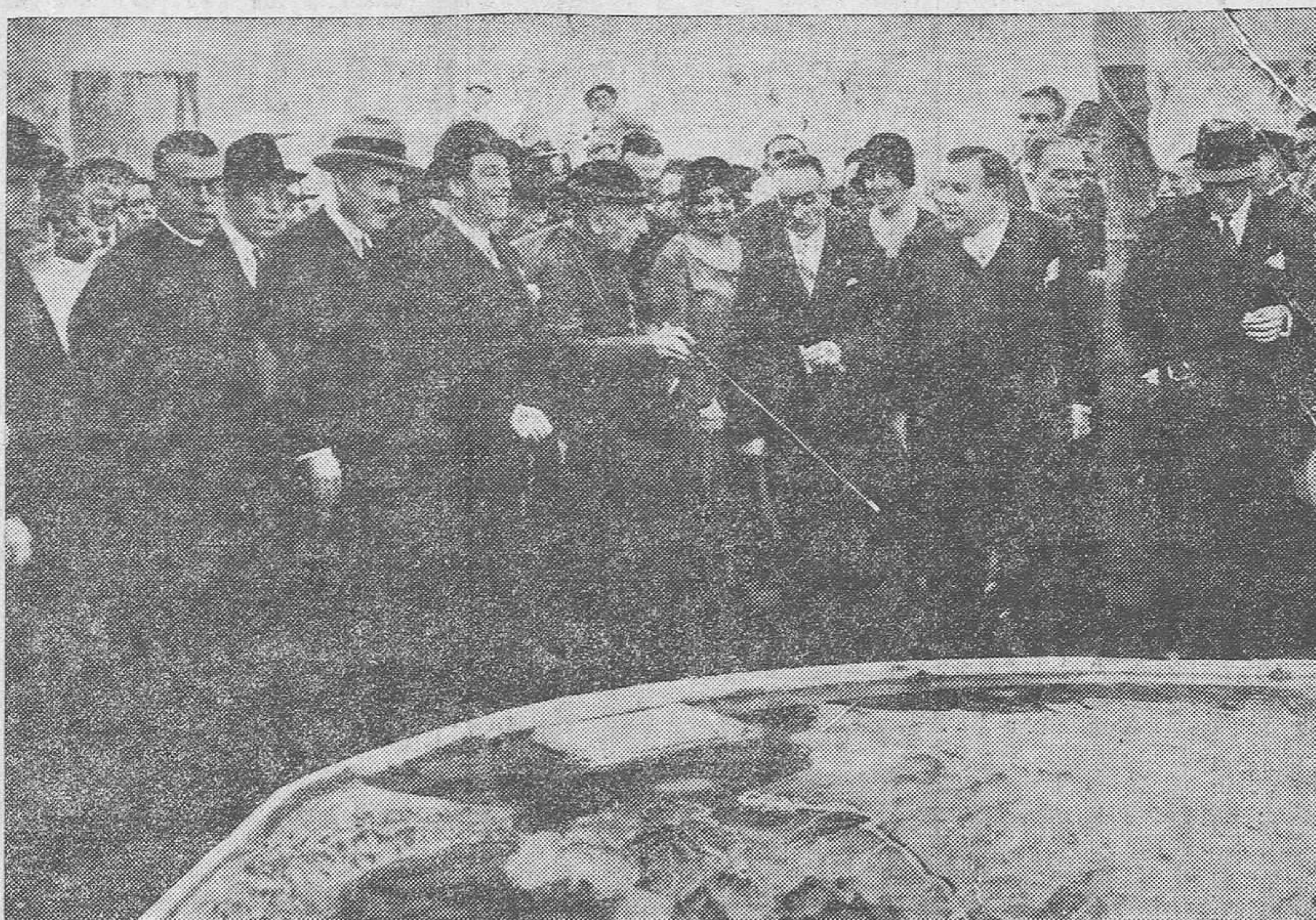
Las autoridades, con el director general de Primera Enseñanza, viendo el mapa en relieve instalado en el parque

Fue ayer día de júbilo grande en la rica ciudad de Sueca la inauguración del Grupo Escolar Alfonso XIII, que constituye una mejora mucho tiempo suspirada. Por eso la población se vistió de gala y hubo alegría en los corazones.