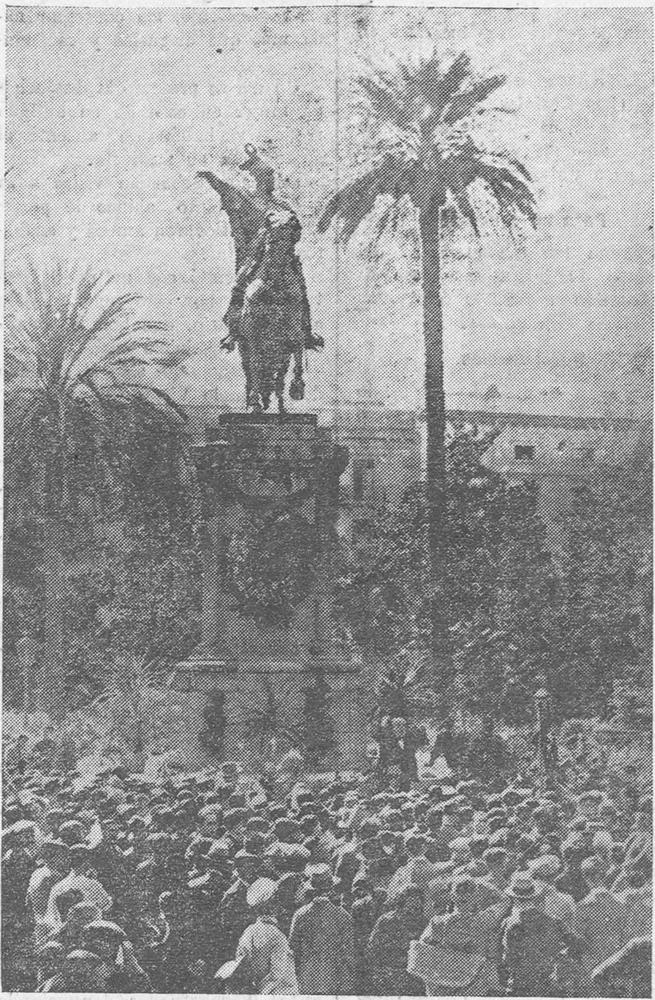
El homenaje de Valencia al Rey don Jaime, celebrado esta mañana ante su monumento