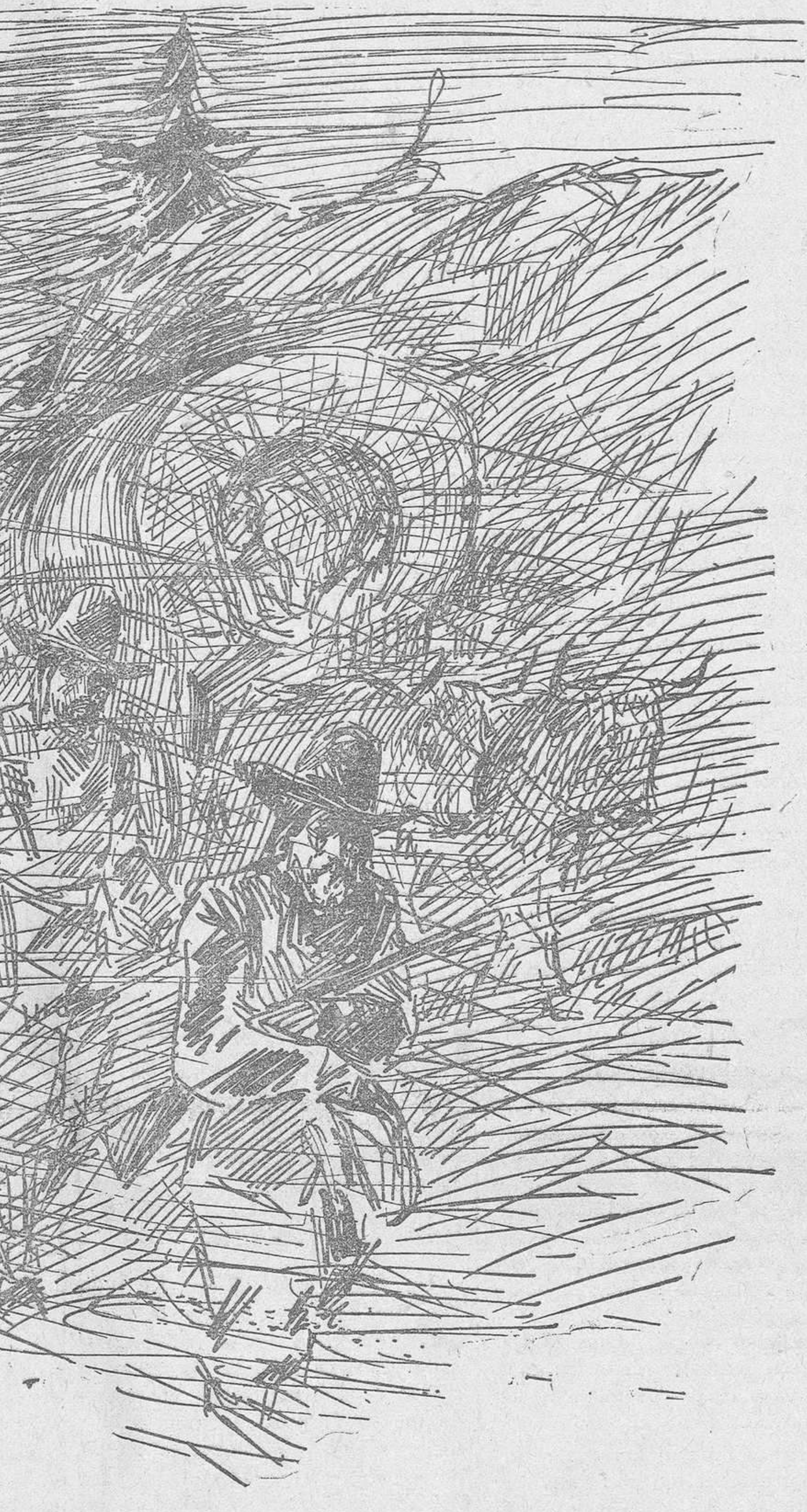
Crujiendo, tropezando, el carro subía penosamente...

*** La mala suerte se encarnizaba decididamente contra ellos. Uno de los bueyes acababa de caer sobre sus rodillas. El otro, extenuado, no podía seguir adelante. La noche subía desde las profundidades violáceas de los montes. Si la oscuridad les envolvía, quedaban perdidos sin remedio. Hubiera sido preciso, si, hubiera sido preciso aligerar el carro. La vida de la pequeña, las vidas de todos bien lo