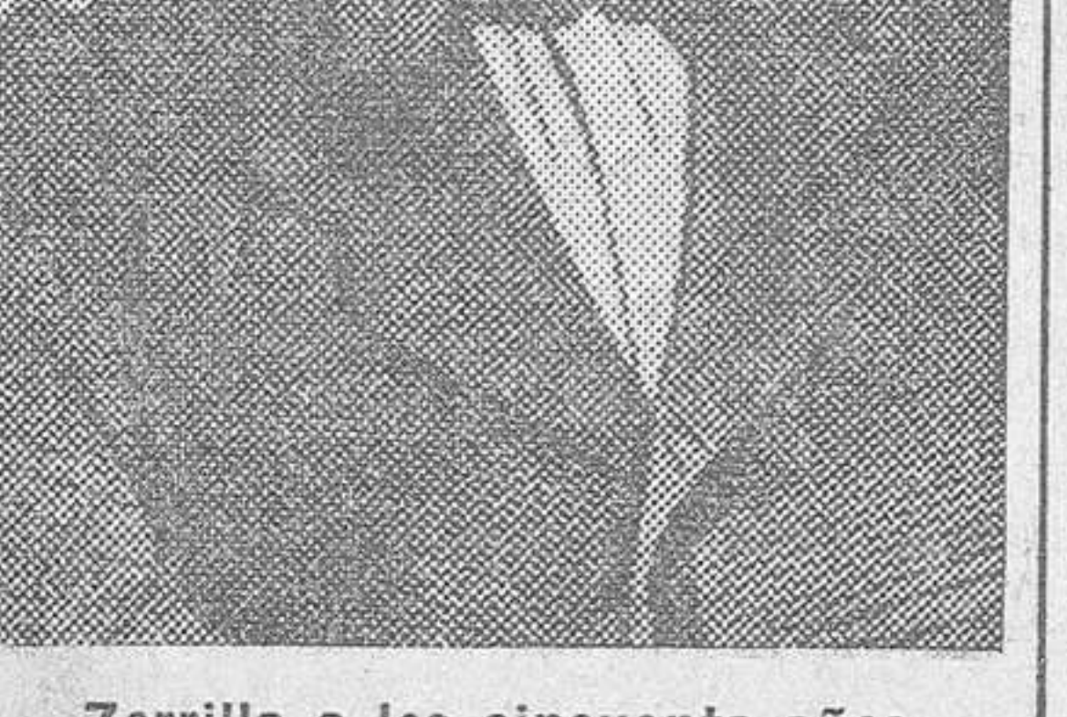
Zorrilla a los cincuenta años

«Estaba en París y era hacia 1854. Zorrilla visitaba a una familia americana, en cuyos salones solían reunirse algunos ingenios italianos, franceses y españoles más o menos conocidos.»