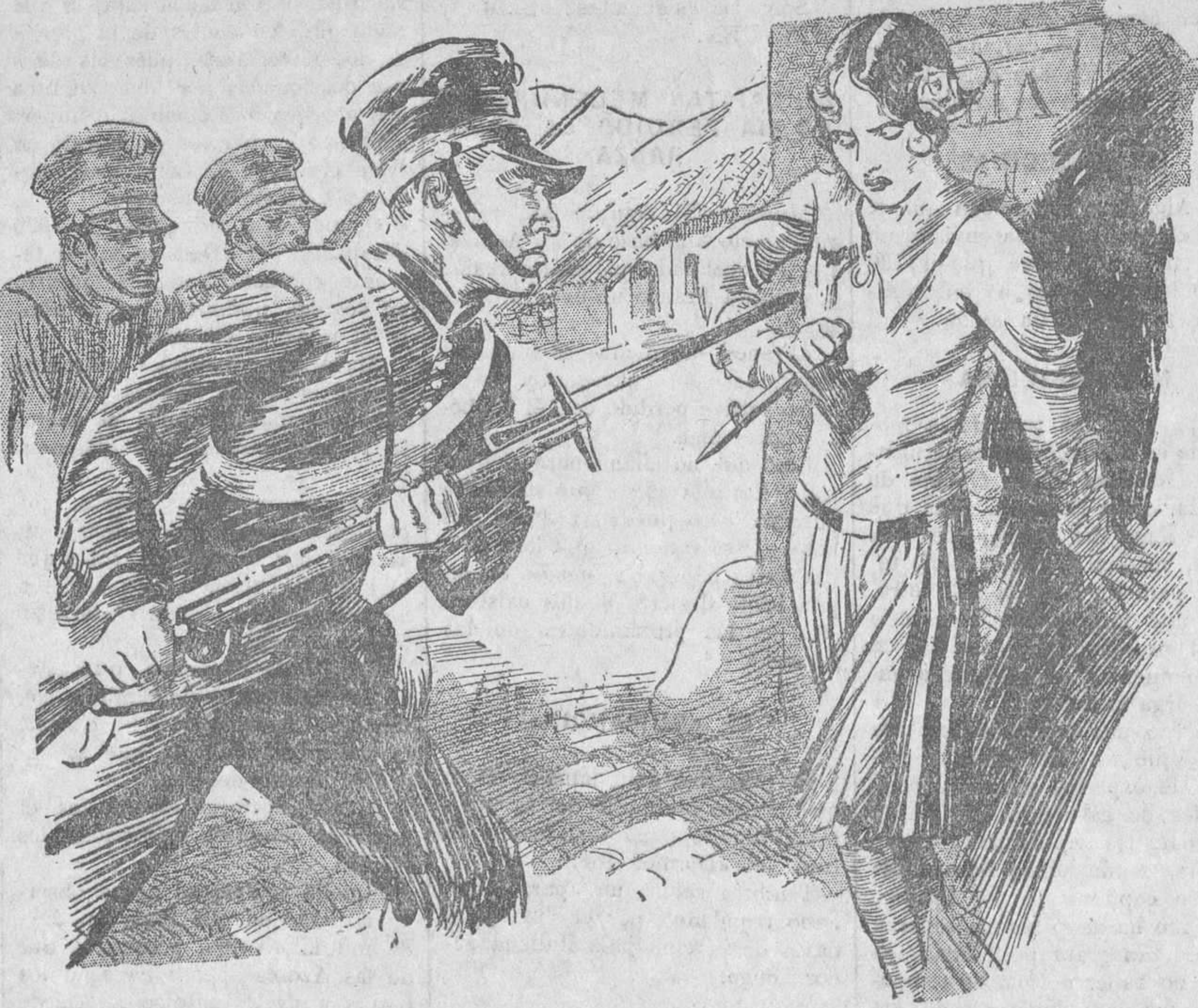
ESCENA TRAGICA Soltan los carabinieri encontrar más tenaz resistencia en las mujeres e hijos de los mafiosos, pues se defendían como tigres con sus dagas y otras armas

Si desea usted conocer el principio de «La Mafia», en nuestra Administración se le facilitarán los capítulos publicados