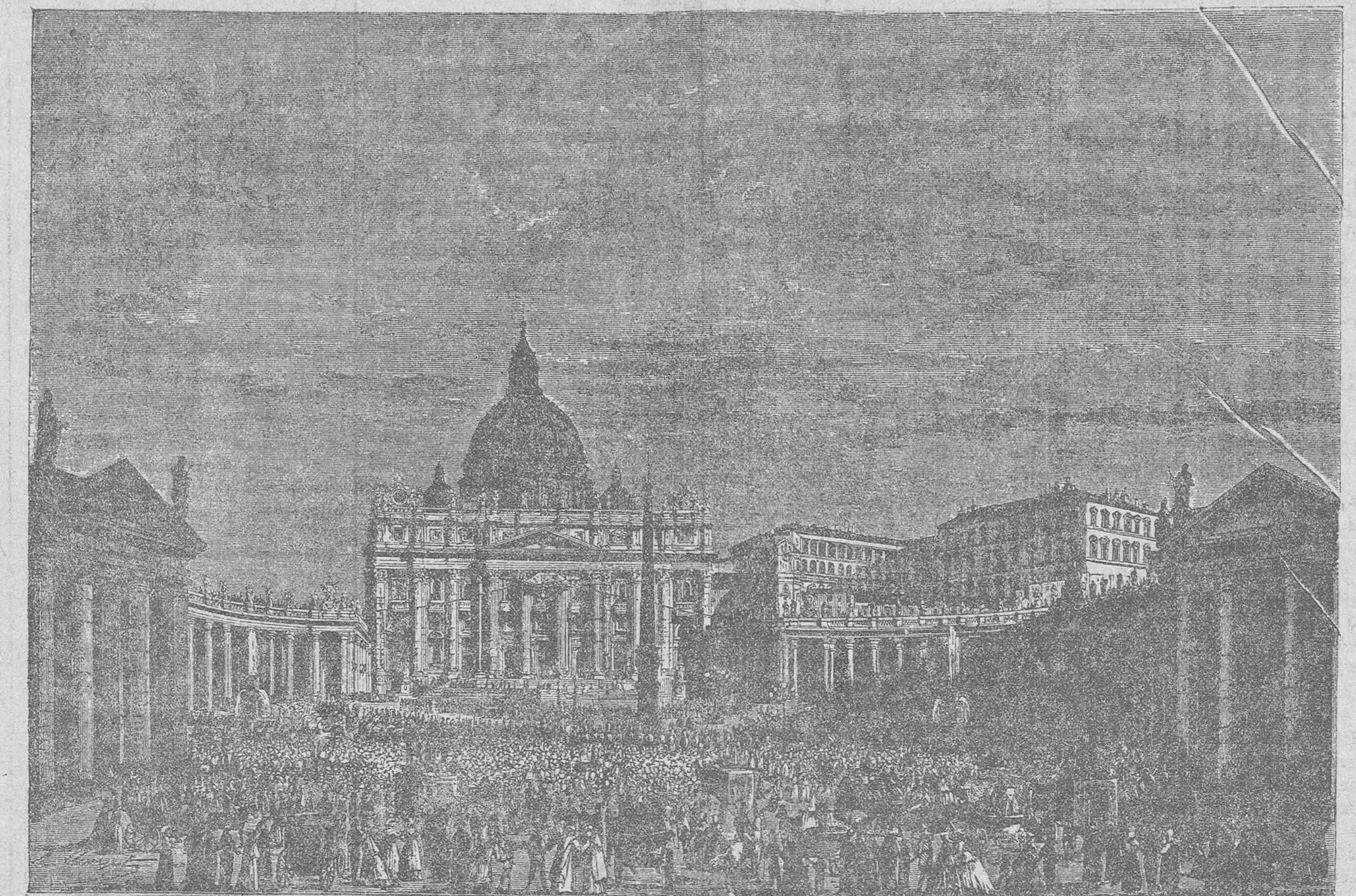
La bendición del domingo de Pascua desde la plaza de San Pedro

El último Concilio Cerimónico fue convocado por Pio IX en 8 de diciembre de 1869 y quedó en suspenso en 1870, al estallar la gue-