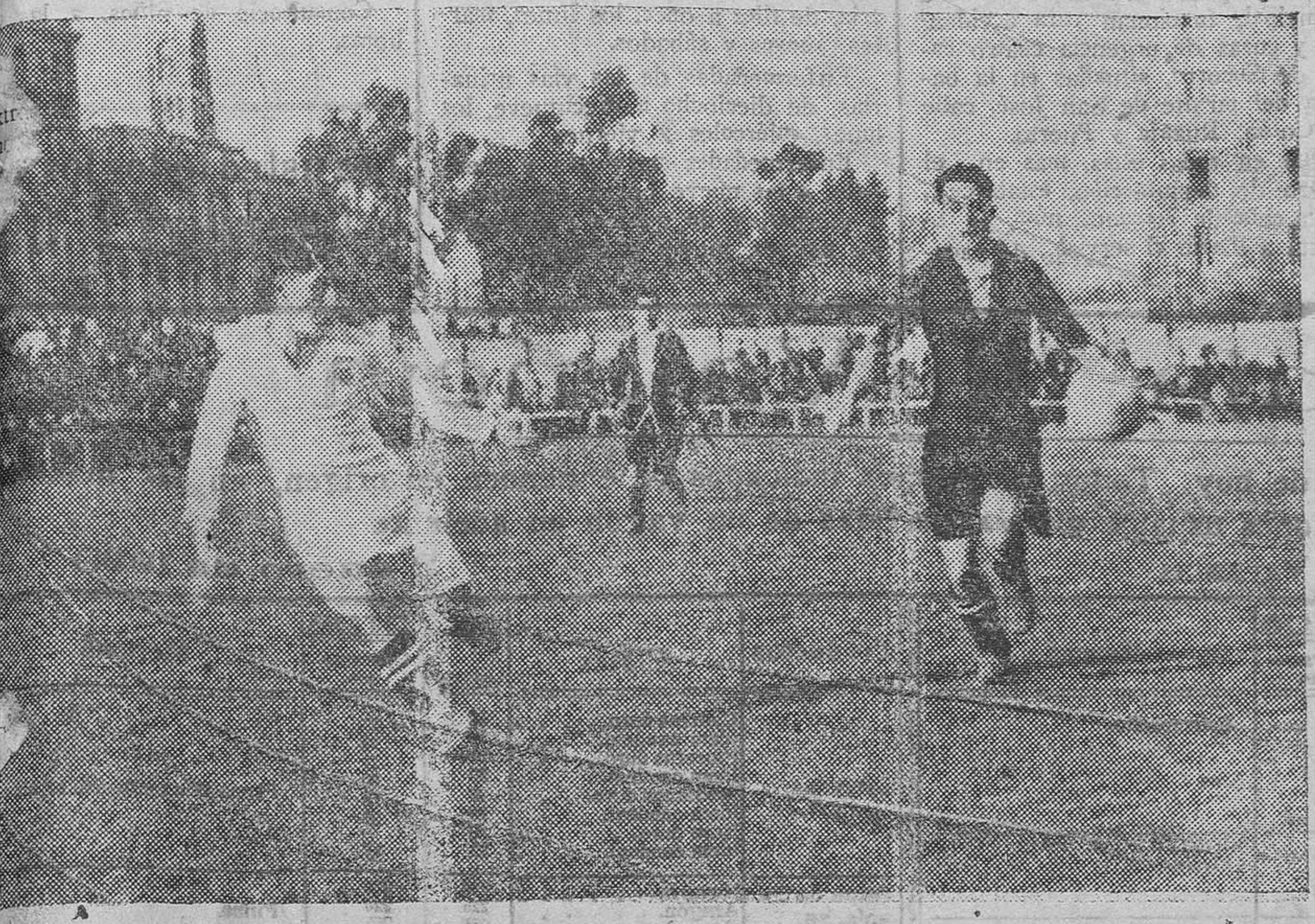
Un centro del extremo derecha del Valencia que Ateca no puede interceptar

Valencia, que quedó eliminado anticipadamente en el partido de Mestalla, perdió su última esperanza con los handicaps con que se presentó el equipo