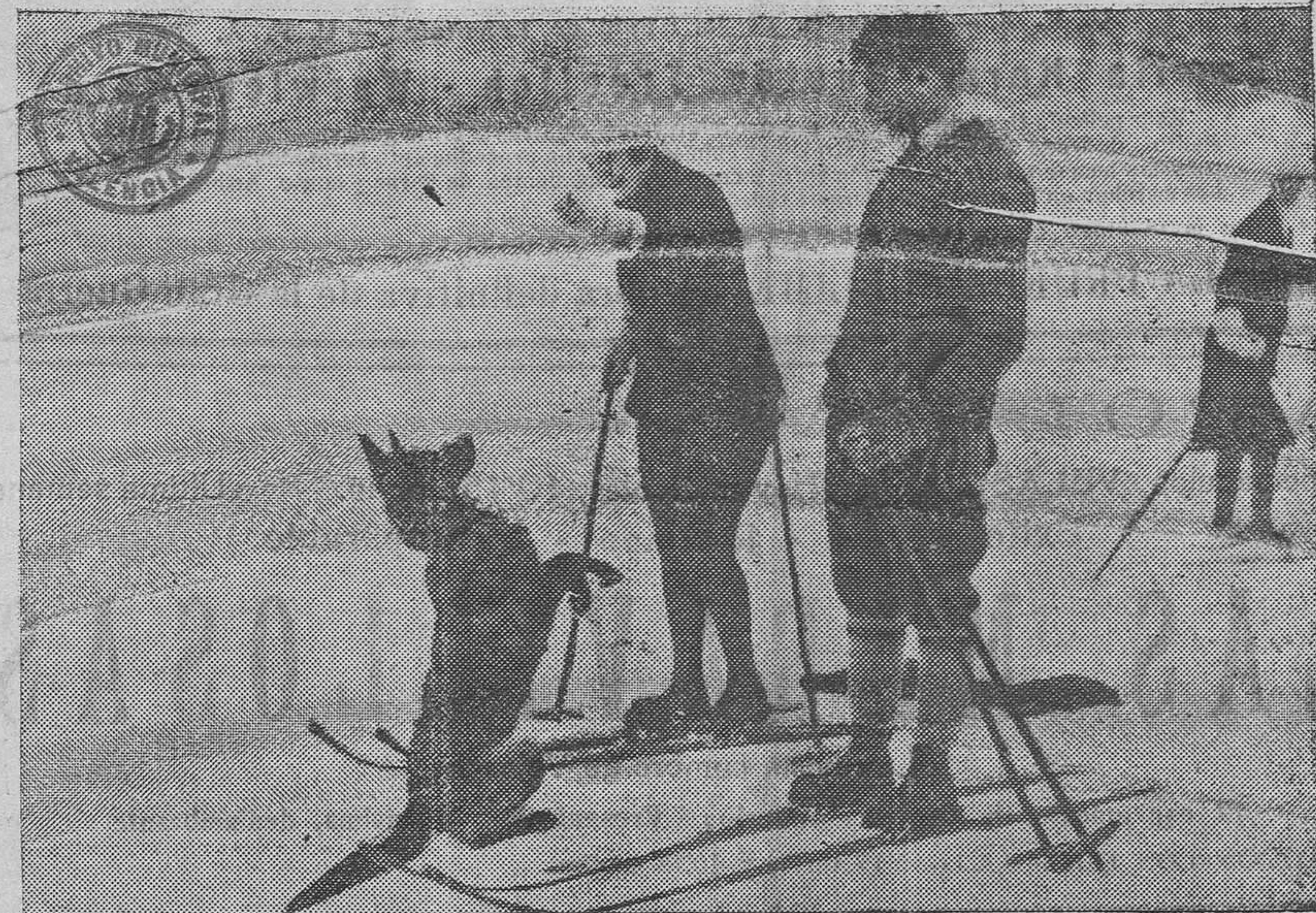
La excursión en ski ha sido larga; el perro ha seguido valiente al grupo de excursionistas y el premio ha sido para el animalito un trozo de azúcar, premio de chicos viniendo de figura tan simpática