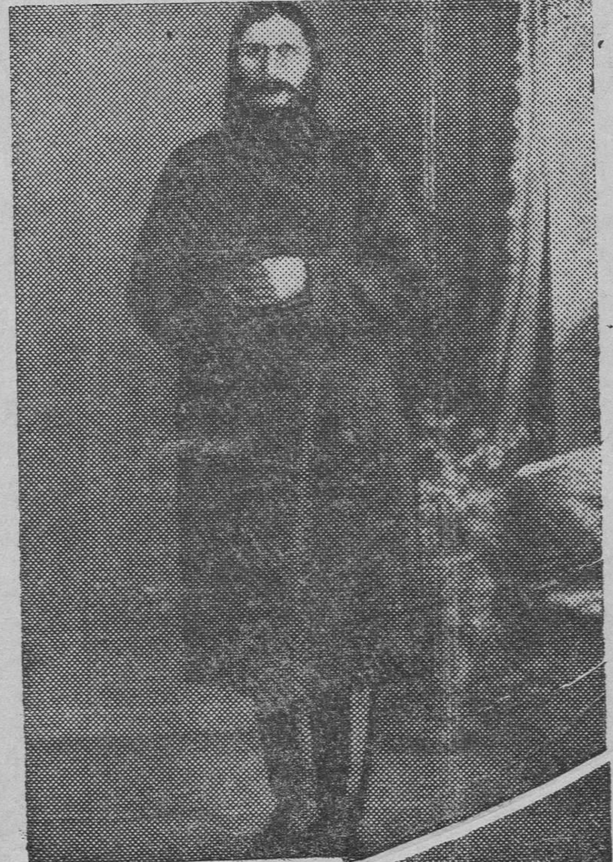
Retrato hecho en 1916, año de su asesinato