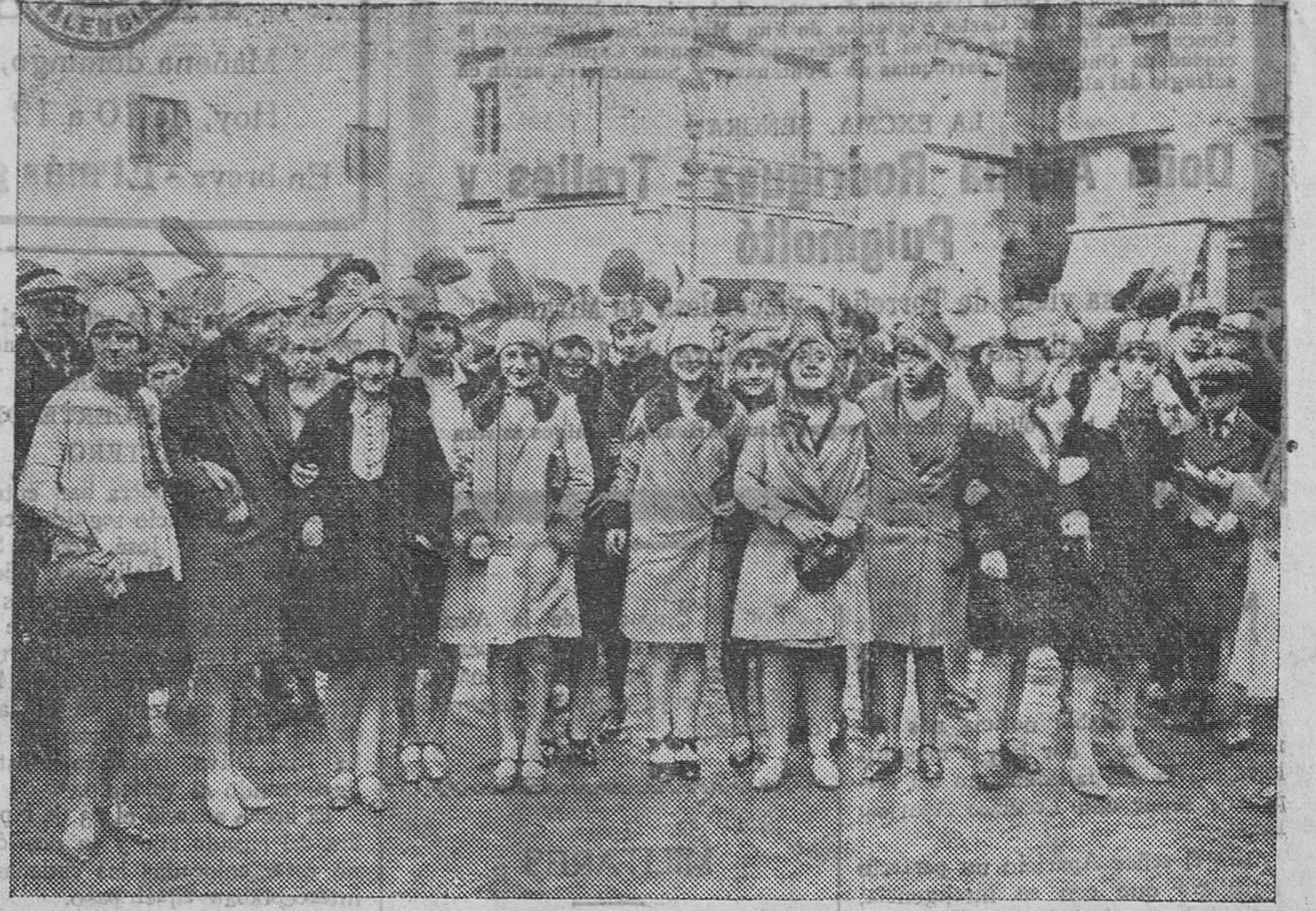
Grupo de modistillas, ataviadas con sombreros de papel, desfilando por las Ramblas.