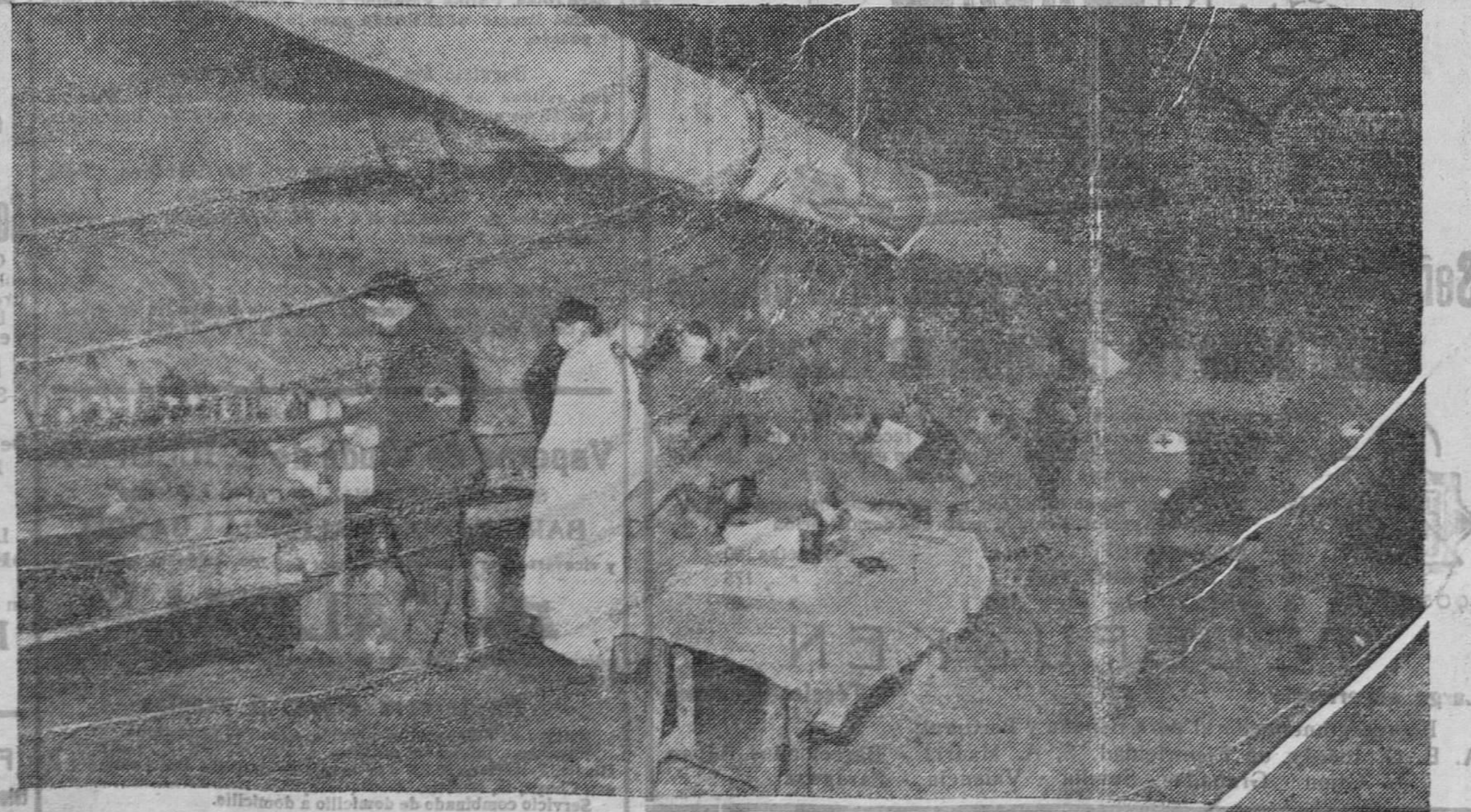
Mientras los héroes luchan por los ideales de patria, en un subterráneo se atiende debidamente a los heridos