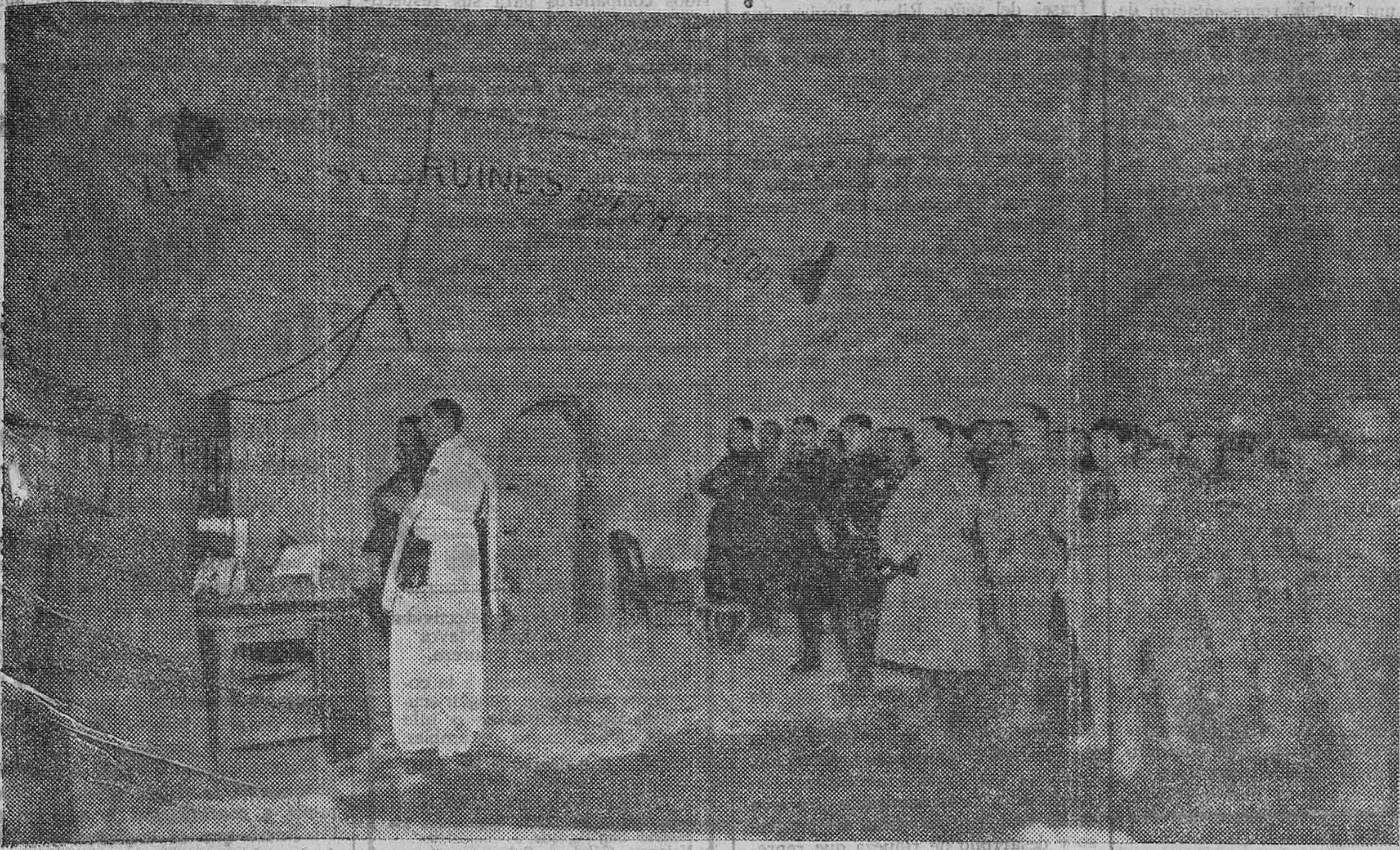
Los soldados franceses oyendo la misa celebrada en una casamata en pleno y sangriento campo de batalla de Verdun