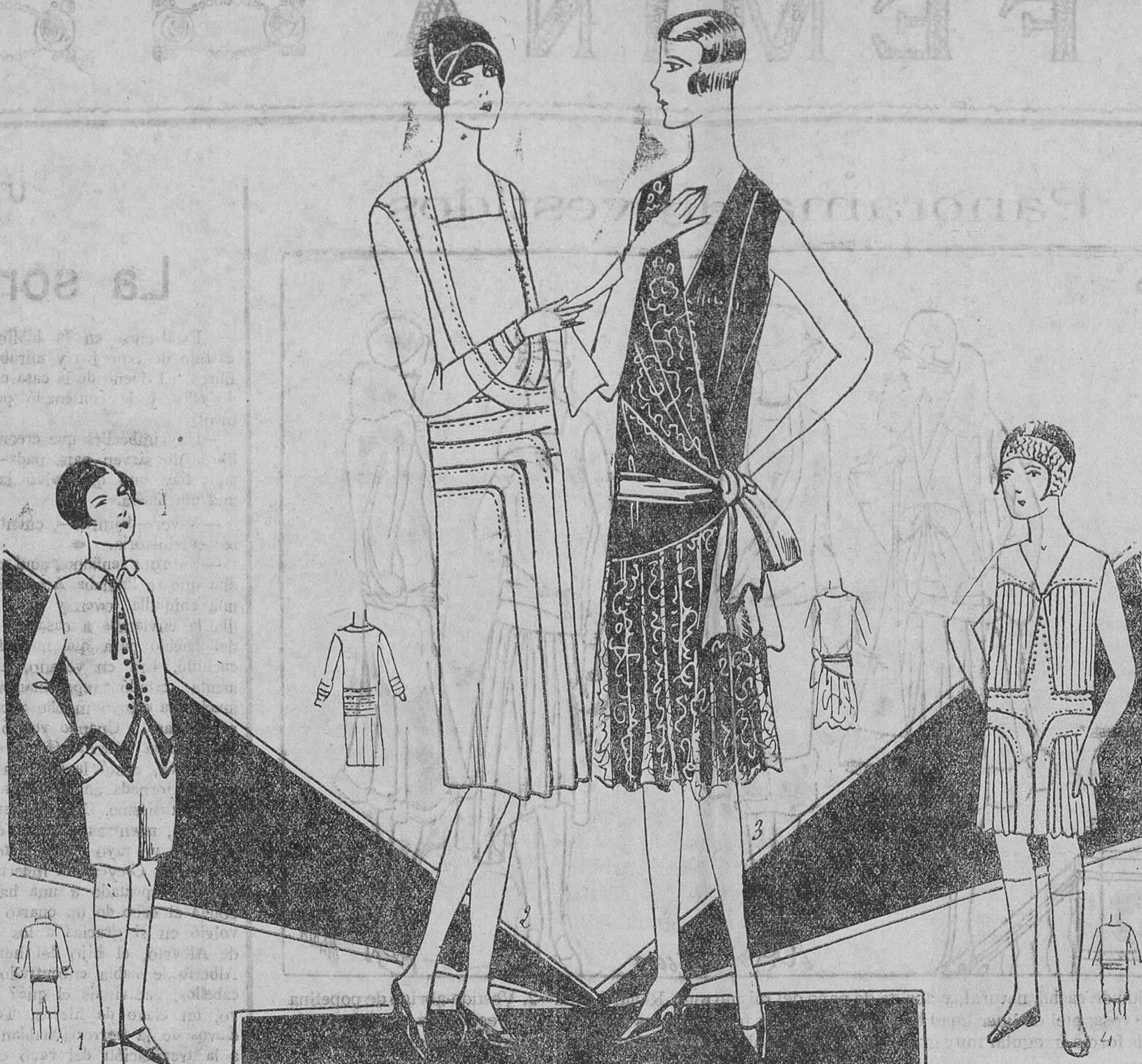
1. Trajecito de niño, en otomán color beige y satén castaño. Medraje: 1 m. 65 por 1 m. y 50 cms: de satén castaño.—2. Vestido de sarga blanca adornado con pespuntes. Medraje: 3 m. 30 por 130 cms.—3. Vestido de crepón satén negro y encaje negro sobre velo color rosa pálido. Medraje: crepón satén 2 m. 75 por 1 m. Encaje 2 m. 75 por 80 cms. Cinturón color de rosa.—4. Vestido para niña de crepón de China, color crema. Medraje: 2 m. por 1 m.