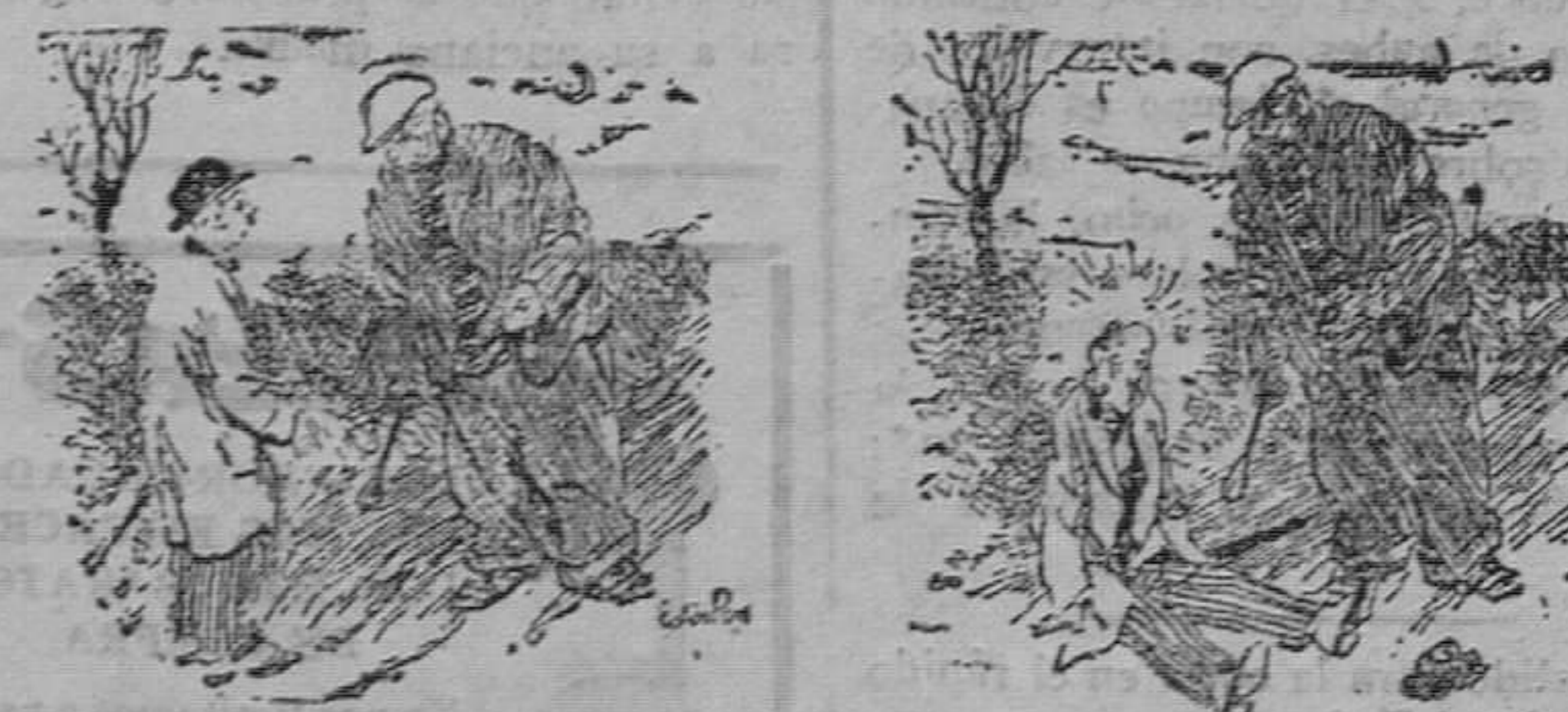
El robado.—No podría usted darme cualquier cosa que atestiguará que he sido desvalijado, para enseñársela a mi esposa? El ladrón de caminos.—Con mucho gusto. ¿Tiene usted bastante?

LA EMPRESA de ANUNCIOS GARCIA FAYOS HA TRASLADADO SUS OFICINAS de la calle de SERRANOS, núm. 14, entresuelo, a Calle BARCAS, 8, y PASCUAL y GENIS, 4 (Entrada por Pascual y Genis) (Edificio del BANCO HISPANO AMERICANO) Telefono 13918 Apartado 354 VALENCIA