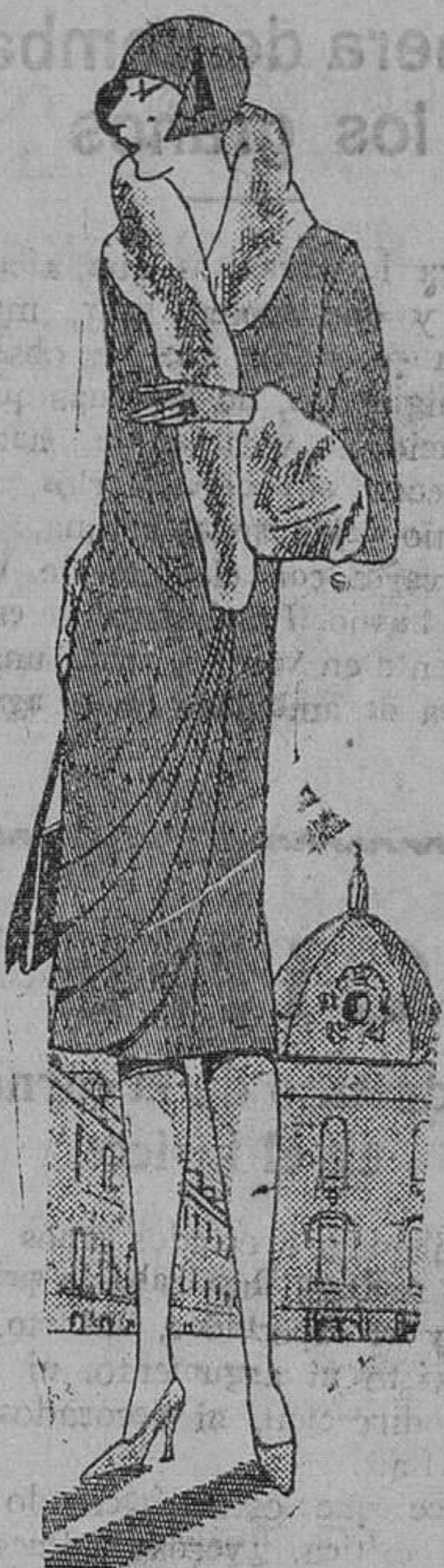
Abrigo en drapella beige, con cuello chal y carteras de renard. Tres bieses, formando volante, adornan dicha prenda