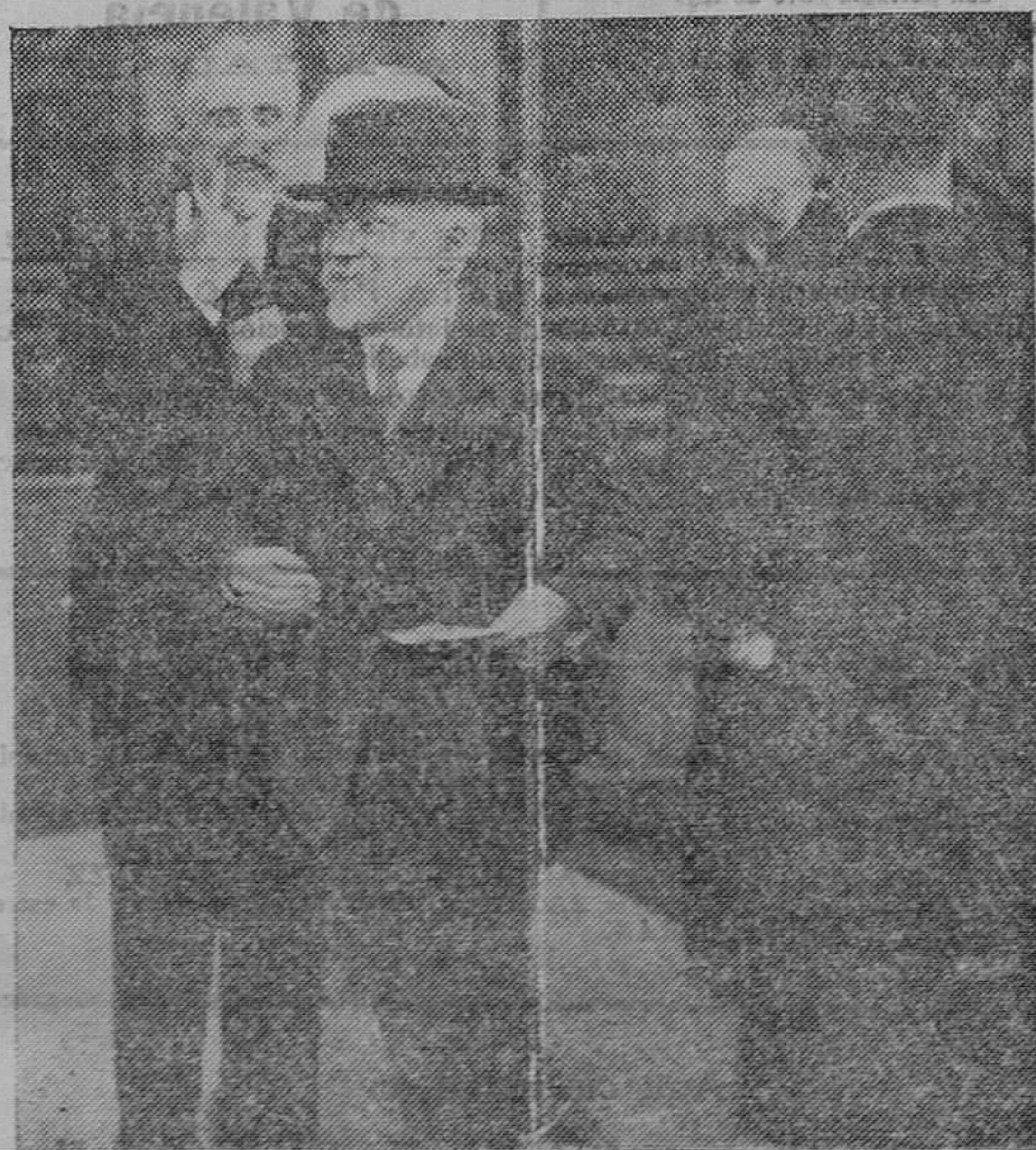
Mr. POINCARÉ saliendo del palacio del Eliseo después del Consejo de ministros