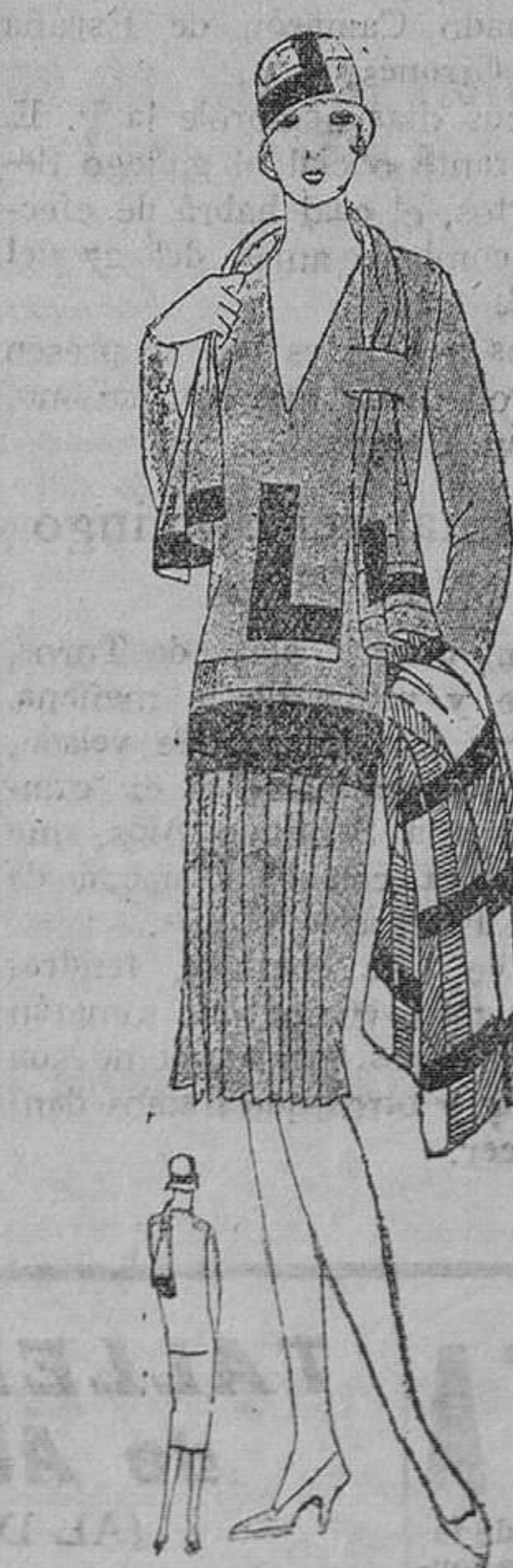
Traje en jersey azul pastel. La falda va pisada en el delantero y el jumper avalado por un amplio cuello. Se refuerza con bandas de azul más intenso.