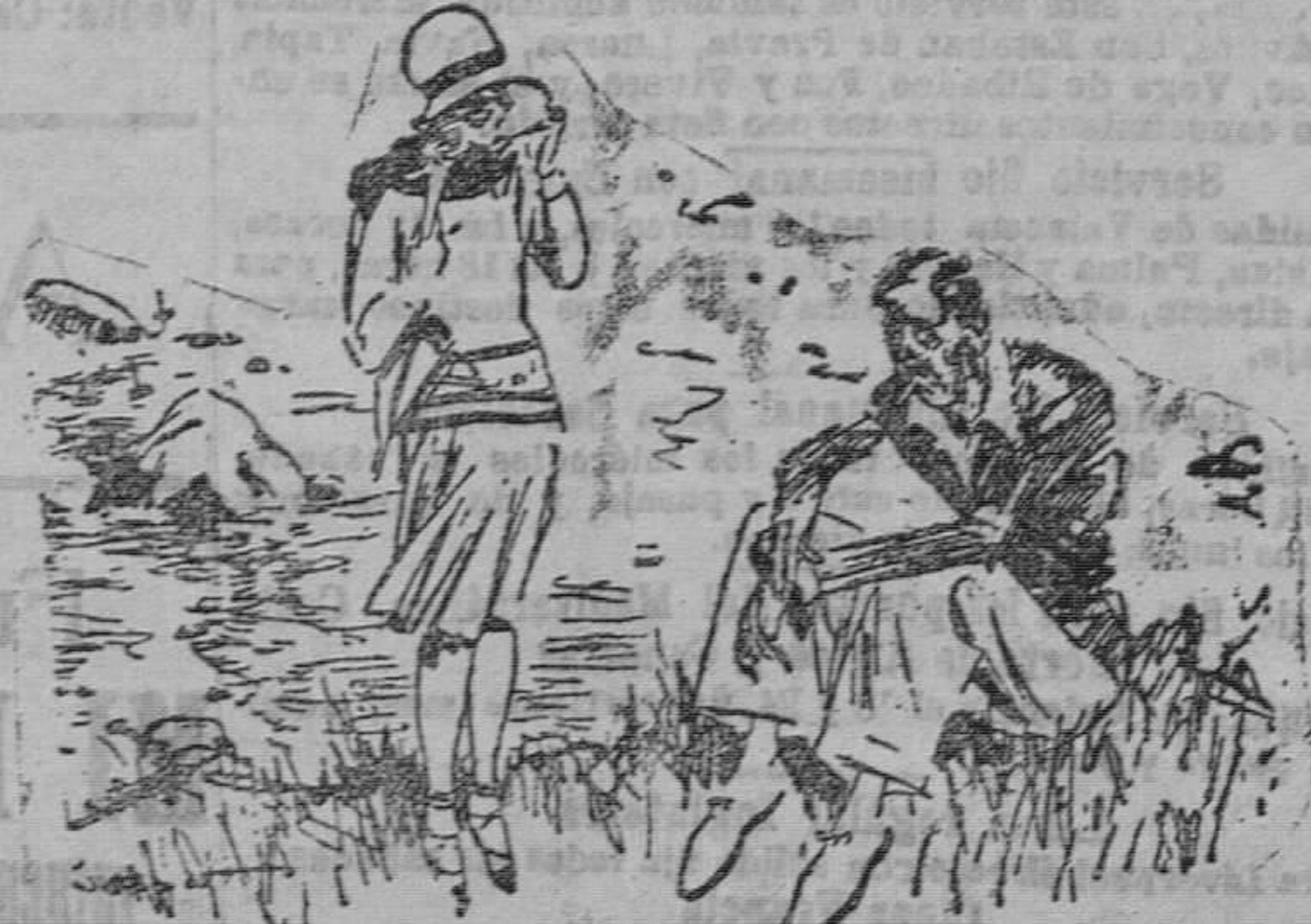
Ella.—¿Qué te respondió papá cuando tú le dijistes que no podías conciliar el sueño de tanto que pensabas en mí? El.— Me ofreció colocarme de sereno en vuestra fábrica.