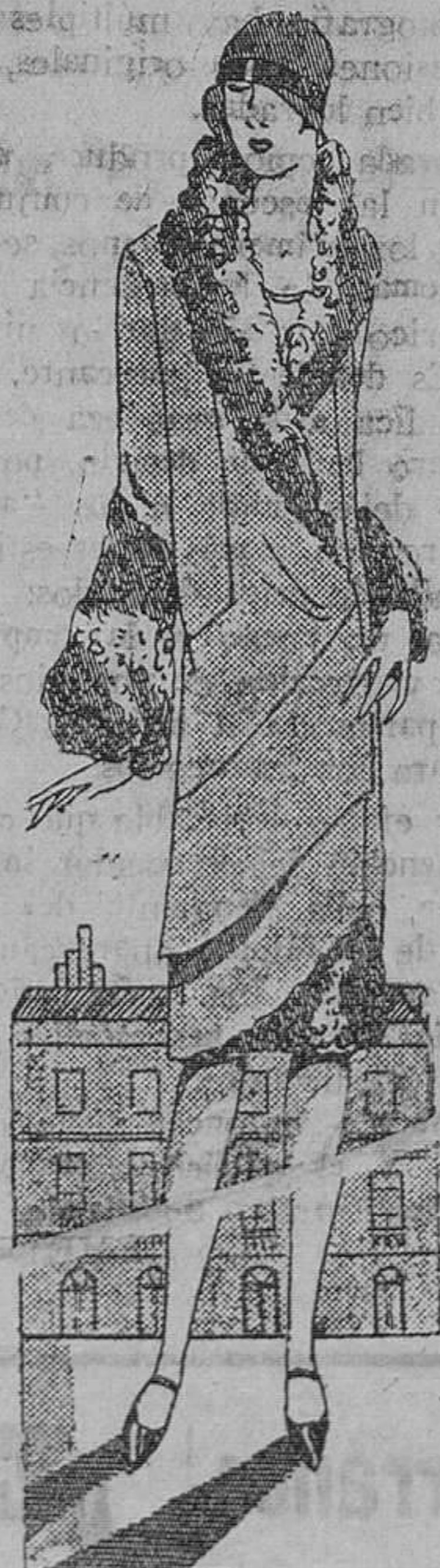
Abrigo en paño gris adornado en astracán gris oscuro. Un volante plano remonta hasta el cuello-chal

—Y terminó casándose con el carpintero—preguntó la dama sentimental.