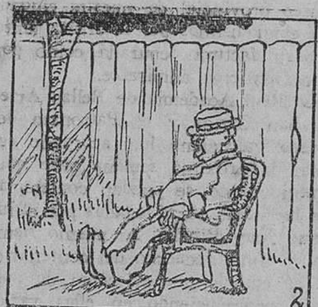
2. O hurrear por doquier, en busca de aventuras. El día que os lo presentamos, iba el hombre por leche a la granja próxima, cuando una valla de jardín le dió la tentación de ver