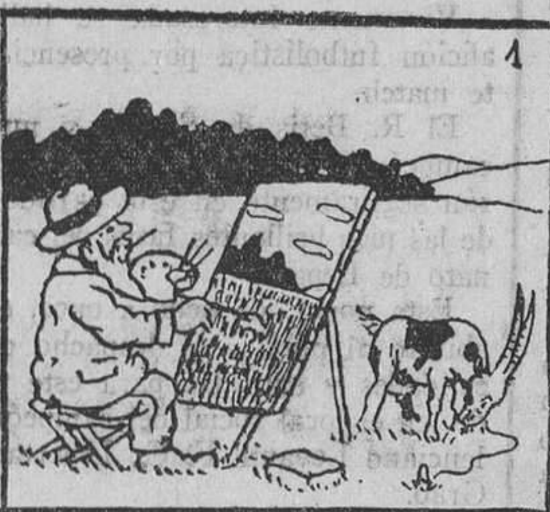
1. El pintor Pincelillo proyectaba un gran lienzo, estudio del natural, para la Exposición.