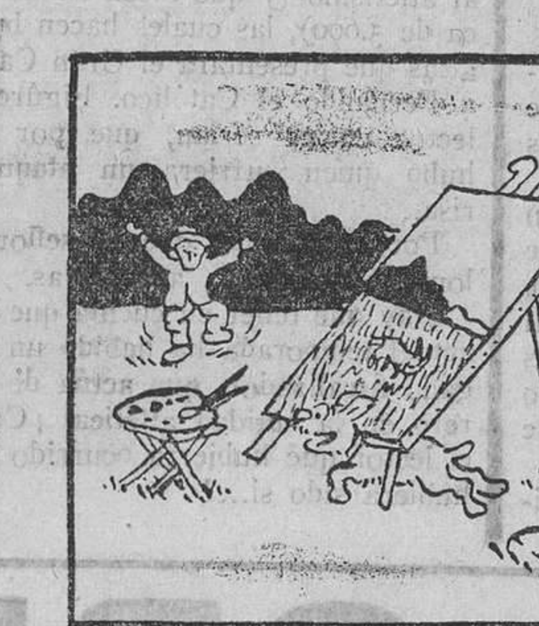
4. le ladraba furiosamente a la cabra, que, no pudiendo soportar la