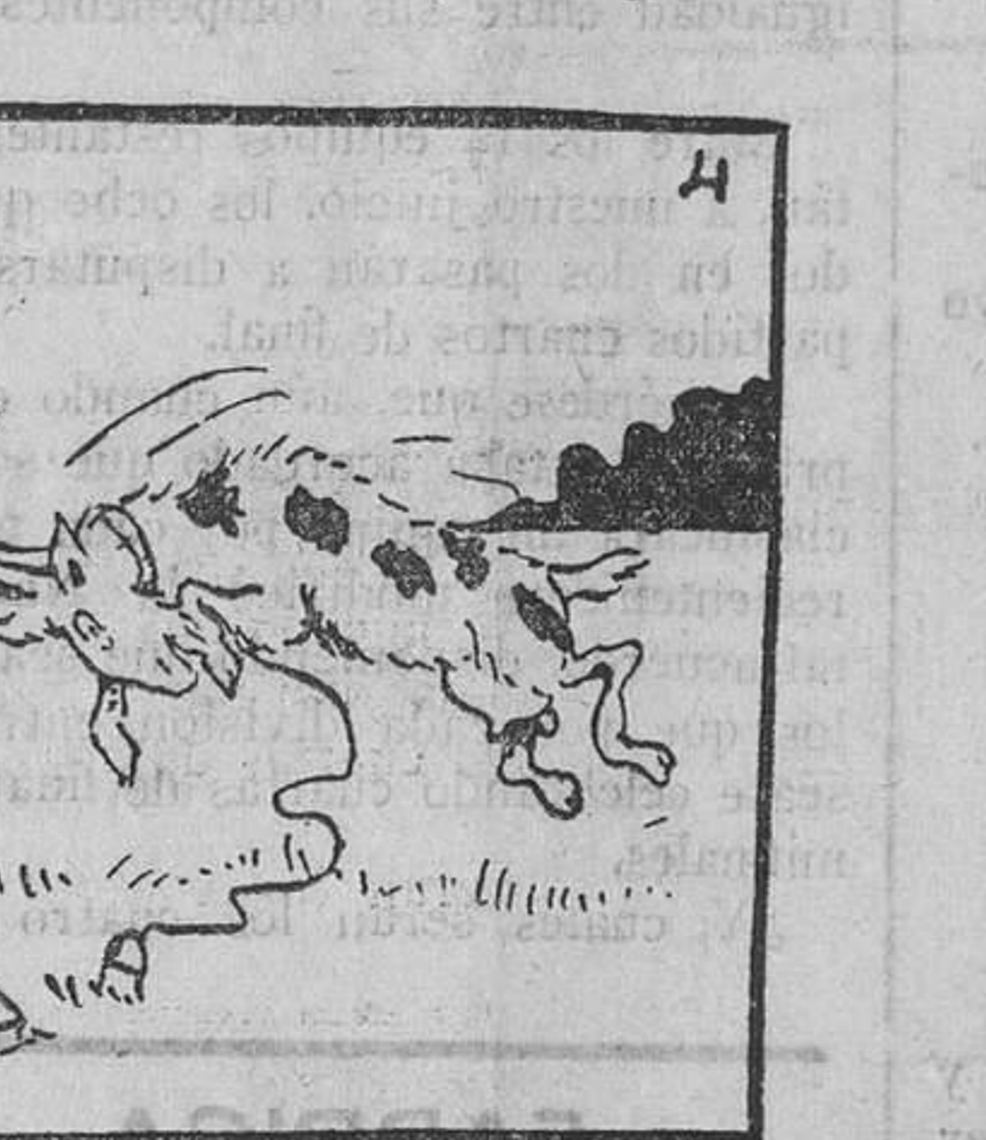
signada aquellos insultos, arremetió contra el can.

Se había equivocado, pero no daba su brazo a torcer. Así era de "cabezota" nuestro héroe. Y dicen que desde entonces siempre decía: 7 por 7, 44; corrió cual todas las culebras le saían mal; pero se salta con la suya.