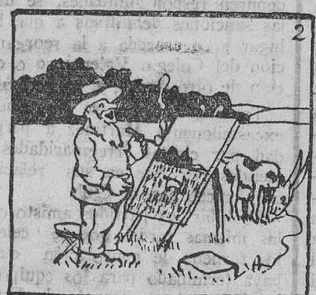
2. Y cada día se iba al campo a seguir su obra, del que era modelo una hermosa cabra.