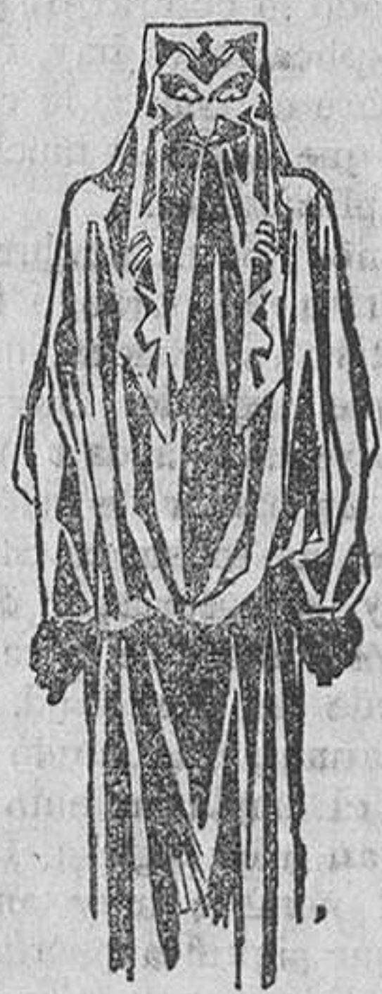
El más impenetrable misterio rodea a Belfegor, el fantasma del Louvre

ces decidirán qué literatura sobre el cinematógrafo debe adquirir la Universidad.