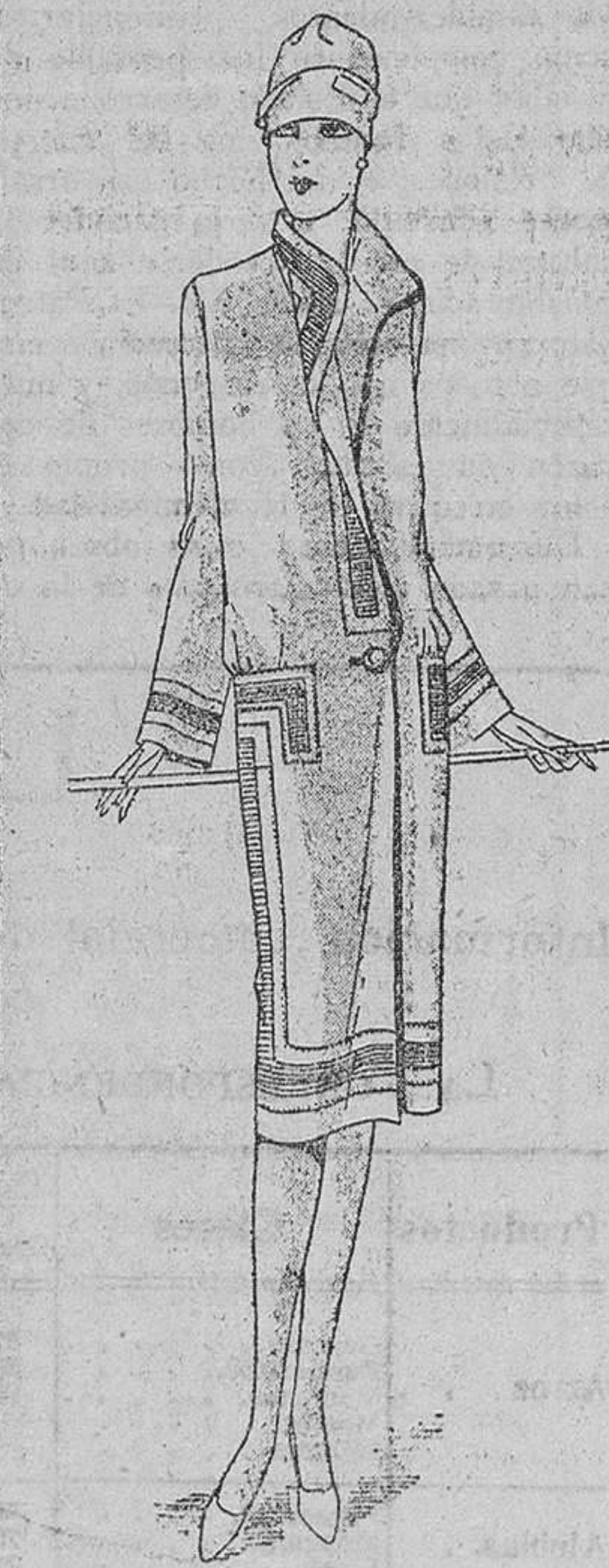
Otro modelo en el que todo el adorno son las nervaduras. Se confecciona en kasha blanca.

Un medio muy delicado de perfumar la ropa, consiste en dejar que se evaporen los frascos de esencia dentro de nuestros armarios; de este modo se obtiene un más tenue—y más