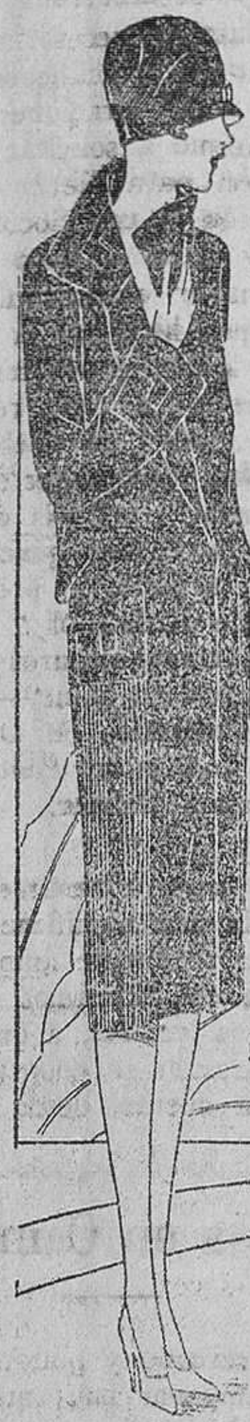
Abrijo en crepella rojo viejo, adornado por recortes del propio tejido, ribeteados de seda de igual tono. Bajo las caderas, dos grupos de nervaduras.

En un pliego de papel de marca bien recio, se extienden lonjas delgadas de tocino, muelas de limón, de cebolla, zanahorias, sal, pimienta, especia, clavillo, y se acomoda en medio el capón y se envuelve, sujetando fuertemente el papel con un bramante; dispuesto de este modo, se ensarta en el asador. Móndense y háganse trozos diez o doce manzanas para cocerlas con seis onzas de azúcar resregada antes en la corteza de dos naranjas, y sobre esta compota se sirve el capón asado ya y desmenuzando el papel y demás adherentes.