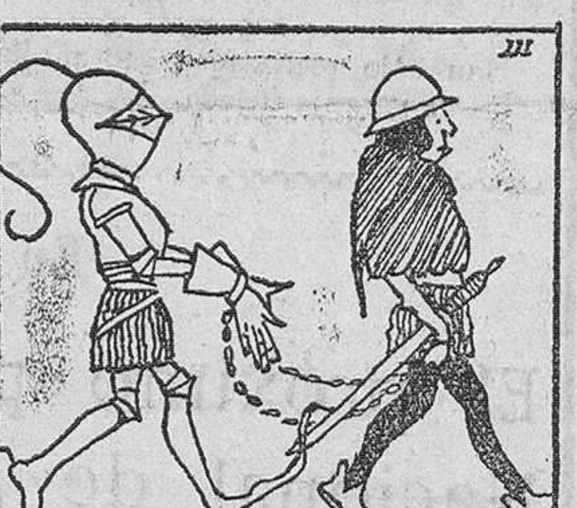
3.—y gozoso y satisfecho, pensando en la magnífica recompensa que le aguardaba, echó a andar hacia su feudal castillo.