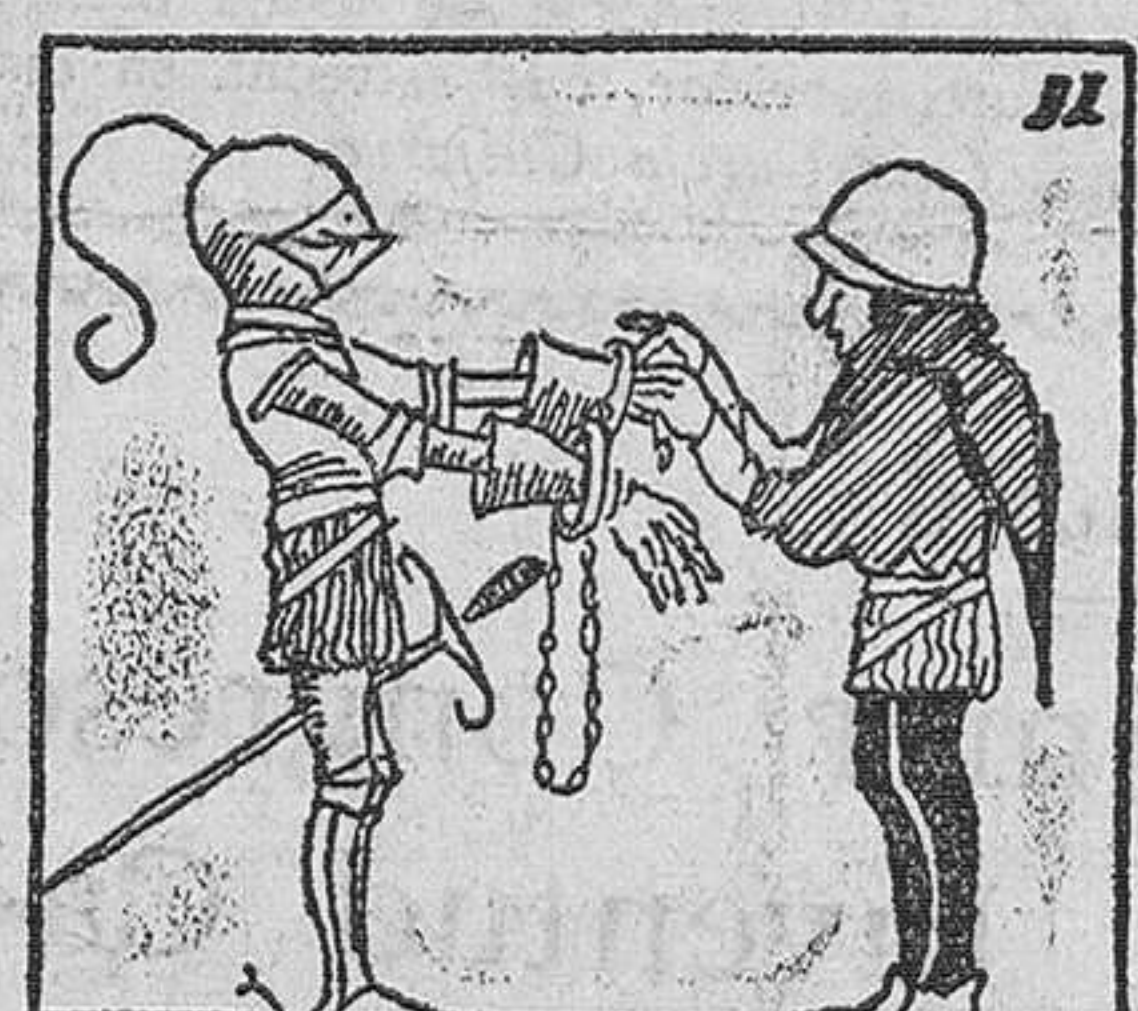
2.—el cual se apresuró a esposarle convenientemente, con unas esposas que a prevención llevaba, por un si acaso...