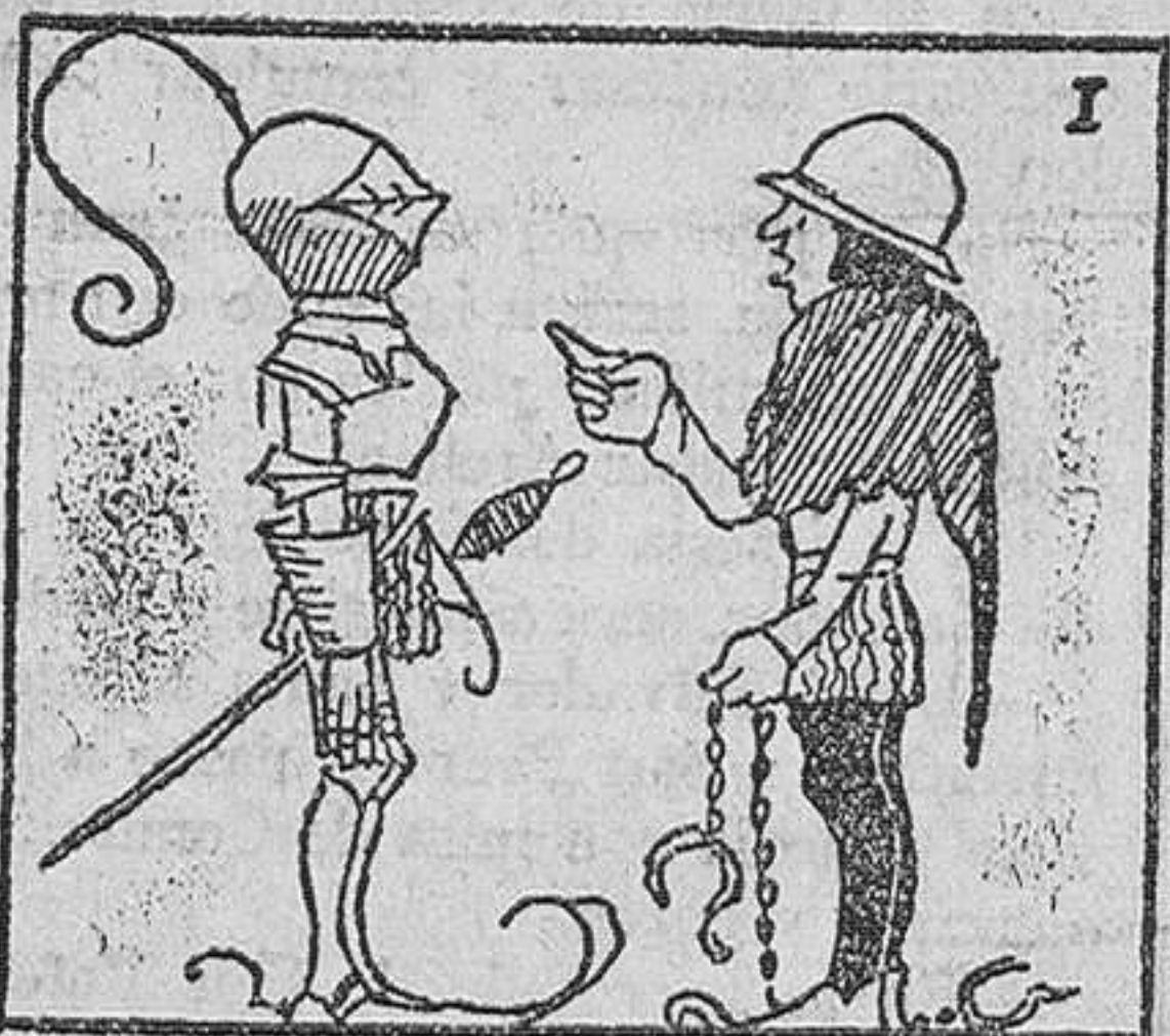
1.—Don Ferrán Ferrante de la Ferradura, por un descuido, fué hecho preso por un siervo de su rival, don Martín Martillete del Martillo.