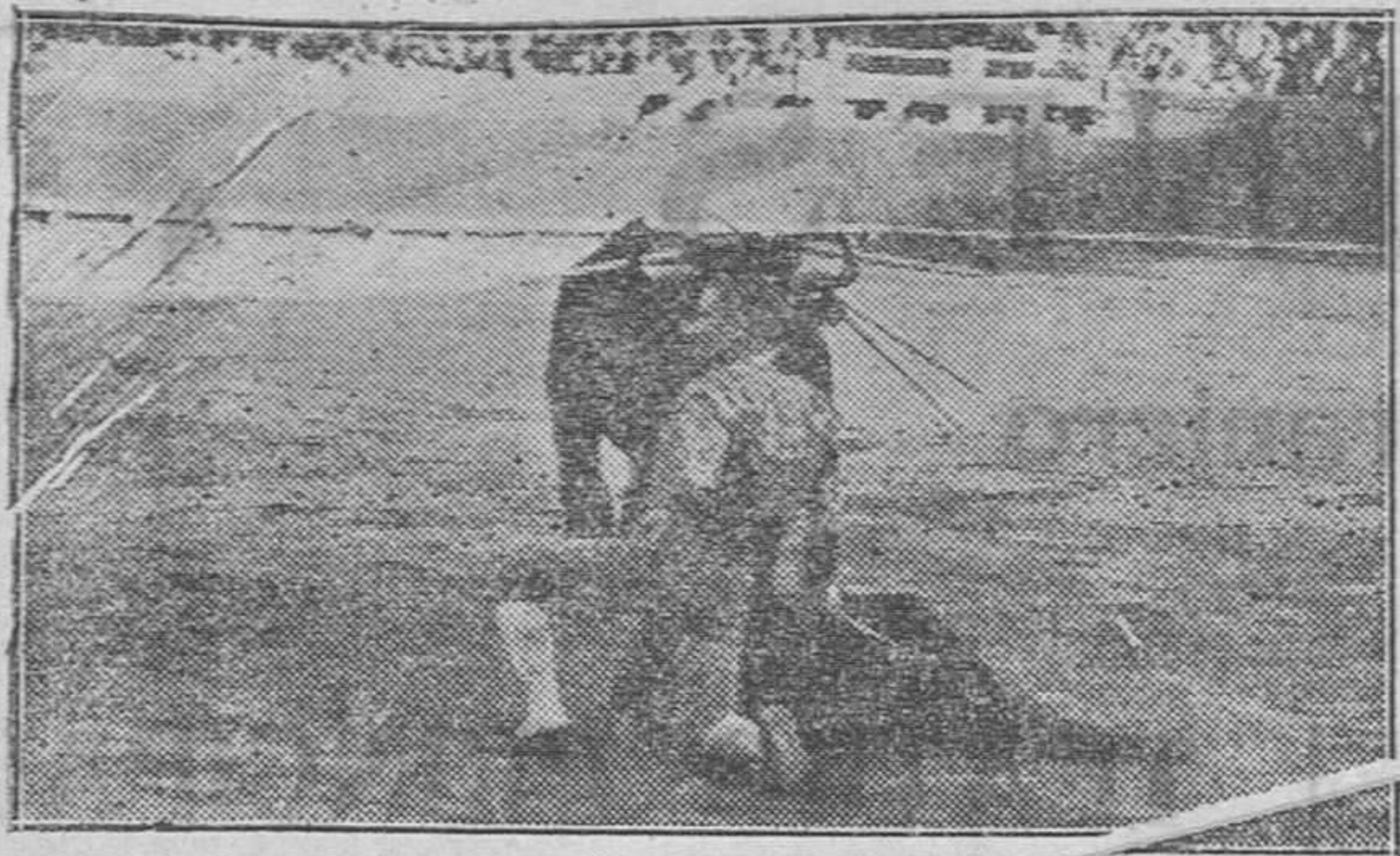
Un adorno de Torerito, de Málaga