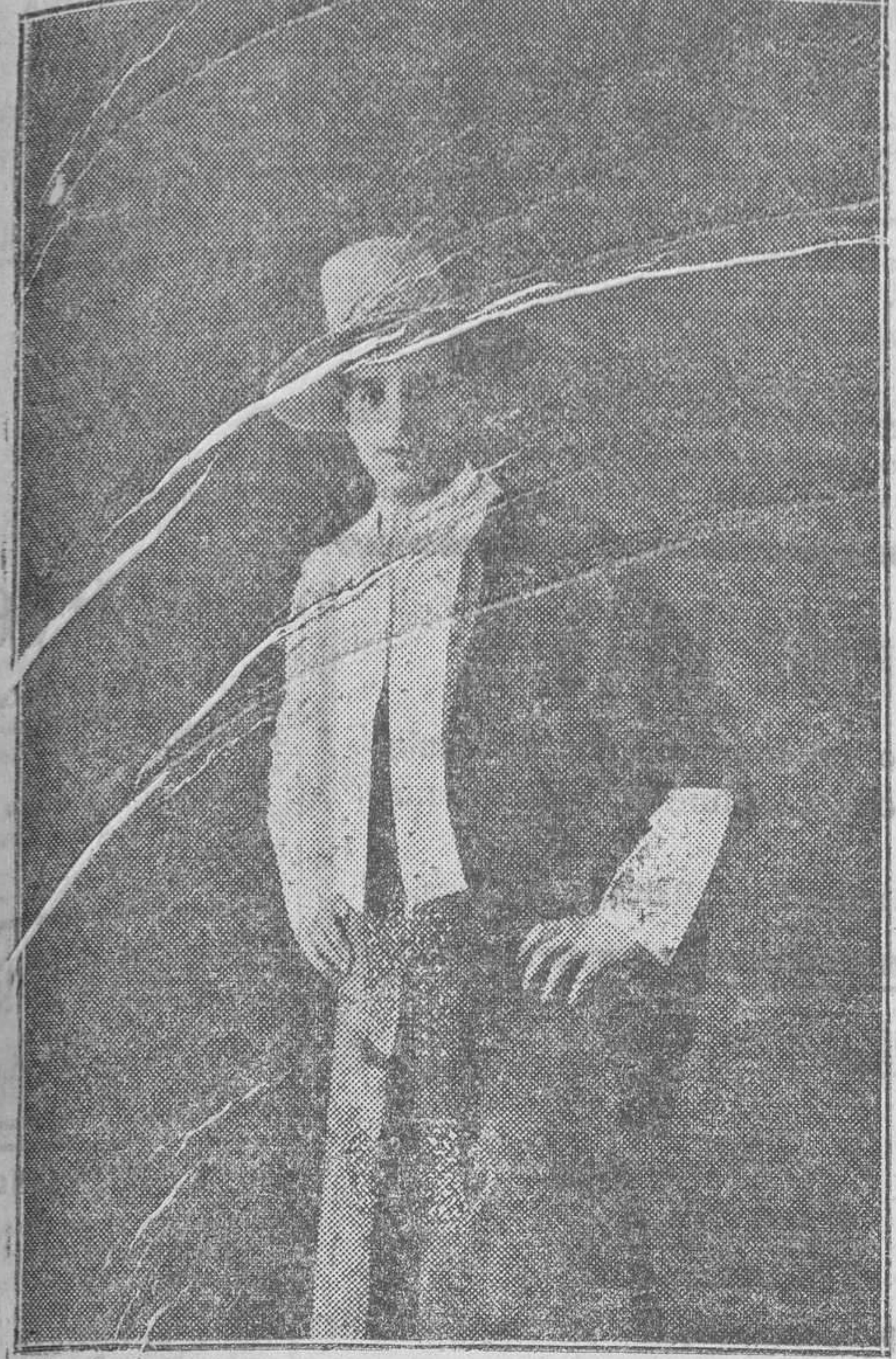
Fotogra a Boldun