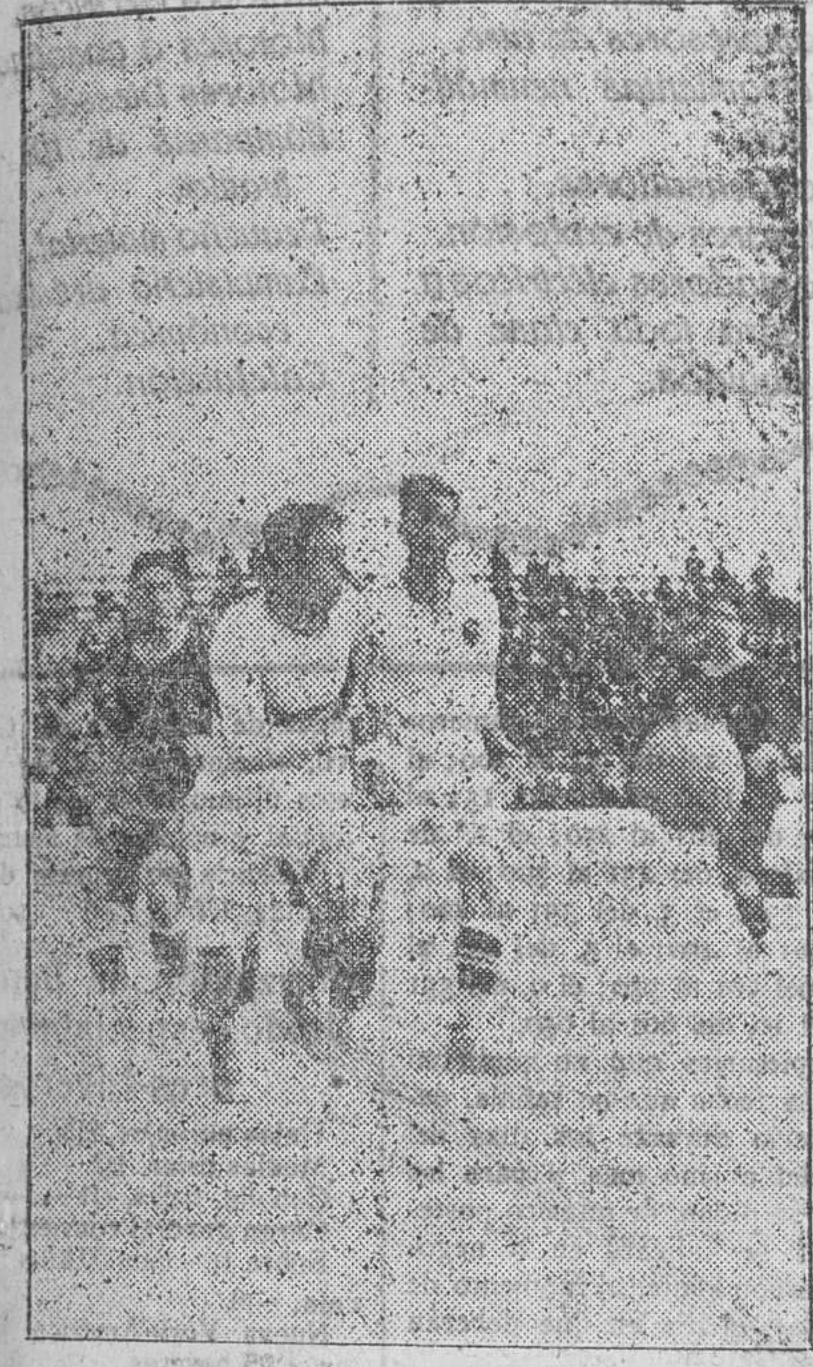
March, acosado por Peral, desvía fácilmente un balón

Los partidos en que tomó parte fueron para sus contrincantes motivo de dudas e inquietudes, y esto ya tan solo les debe satisfacer. *** Tanto el España como el Stadium, antiguos enemigos, se han seguido muy de cerca, y en la lucha adquiere ventaja el Stadium, el cual ve sus colores imbatidos por los rojos, y aún apuntándose en el segundo partido una bonita victoria, que colma quizás todo su anhelo. A más, el lucido papel hecho en el partido de ayer en Mestalla, como también el España en Burjasot, y anteriormente en Alicante, sin que les pueda inquietar para nada el lugar de la cola, hace que estos equipos hayan jugado su debido papel en el presente campeonato. El Burjasot, nuevo en estas lides y con las dudas de su incorporación al grupo A., no pudo preparar a tiempo su equipo, por lo que su actuación ha quedado reducida a un plano modesto, no exento de notoria voluntad y entusiasmo en su nueva y grata situación.