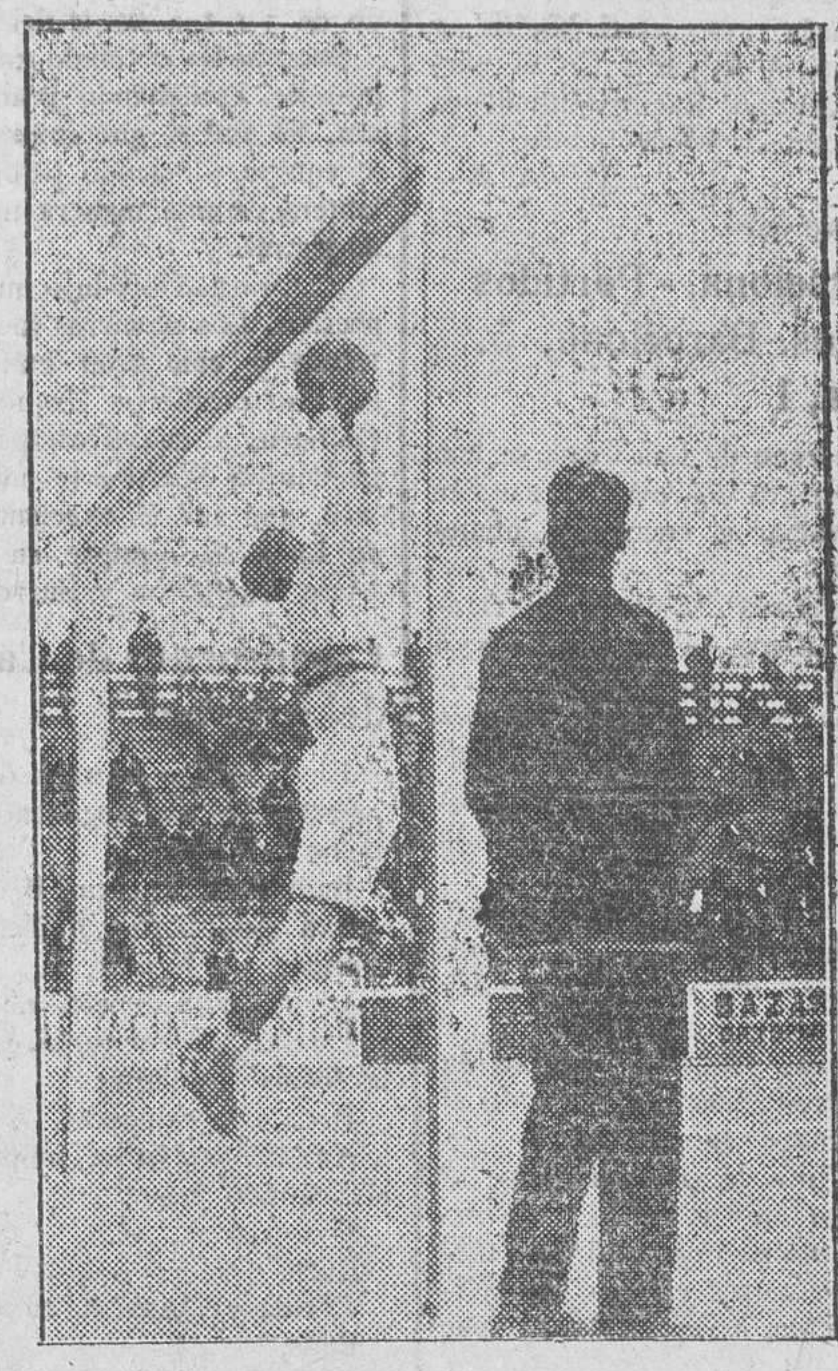
Una buena parada del guardameta del Stadium

En el campo del Burjasot F. C. se jugó este partido, último de campeonato, entre los equipos arriba citados. Durante todo el partido el dominio fue eterno, lanzándose seis cor-