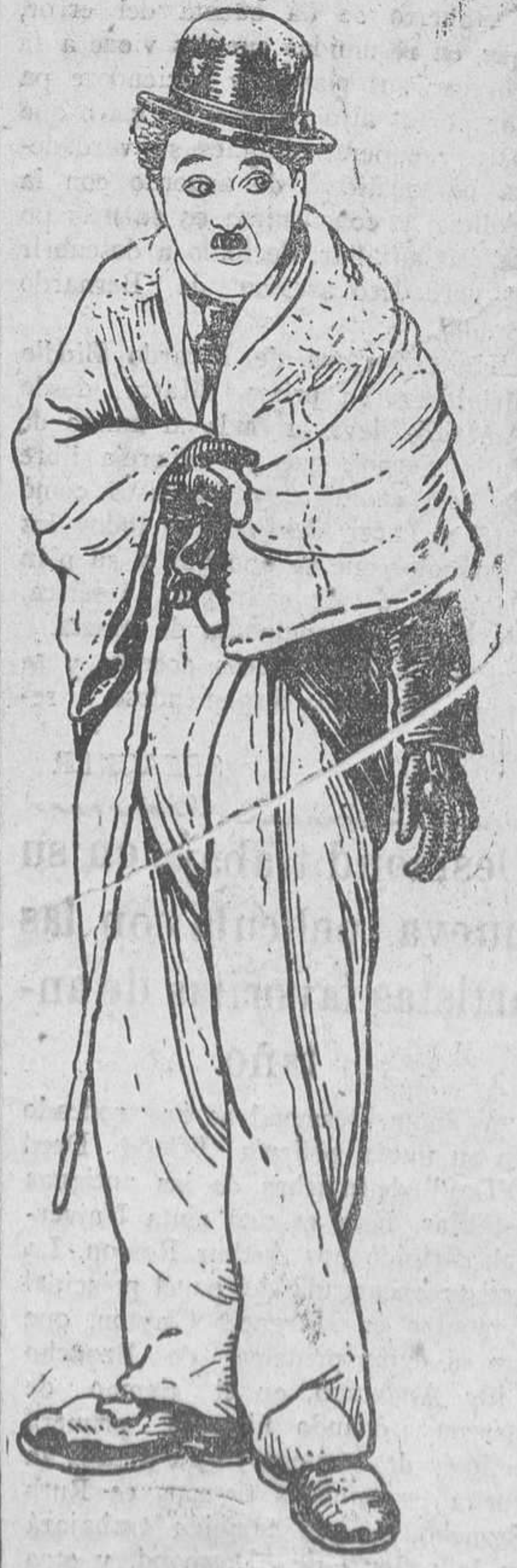
Charles Chaplin (CHARLOT) EN La quimera del oro