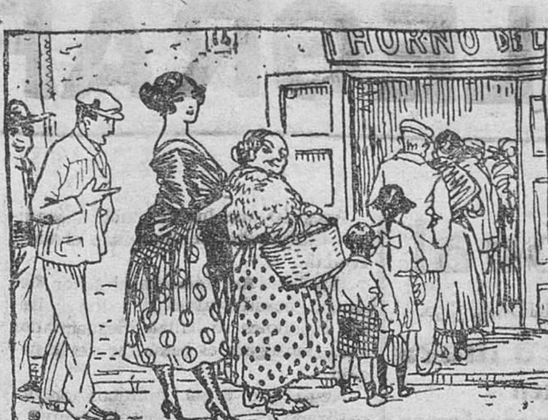
También es malo y es caro y es inaguantable el pan; pero a la puerta del horno haciendo la cola están.