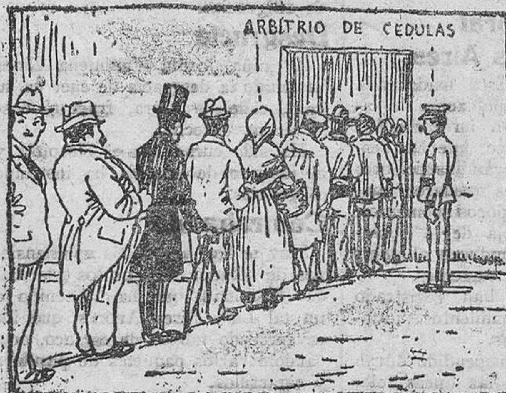
Siempre arrimado a la cola el público en general; ¡¡¡ha de hacer cola esperando la cédula personal.