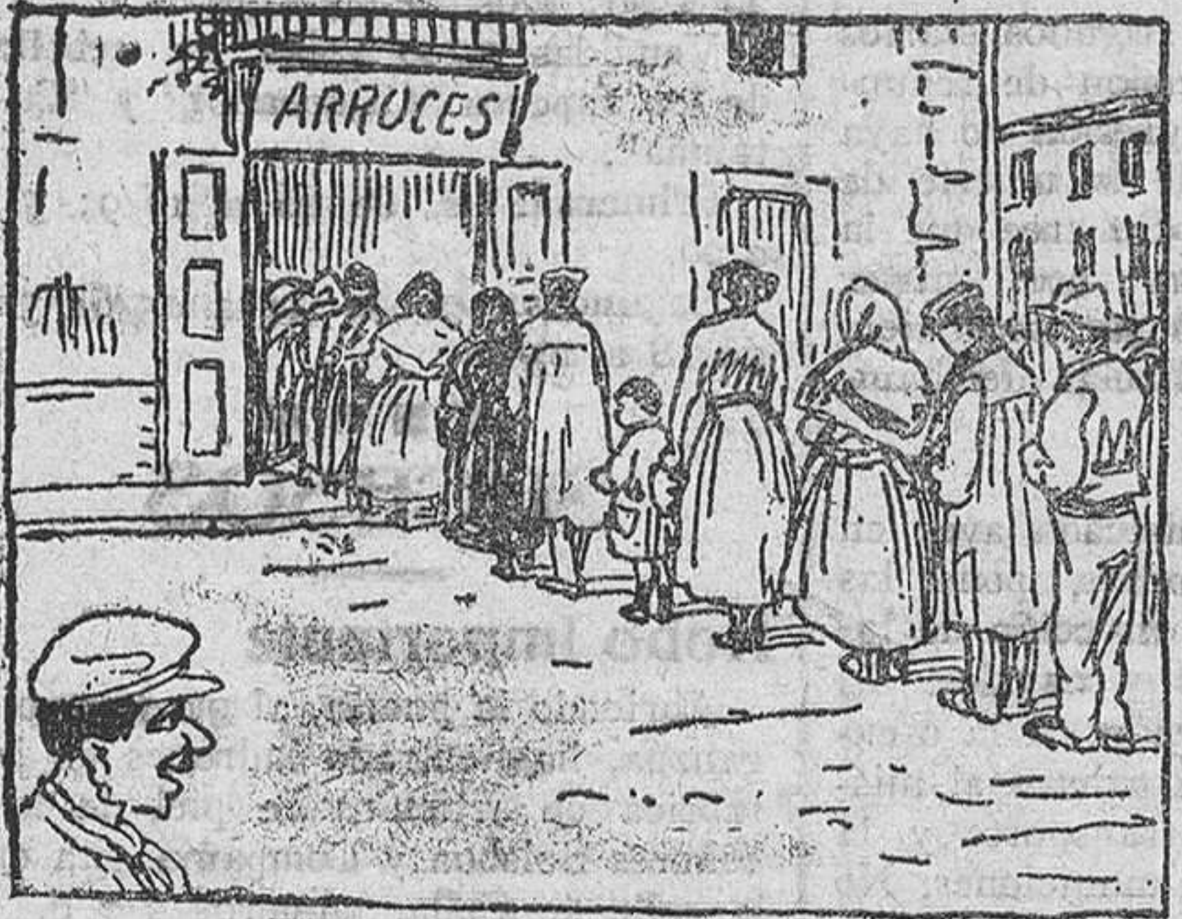
El arroz fuera de coto nos daña de un modo atroz; ¡pero también se hace cola para comprar el arroz!