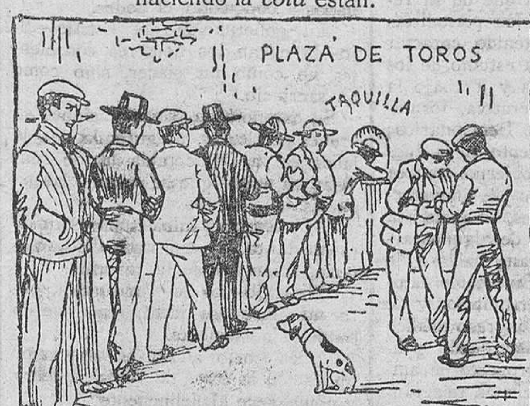
Cuando en la Plaza de Toros torea una «maravilla», también la gente hace cola para llegar a taquilla.