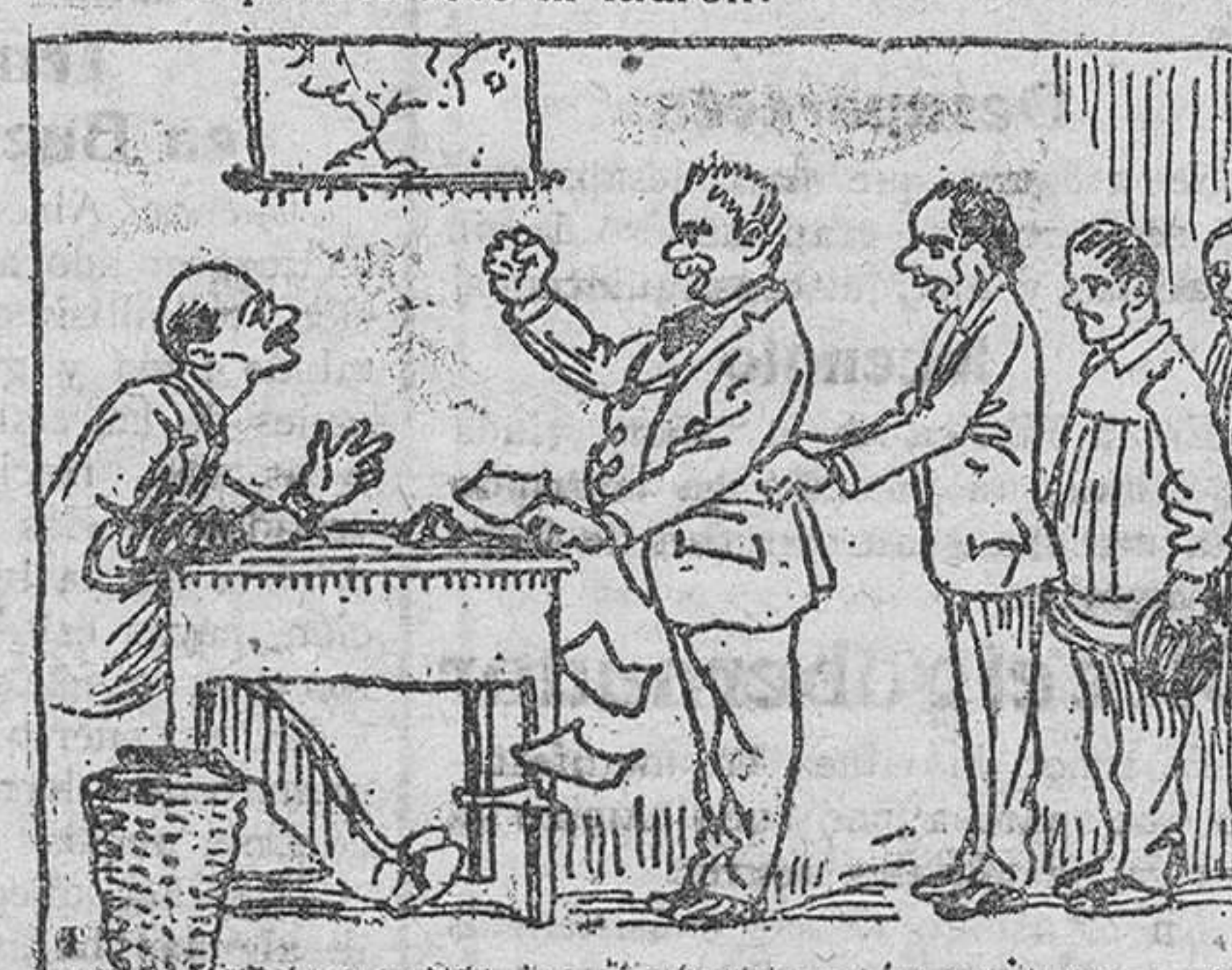
Y como al contribuyente tratan con gran acidez, esta cola se dispara como traca alguna vez.