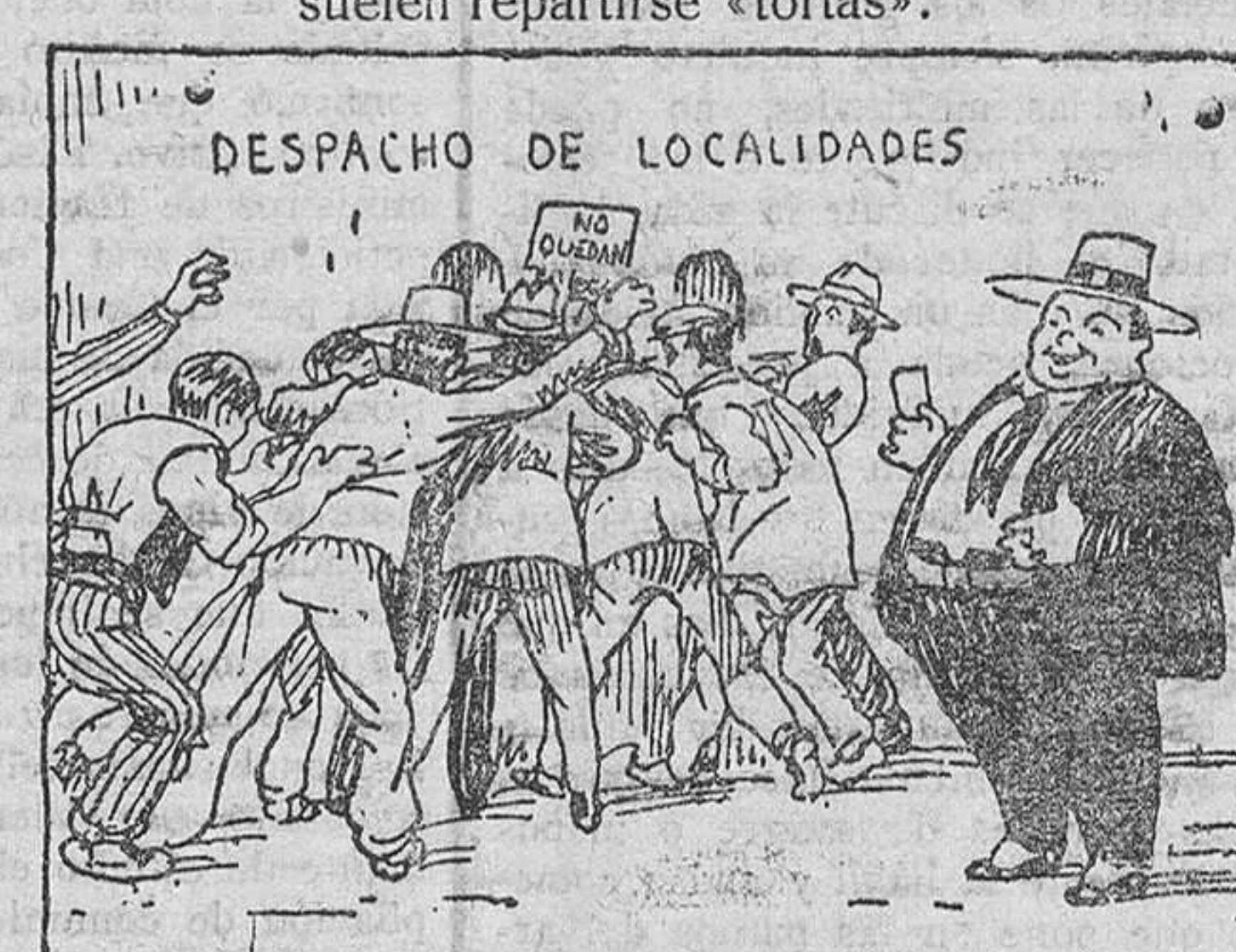
Y como para estas tardes nunca hay bastantes entradas, también se acaba la cola a palos y a bofetadas.