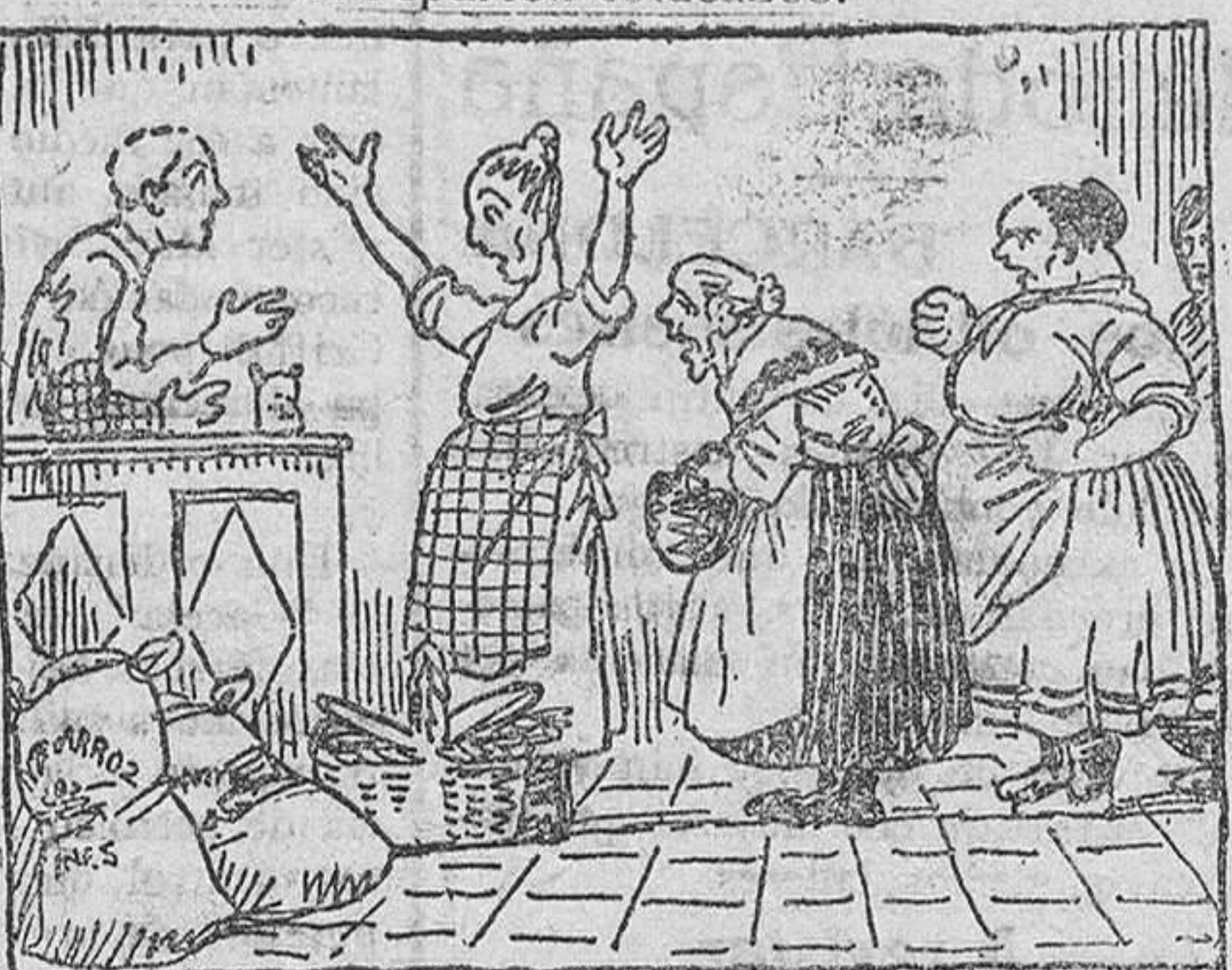
Se vende a un precio excesivo que es una exageración; ¡ni ponen coto al plantel, ni ponen coto al ladrón!