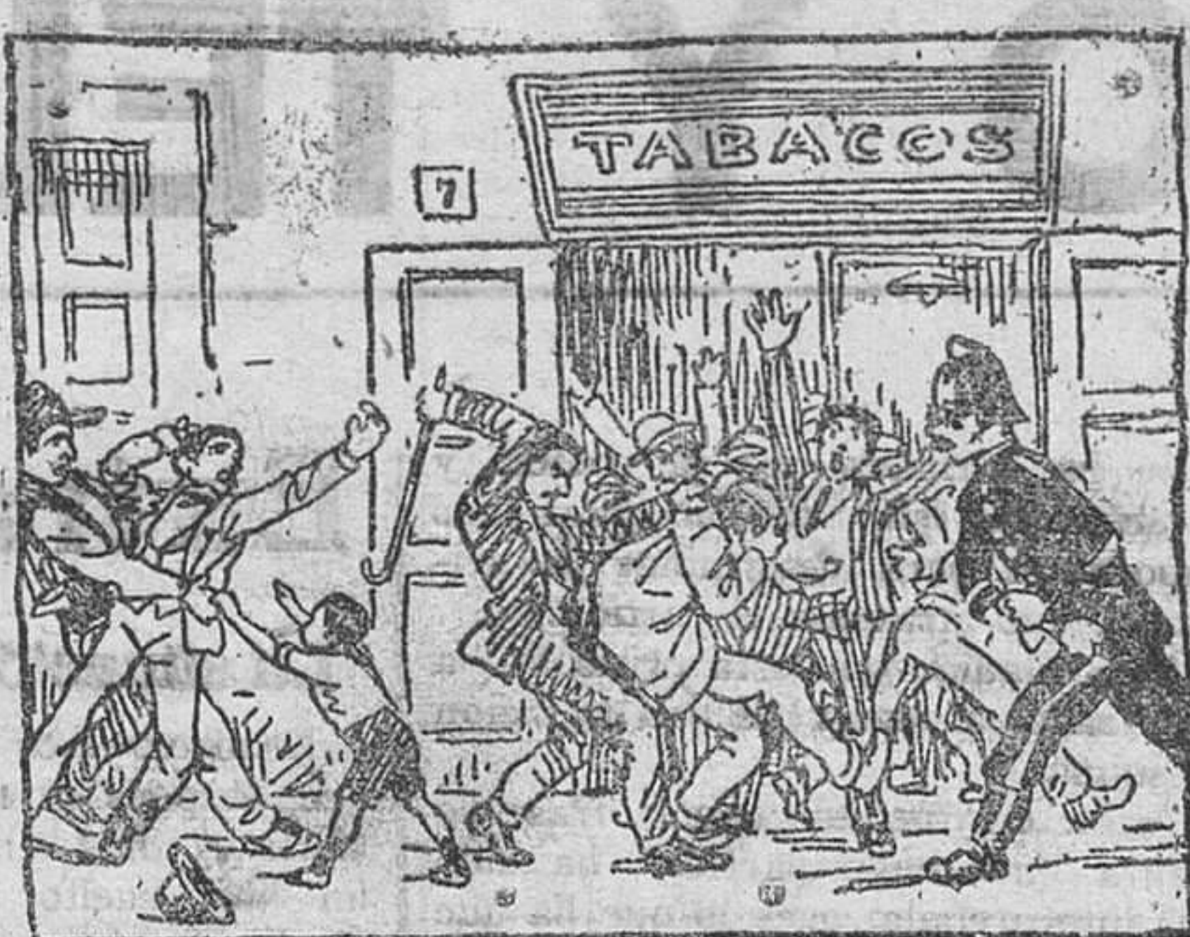
Mientras a sus accionistas reparte el oro a capazos entre los que hacen la cola se reparten estacazos.