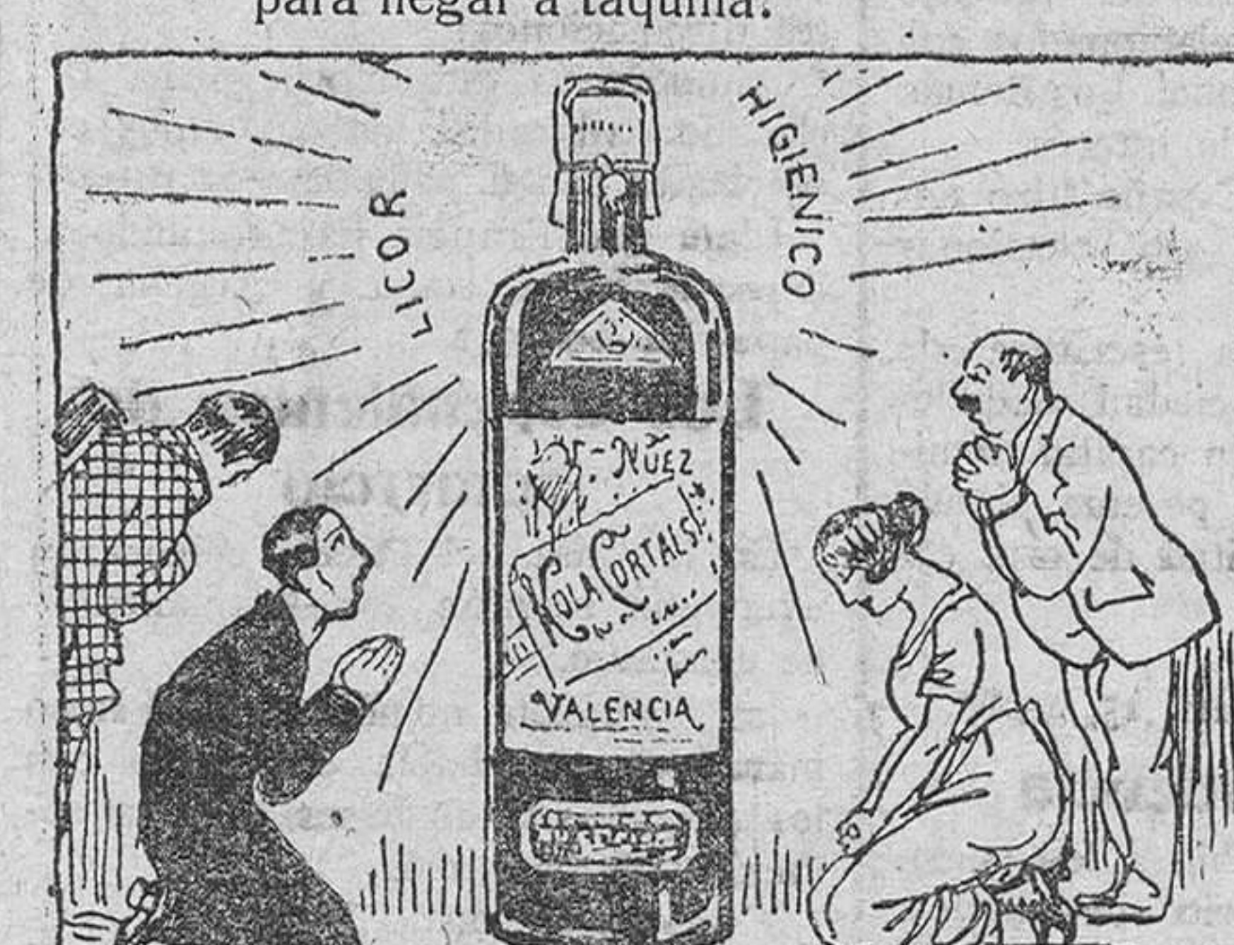
Todo son colas terribles azotes de la nación; sólo hay una buena Kola digna de veneración.