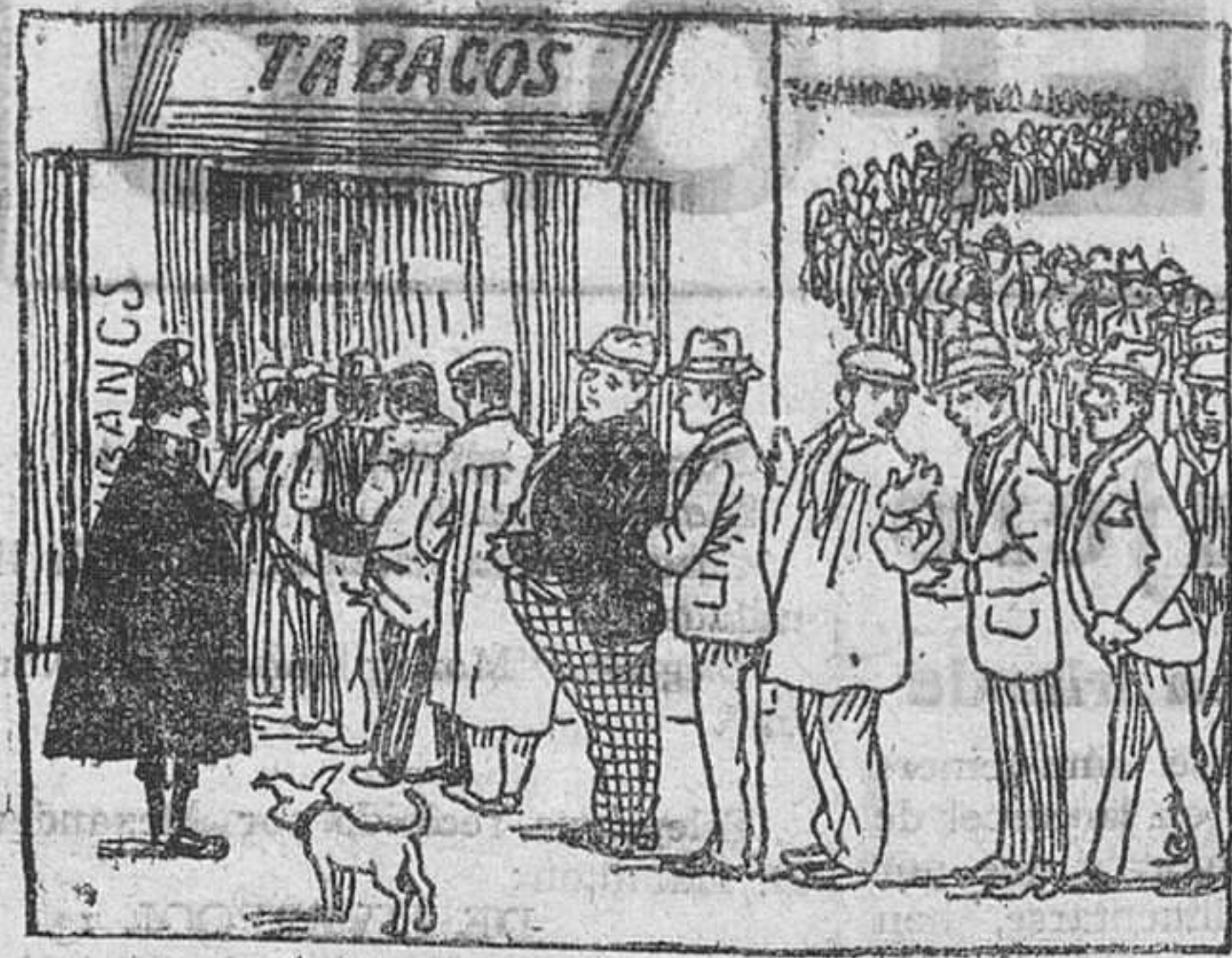
A la puerta del estanco todo el mundo se aglomera esperando las migajas que «da» «La Tabacalera».