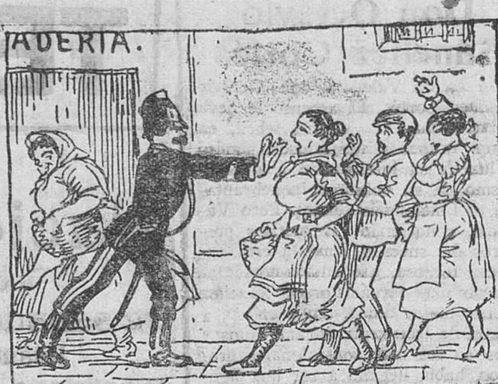
Pero como las hornadas aunque son caras, son cortas, hay veces que en vez de pan suelen repartirse «tortas».