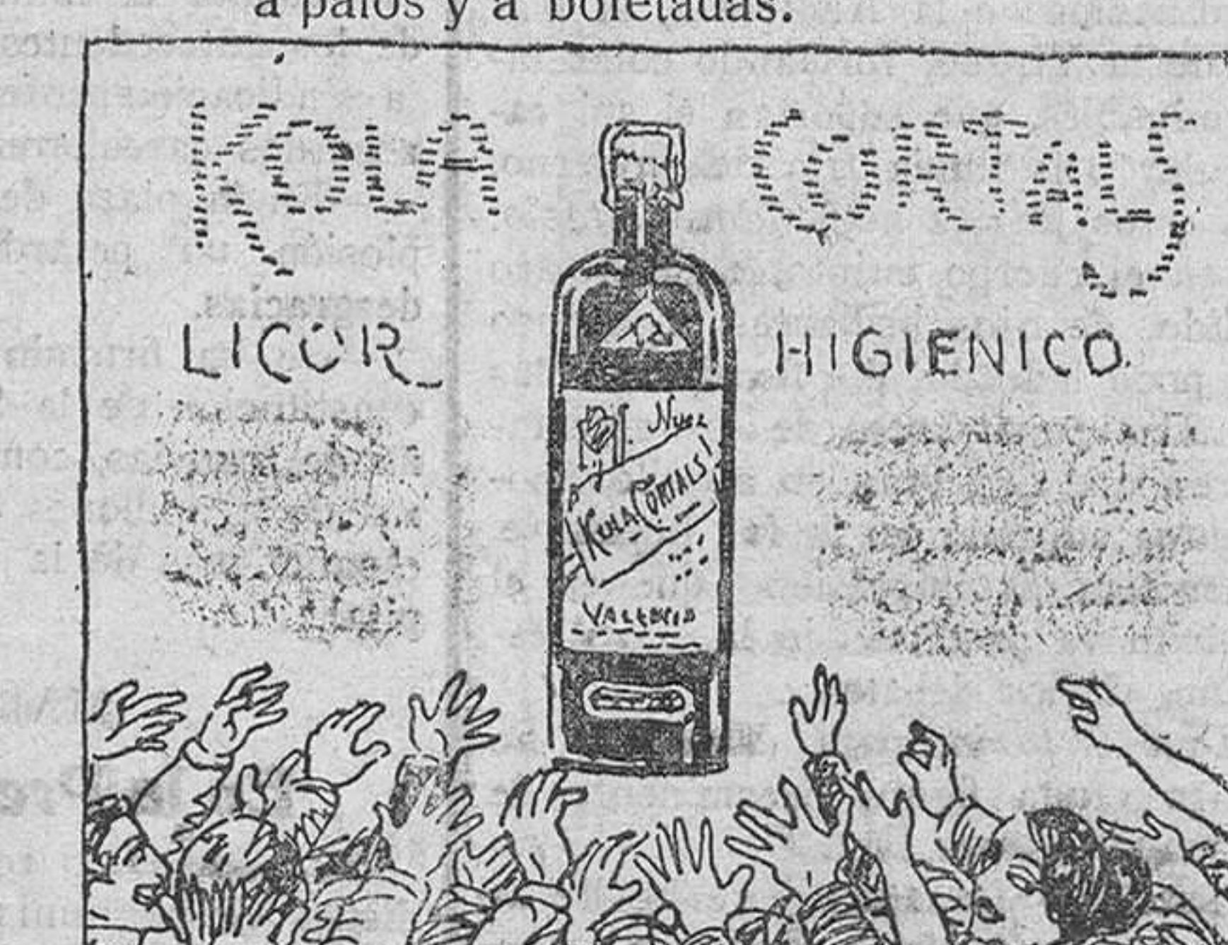
La Kola higiénica y suave que el público necesita; esto es, la KOLA CORTALS deliciosa y exquisita.

Gran licor higiénico KOLA CORTALS Unico fabricante J. Cortals, Valencia.-Exijase siempre legítimo