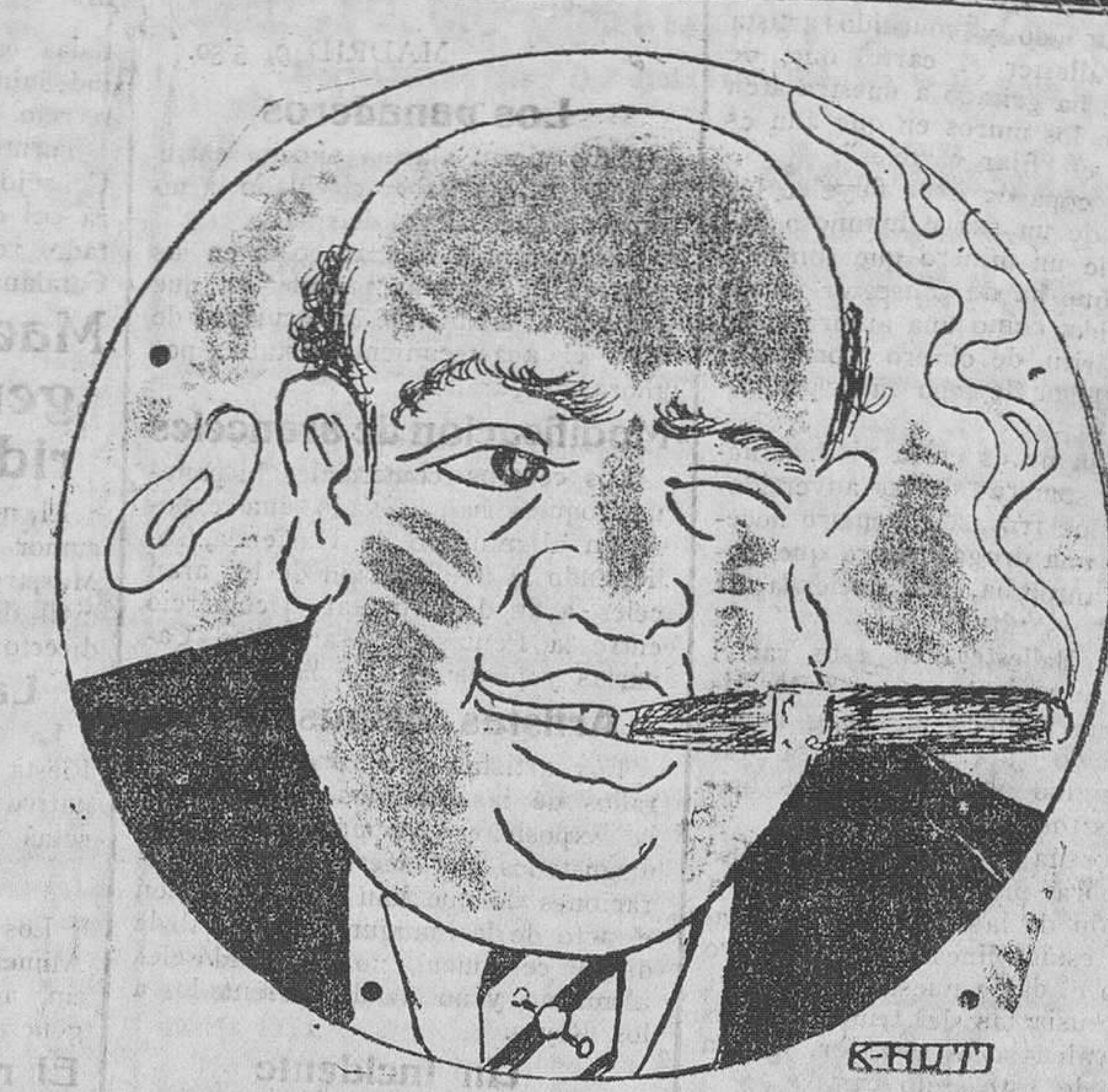
Después de unas copas de Cognac Minero, un buen cigarro puro hace olvidar la carestía de la vida.

Se desea un matricón o sea familia o madre e hija. Indul presentarse sin buenos informes. Salvá, núm. 9, portería.