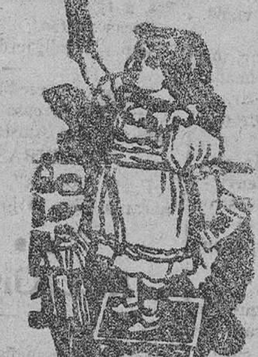
Caja-estuche una peseta

Vente en Farmacias y Droguerías y en la Farmacia Cañizares (abierta toda la noche), con Laboratorios Químico y de esterilización, anexo Caballeros, 68 Valencia