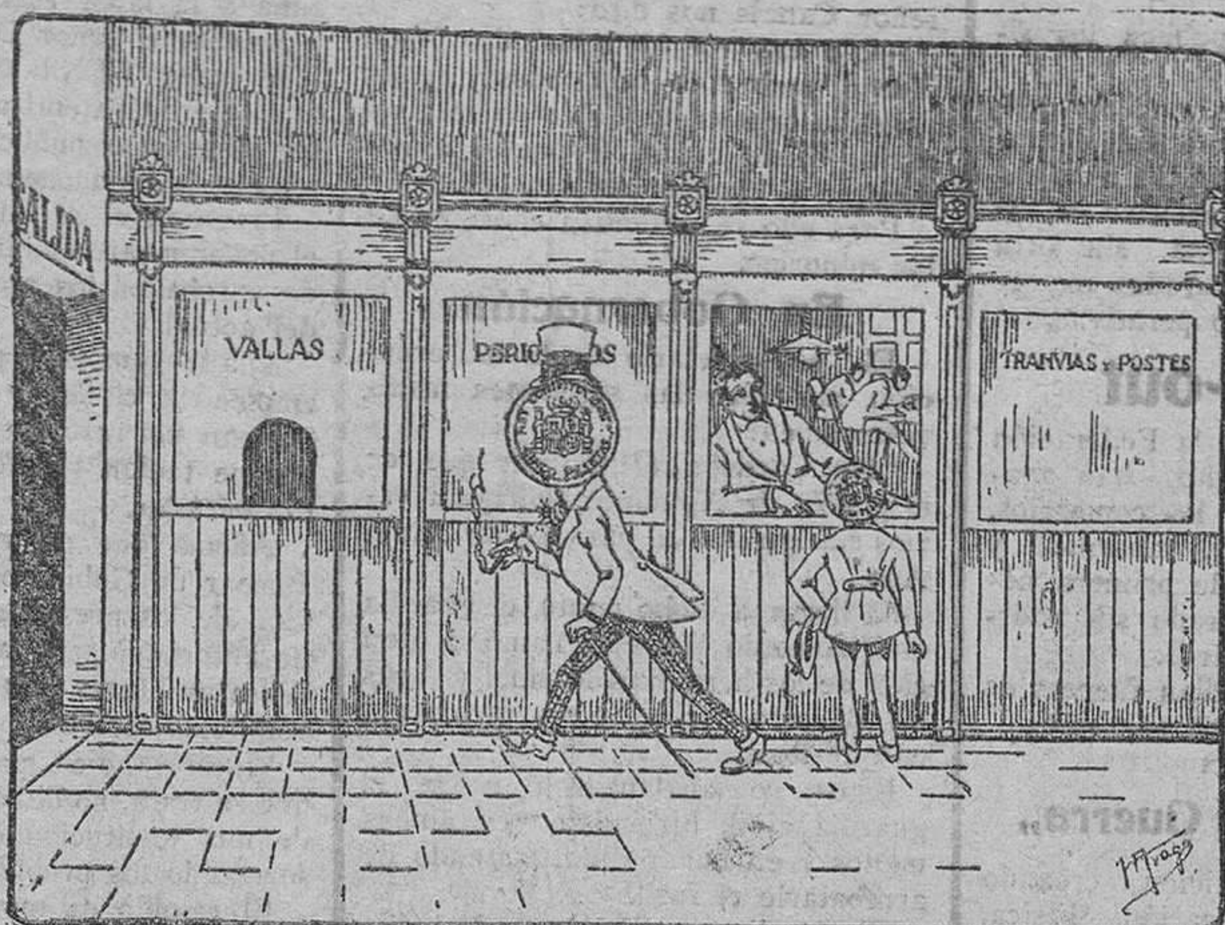
Se convierte en un DURO de ganancia

Personal técnico y oficinas propias para la industria que se ejerce