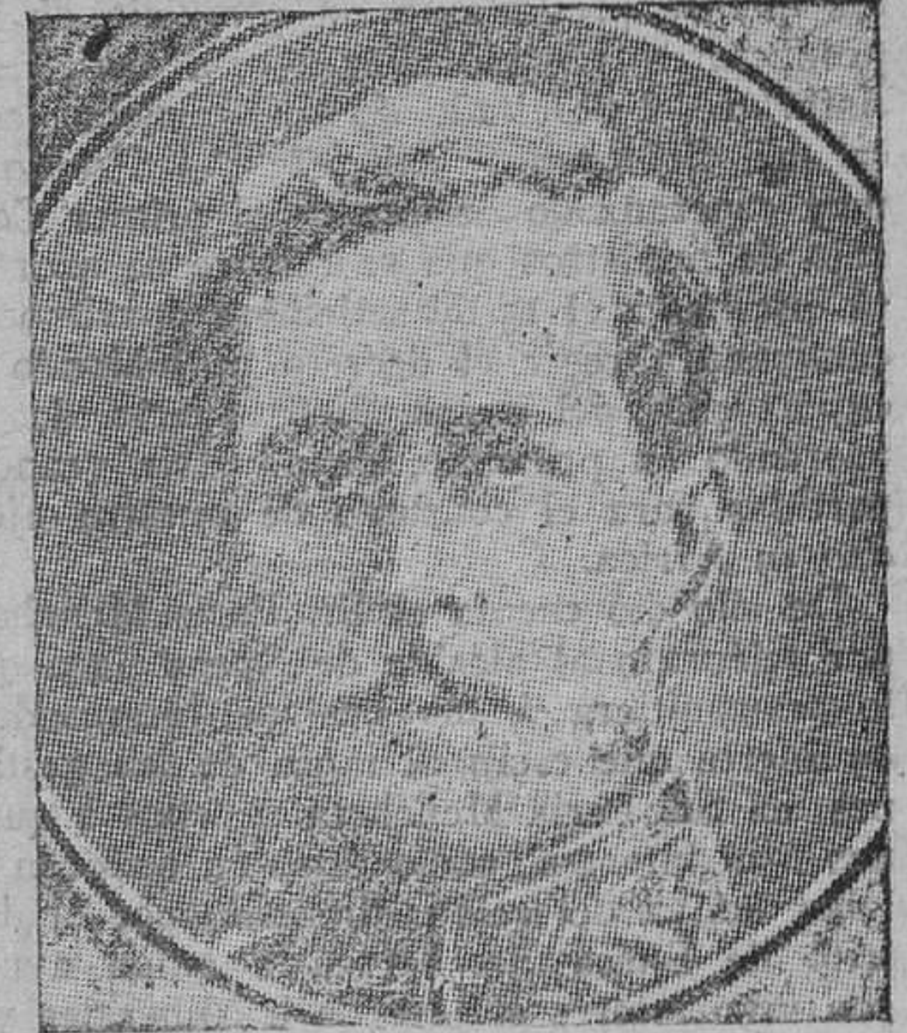
El Rey Alberto de Bélgica

En síntesis dice que los combates decisivos se darán por los flancos, si bien es cierto que se amagará algunas batallas por el frente de las fronteras, que nada han de decidir.