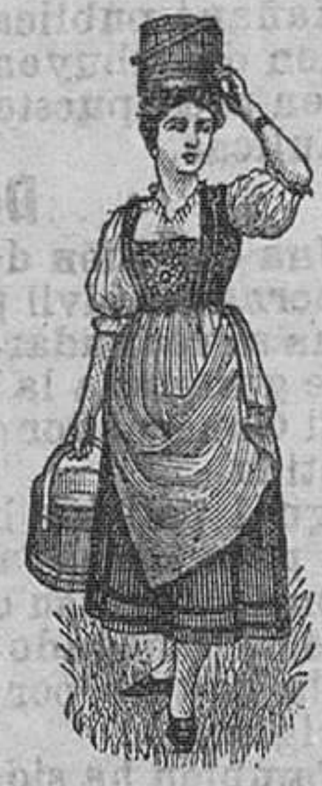
MARCA DE FABRICA