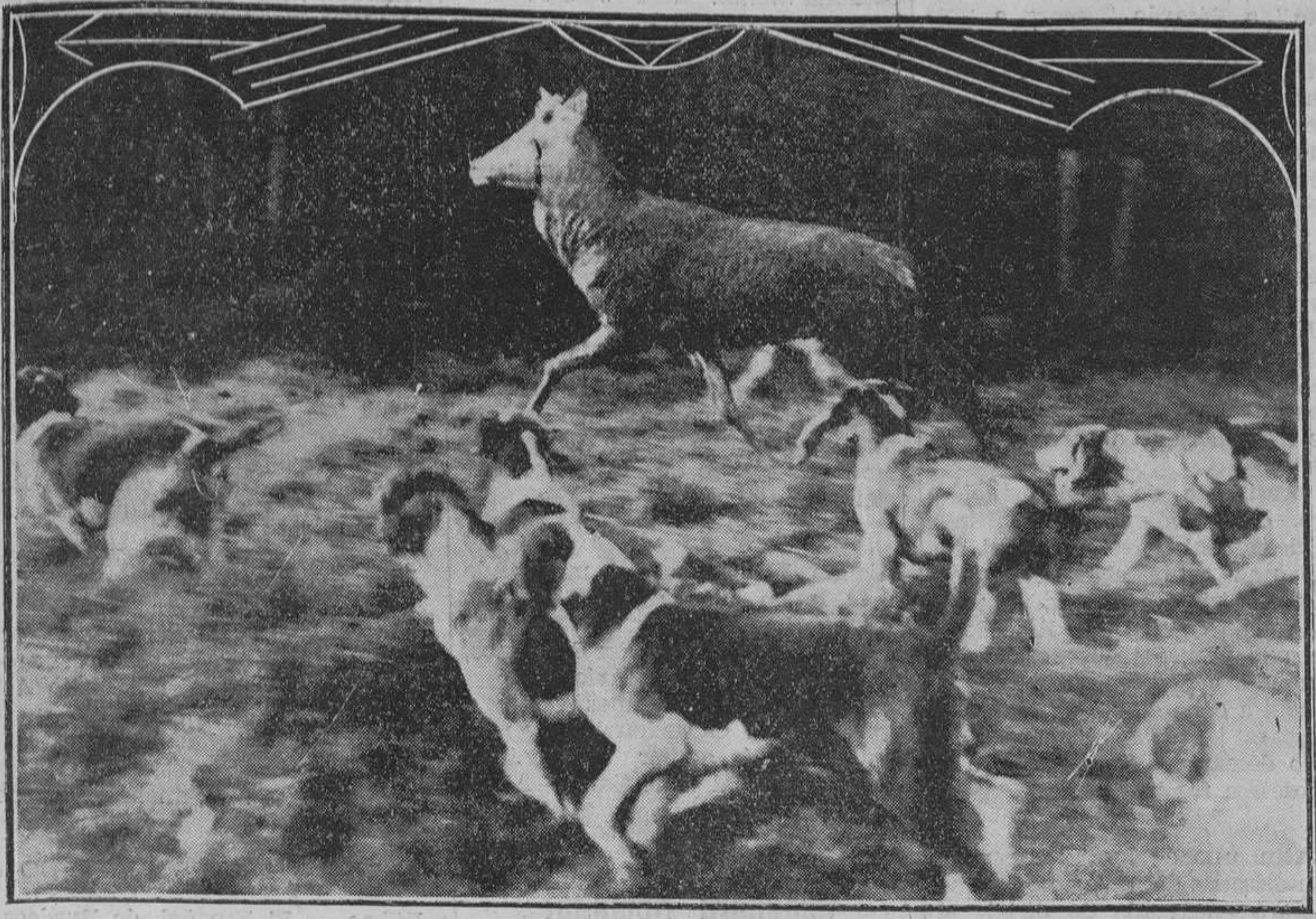
LAS CACERIAS EN INGLATERRA.—La temporada de caza en Inglaterra está en su apogeo. Recientemente se ha celebrado en Winkfield Berks una cacería, a la que corresponde la hermosa fotografía que reproducimos y que recoge el emocionante momento en que la jauría ataca a un conejo.

Director - Propietario: IGNACIO DE VALENZUELA