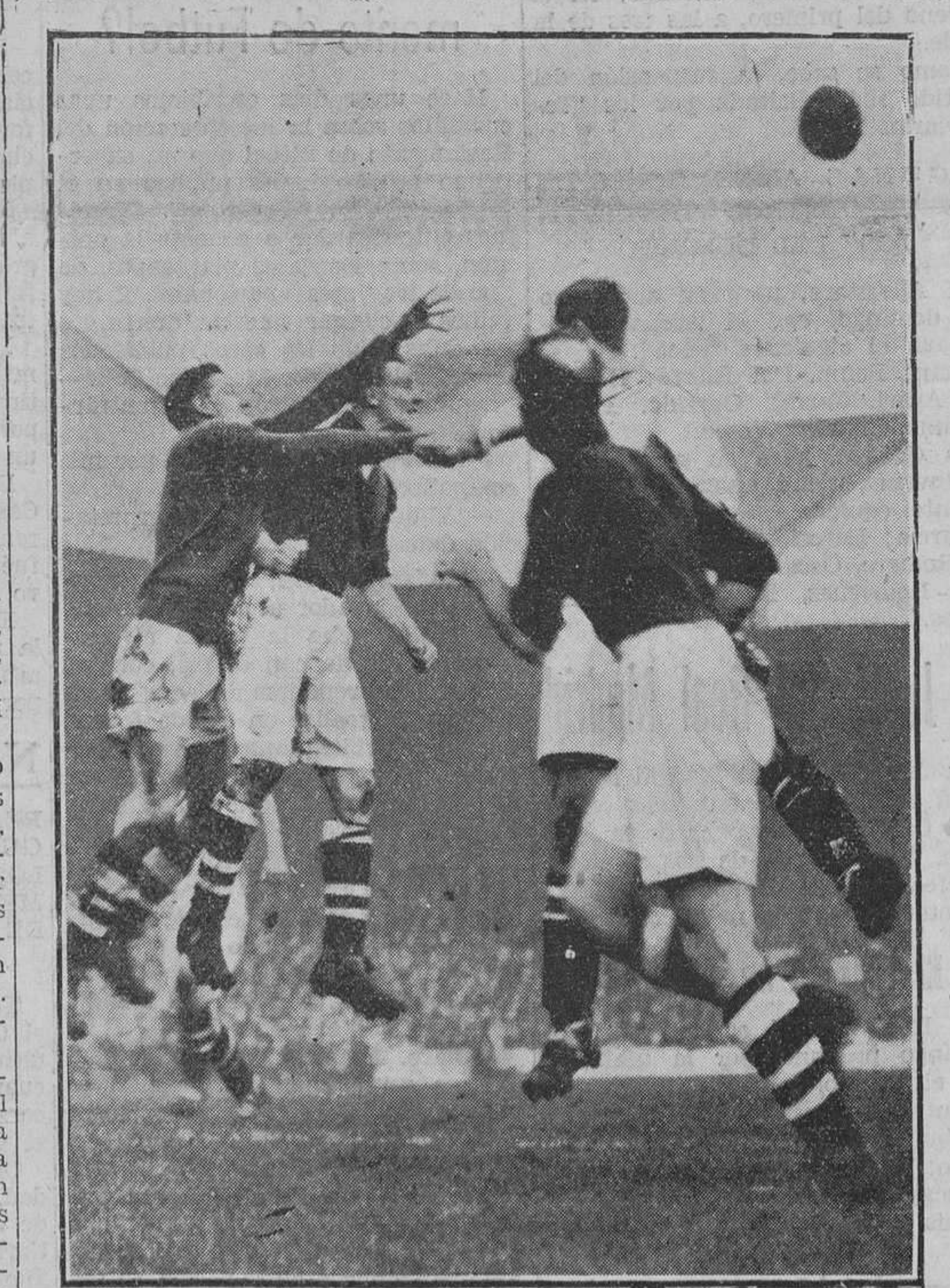
LA COPA DE INGLATERRA DE FUTBOL.—El portero del Arsenal despejando una difícil situación durante el partido entre este equipo y el Aston Villa.

París.—Se anuncia oficialmente que Charles Pellissier no tomará parte en la Vuelta a Francia del próximo año, pues piensa descansar hasta el 30 de junio. La Vuelta a Francia de 1930 le ha producido dinero bastante para ir viviendo de sus rentas hasta esa fecha y tomar un descanso que le permita volver luego al deporte activo con nuevos bríos.