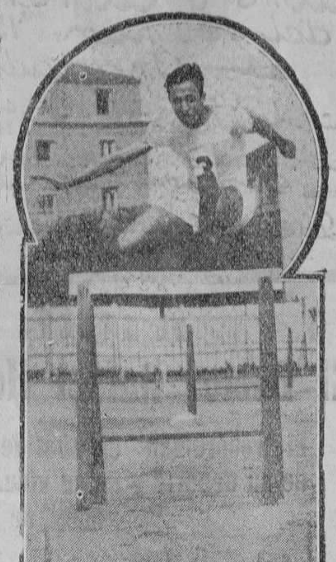
En plena acción sobre los 110 metros vallas.

¿Y en saltos? En longitud 6.350 metros, en altura, 1.650, y en pértiga, 2.600 metros. Disco y jabalina? 31.500 y 41.550 metros, respectivamente. Cuántas copas y medallas tendrán ganadas? Muchísimas. Aquí sólo tienes veintitantas copas y cerca de cincuenta medallas, y no son todas las ganadas, porque algunas no llegué a recibirlas todavía. Ten en cuenta que fui campeón español de 400 metros y 19 veces de Castilla, y que además tengo los "records" de Pentathlon y Decathlon. Eso en atletismo, que aún queda fútbol, boxeo y rugby.