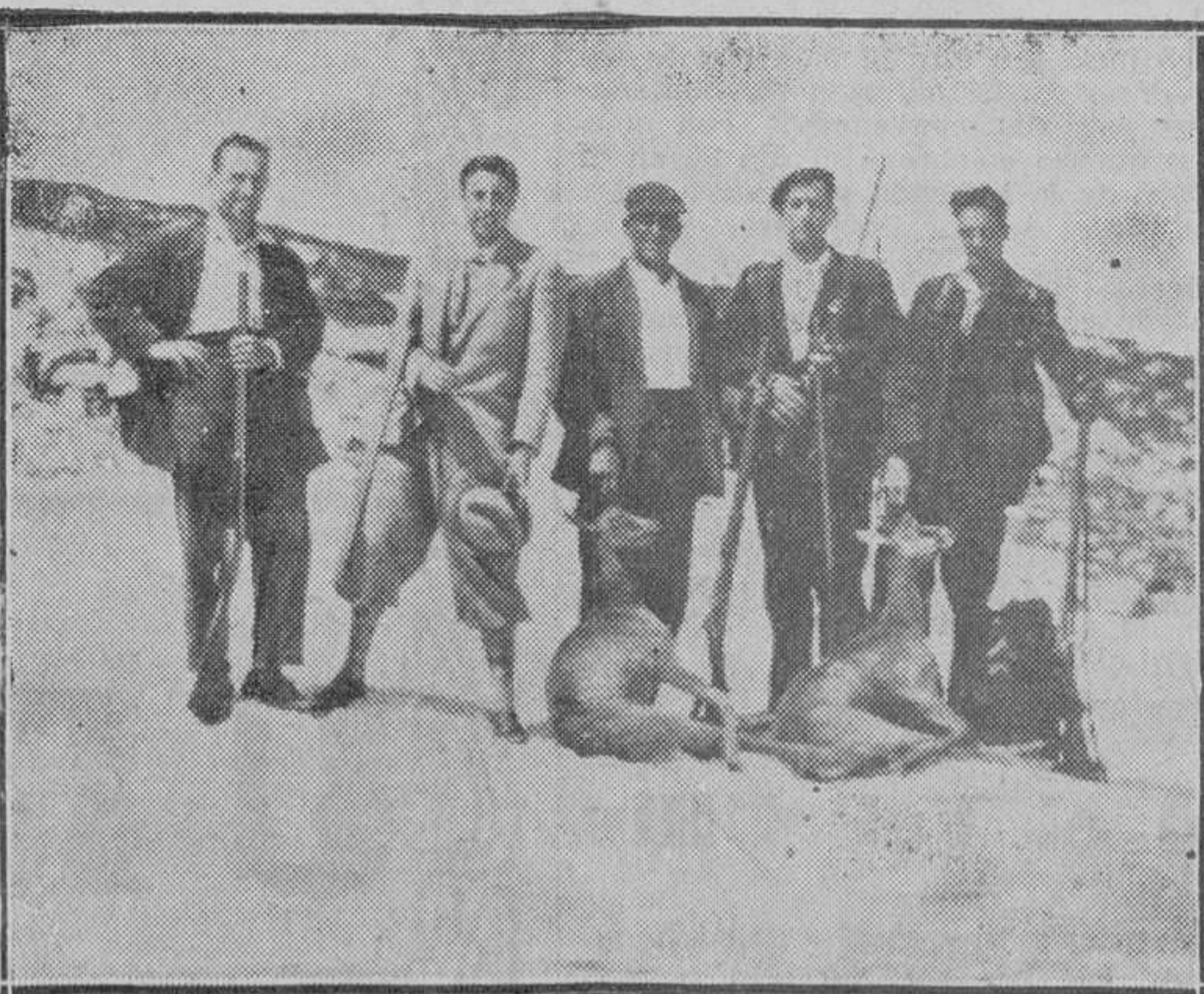
Los cazadores con los sarríos cobra dos.