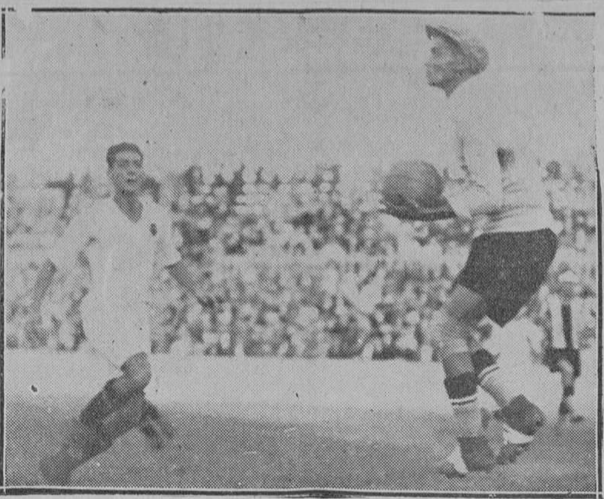
EN MESTALLA, EL VALENCIA, VENCIÓ POR 2-0 A SU RIVAL DE SIEMPRE

Los mejores del Saguntino, que hicieron una primera parte brillante fueron Boro, Calpe, Marzal, Ródenas, Llorens y Galarza.