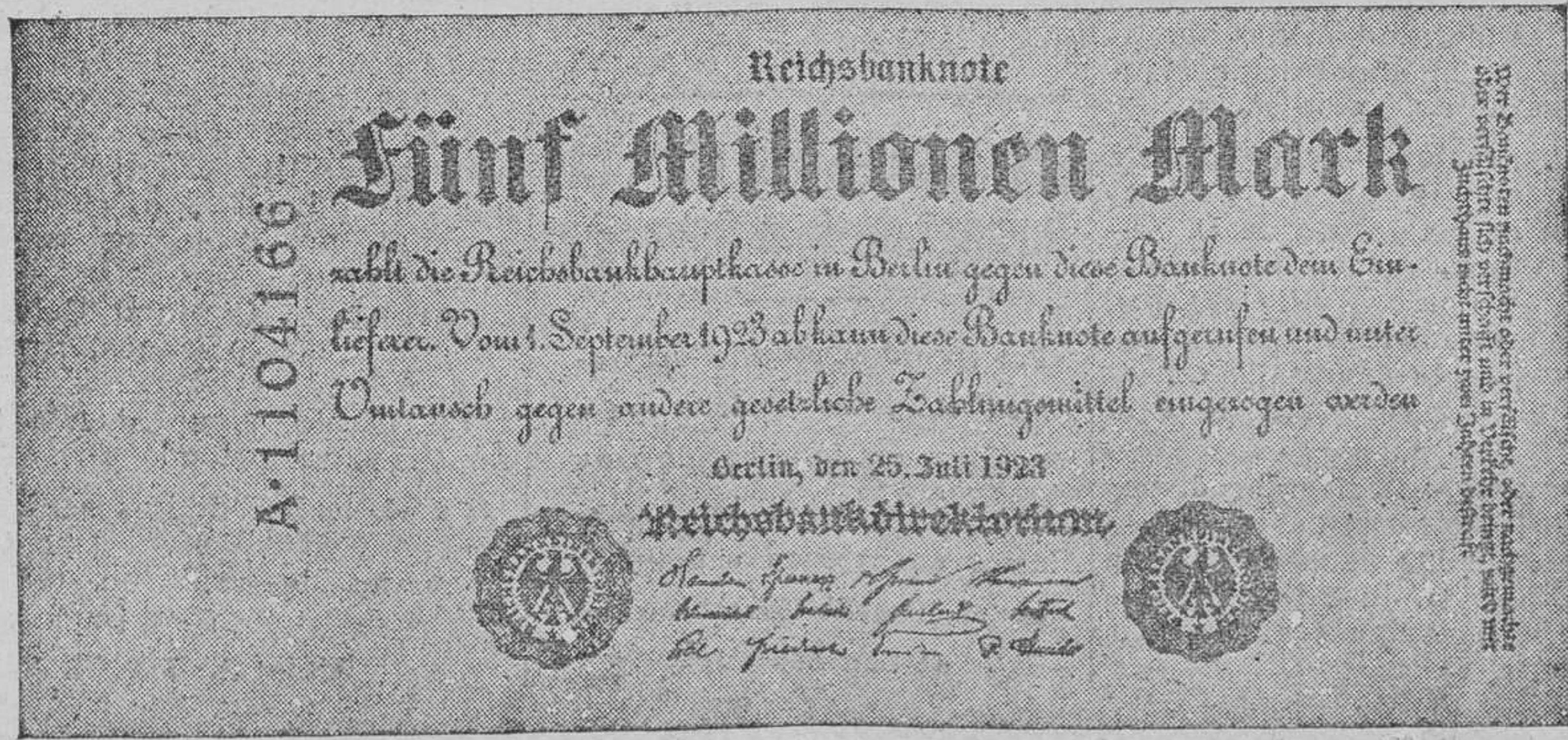
"Cuno-Mark" de cinco millones de marcos.

He aquí un billete que representa una bonita fortuna: cinco millones de marcos.