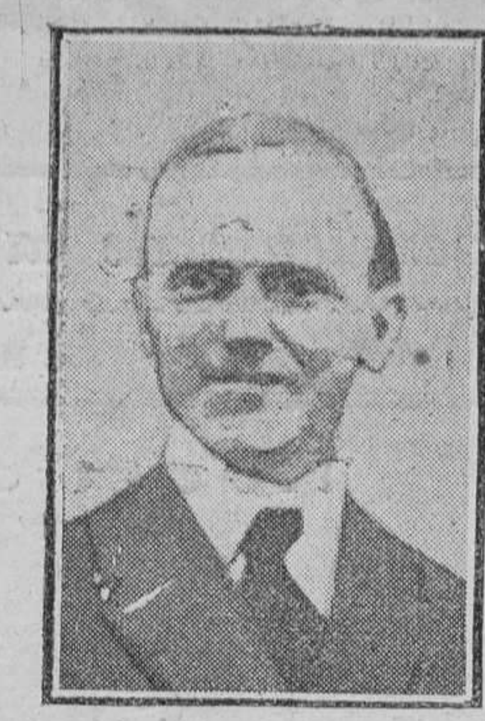
El vicepresidente, Mr. Calvin Coolidge, que, con arreglo a la Constitución norteamericana, asume la Presidencia hasta la expiración del mandato en marzo de 1925.

del mundo contra Francia no puede causar emoción al Gobierno francés, ya que éste ha resuelto publicar todos los documentos relacionados con estas negociaciones.