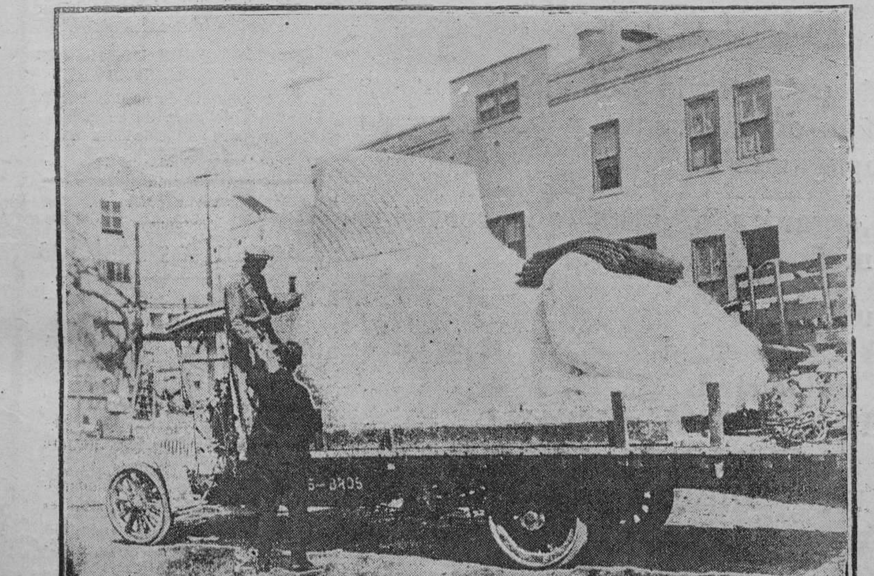
Ministerio de Educación, Cultura y Deporte