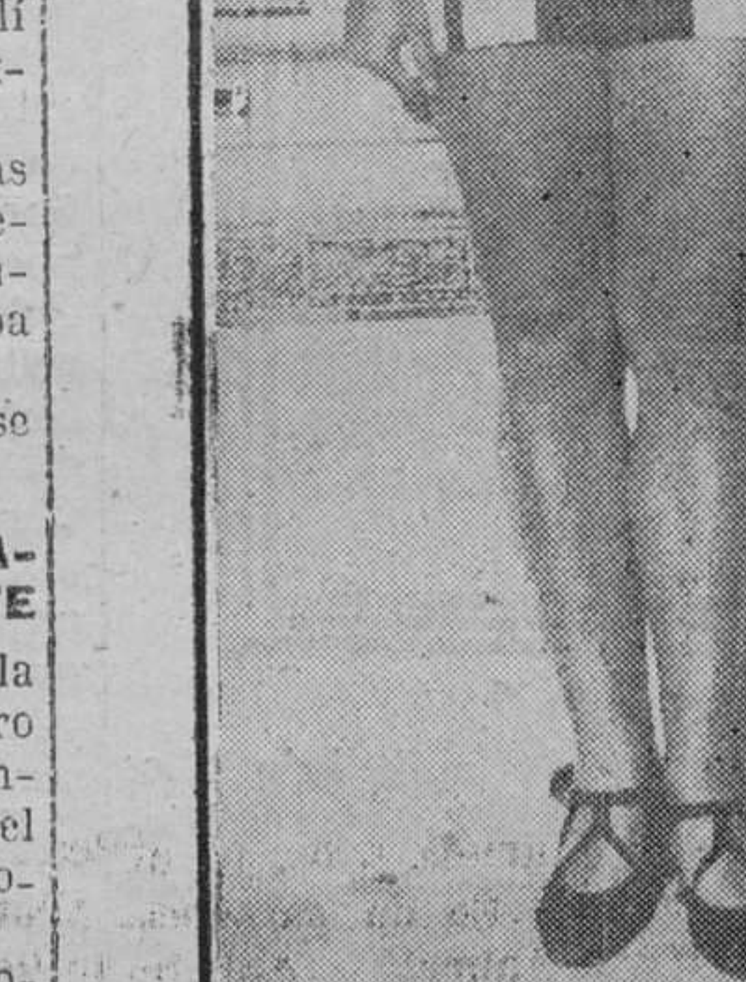
Etheldra Bleibtrey y su compañera Lucy Freeman en el campeonato de natación...