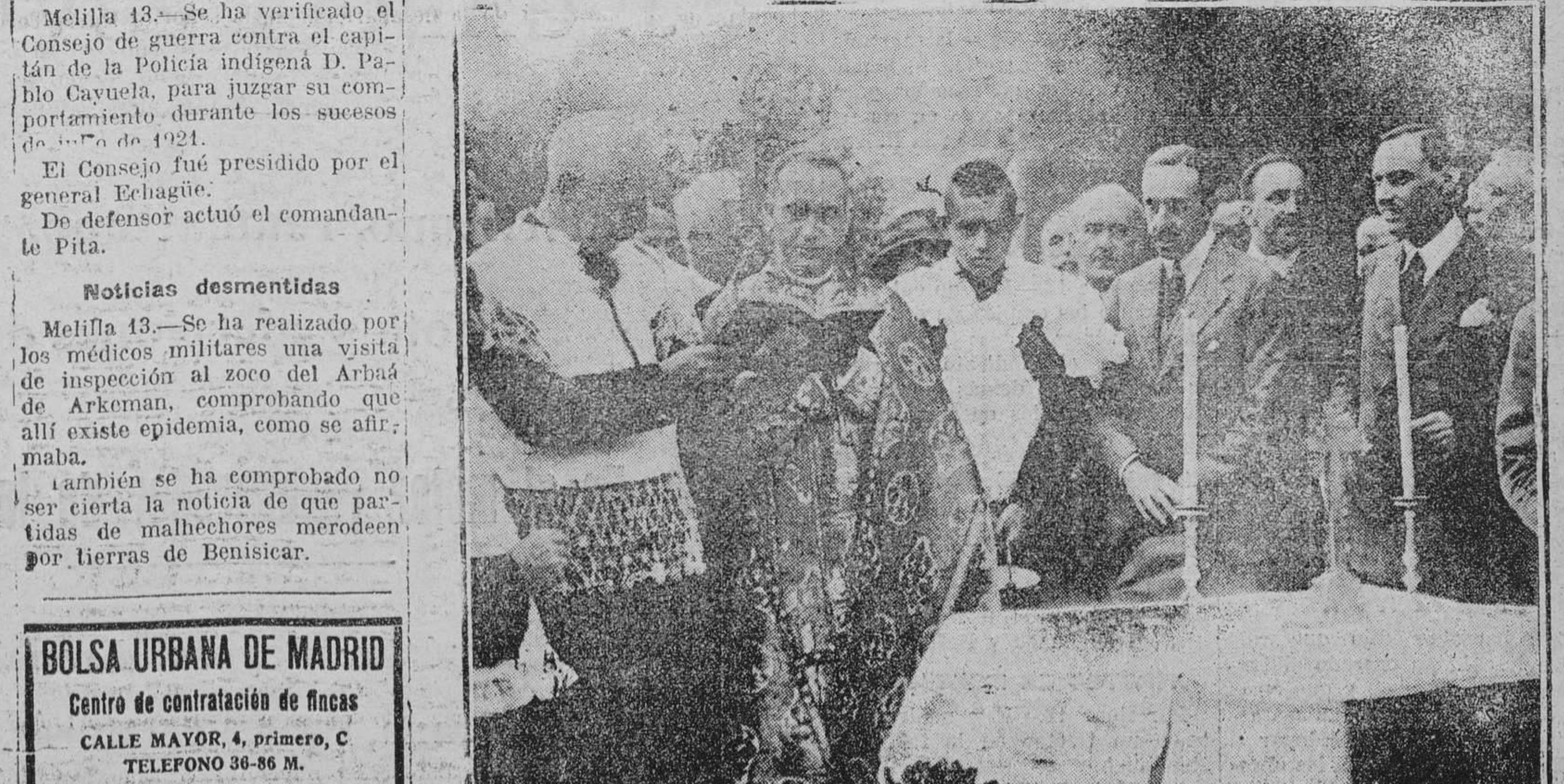
Momento de ser bendecida la línea del ferrocarril del Guadarrama.