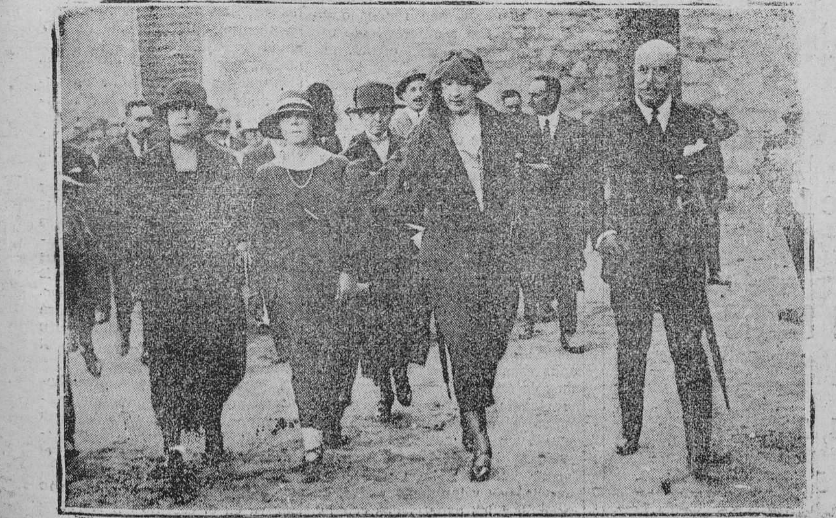
S. M. la Reina al llegar a Covadonga para inaugurar el ferrocarril del Guadarrama.

LAS HERIDAS En la Casa de Socorro de Buenavista aparecieron a Ceferino una herida contusa irregular en el parietal derecho y fractura craneal con salida de la masa encefálica, siendo su estado gravísimo. El conductor del carro sufrió lesiones en la mano derecha y pierna izquierda de pronóstico reservado.