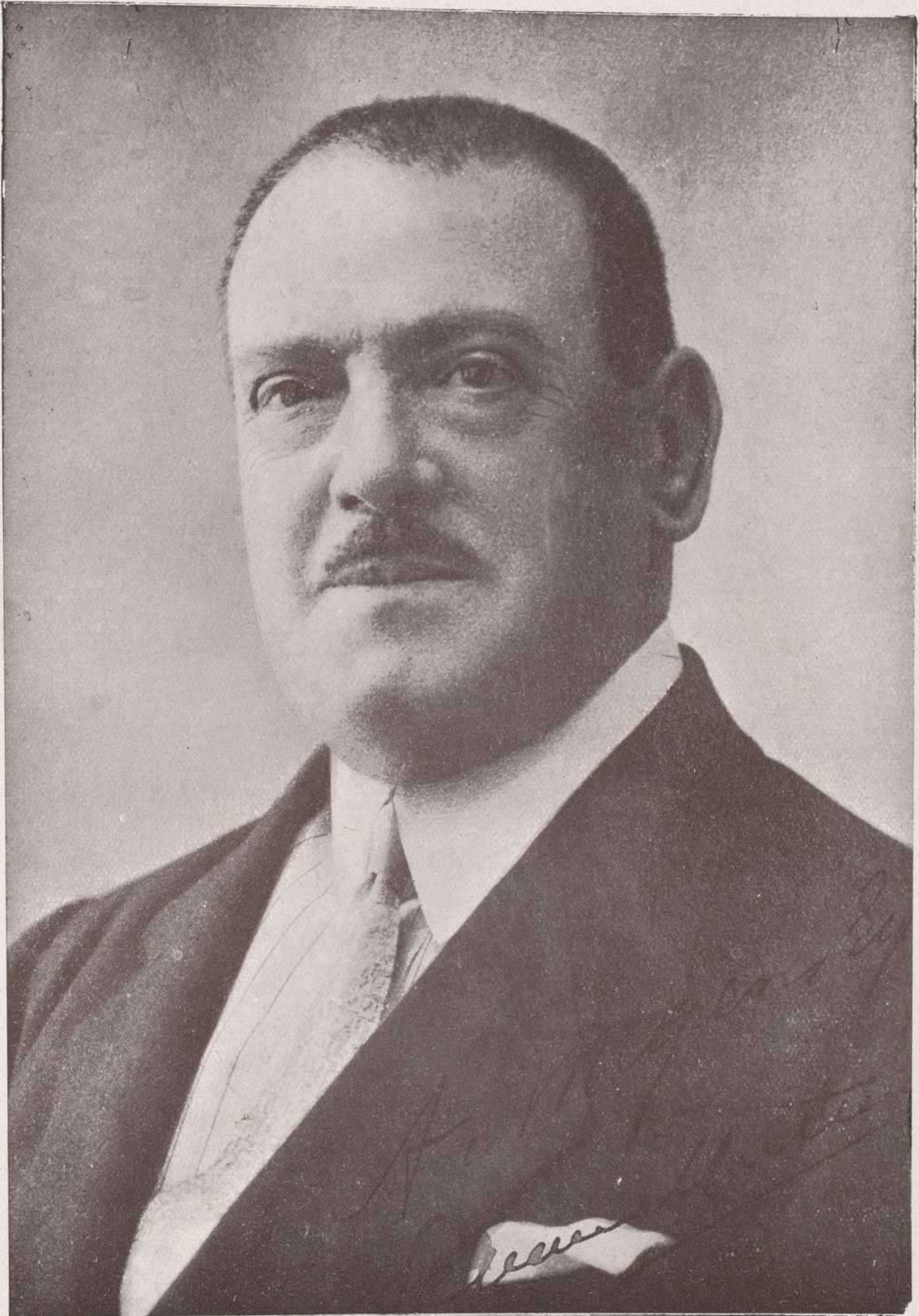
Excmo. Sr. General Martínez Anido, Ministro de la Gobernación.