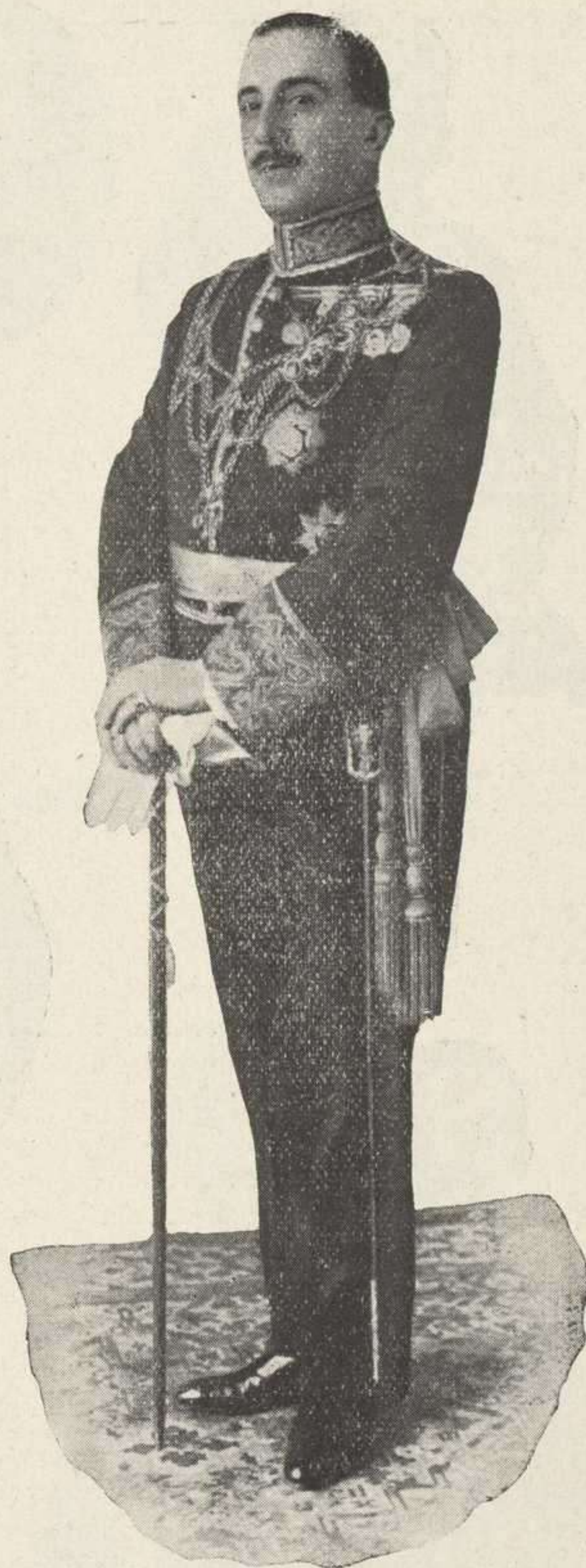
Excmo. Sr. Marqués de Guerra Gobernador Civil de Valladolid.