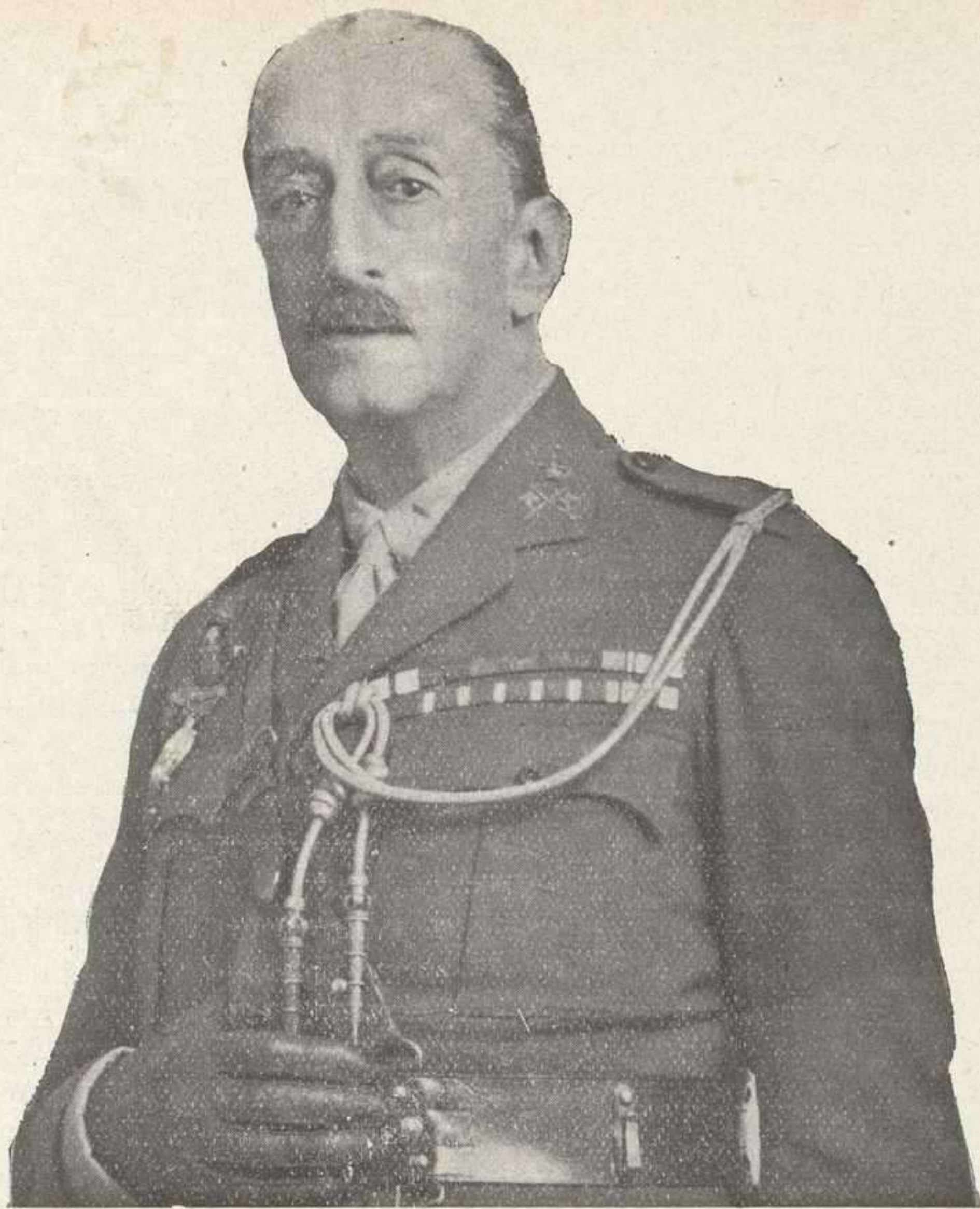
Excmo. Sr. Gobernador de Barcelona.