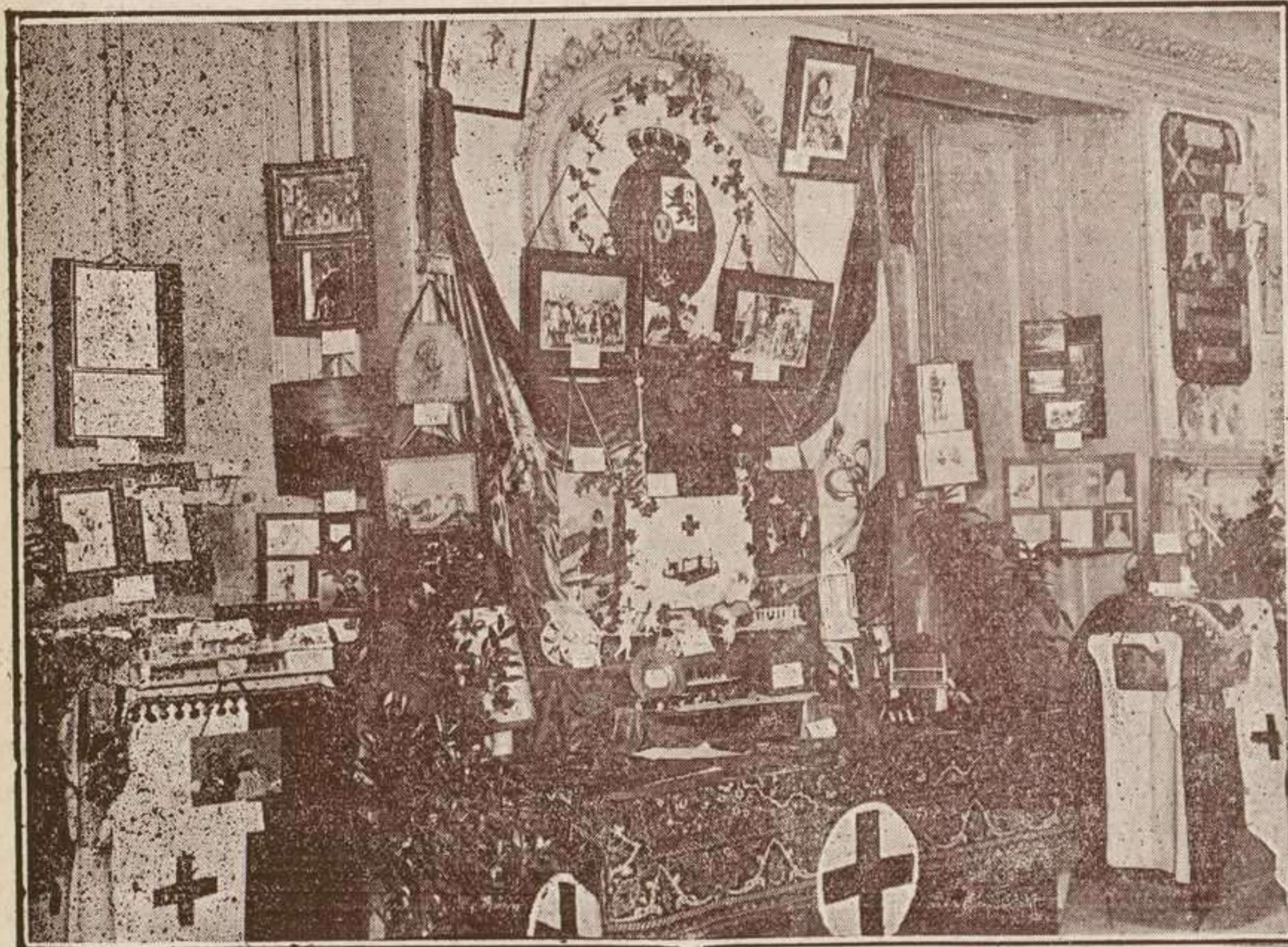
MADRID.—Exposición Internacional de trabajos manuales de la Sección Juvenil de la Cruz Roja. Instalación de los Grupos del Colegio de Nuestra Señora del Pilar, de Madrid.