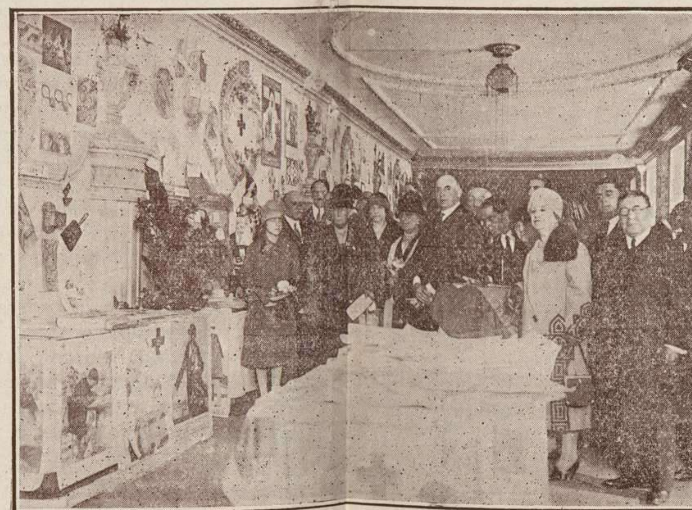
MADRID.—Inauguración de la Exposición Internacional de trabajos manuales de la Sección Juvenil de la Cruz Roja, con asistencia de SS. AA. RR. las Infantas Doña Isabel, Doña Mercedes y Doña María Luisa.