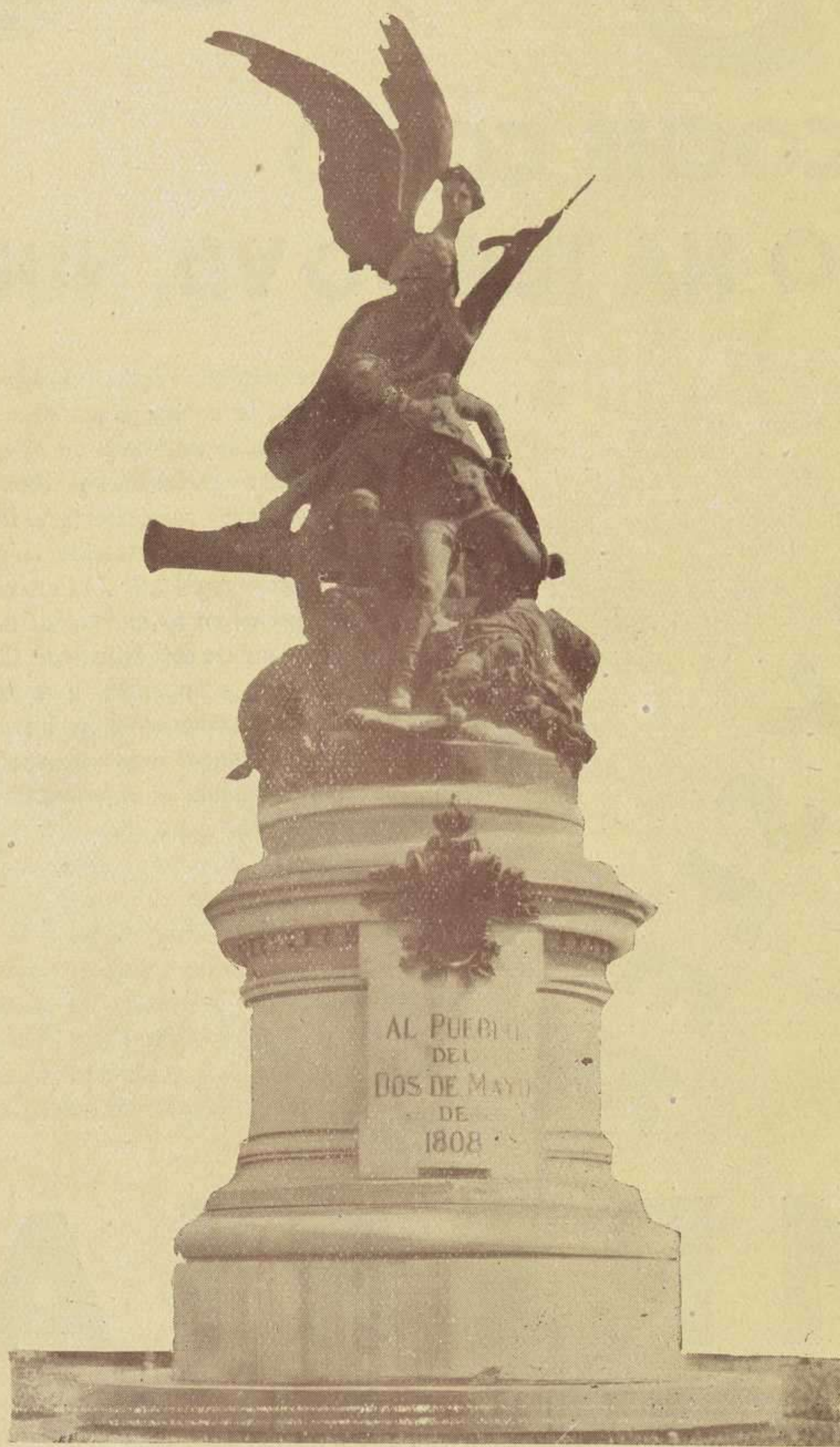
MONUMENTO AL DOS DE MAYO

Habiendo sido las Mujeres Españolas las que levantaron ese monumento, MUJERES ESPAÑOLAS cree su deber publicarlo en seguida.