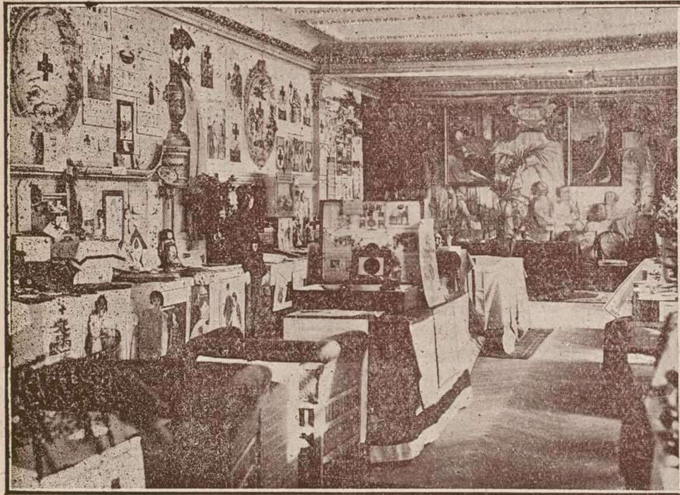
MADRID.—Exposición Internacional de trabajos manuales de la Sección Juvenil de la Cruz Roja.—Vista general parcial.