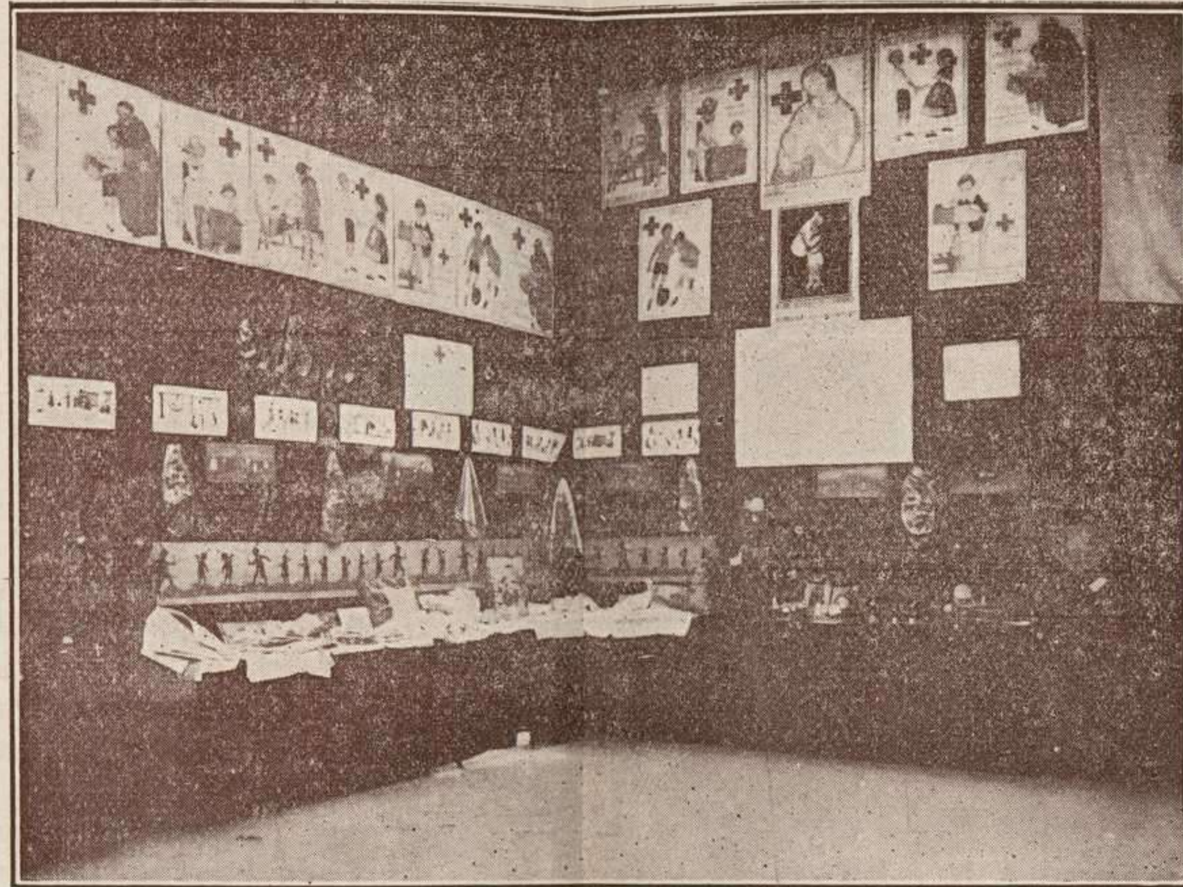
MADRID.—Exposición-Feria de Navidad.—Instalación del Grupo «Jardines de la Infancia», de Madrid.