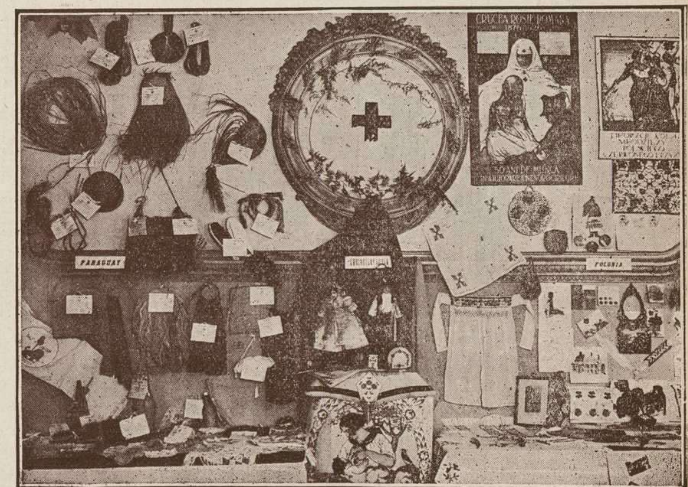
MADRID.—Exposición Internacional de trabajos manuales de la Sección Juvenil de la Cruz Roja.—Instalaciones de las Secciones del Paraguay, Polonia y Checoslovaquia.