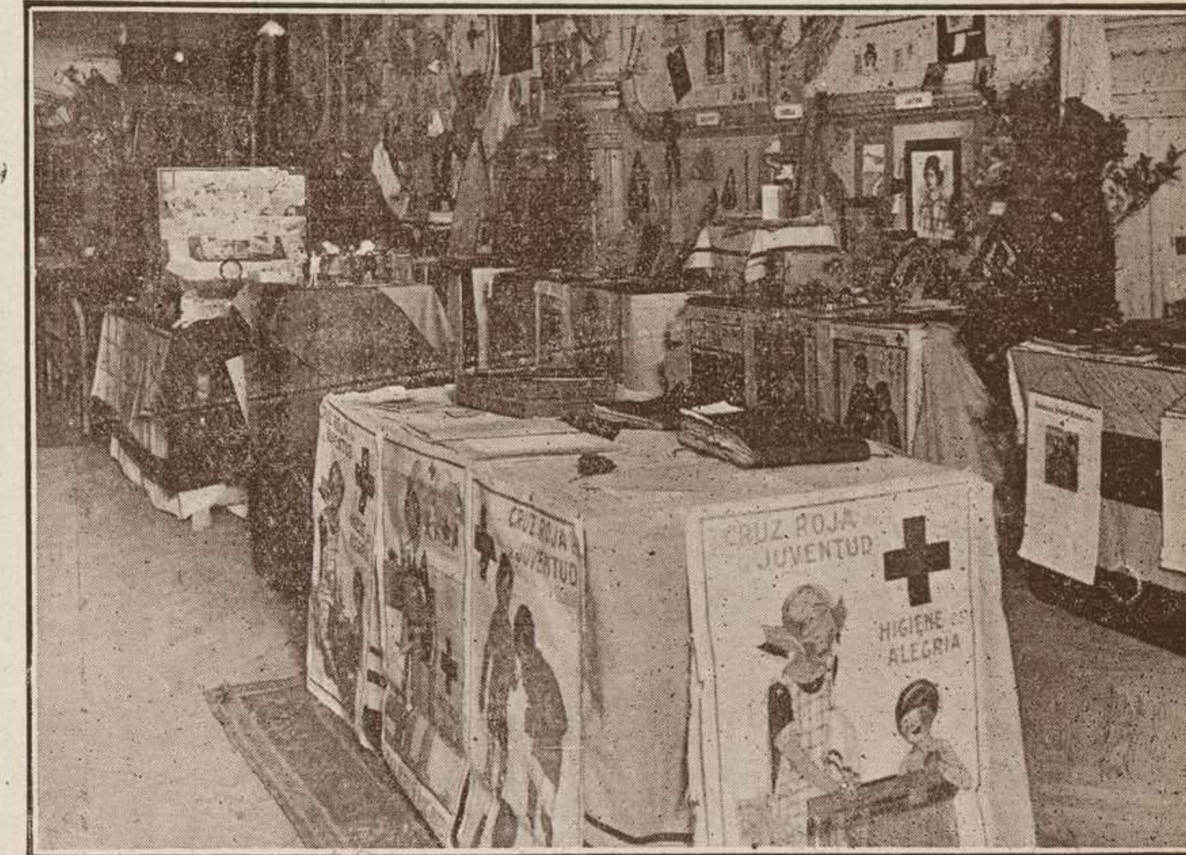
MADRID.—Exposición Internacional de trabajos manuales de la Sección Juvenil de la Cruz Roja.—Vista parcial.