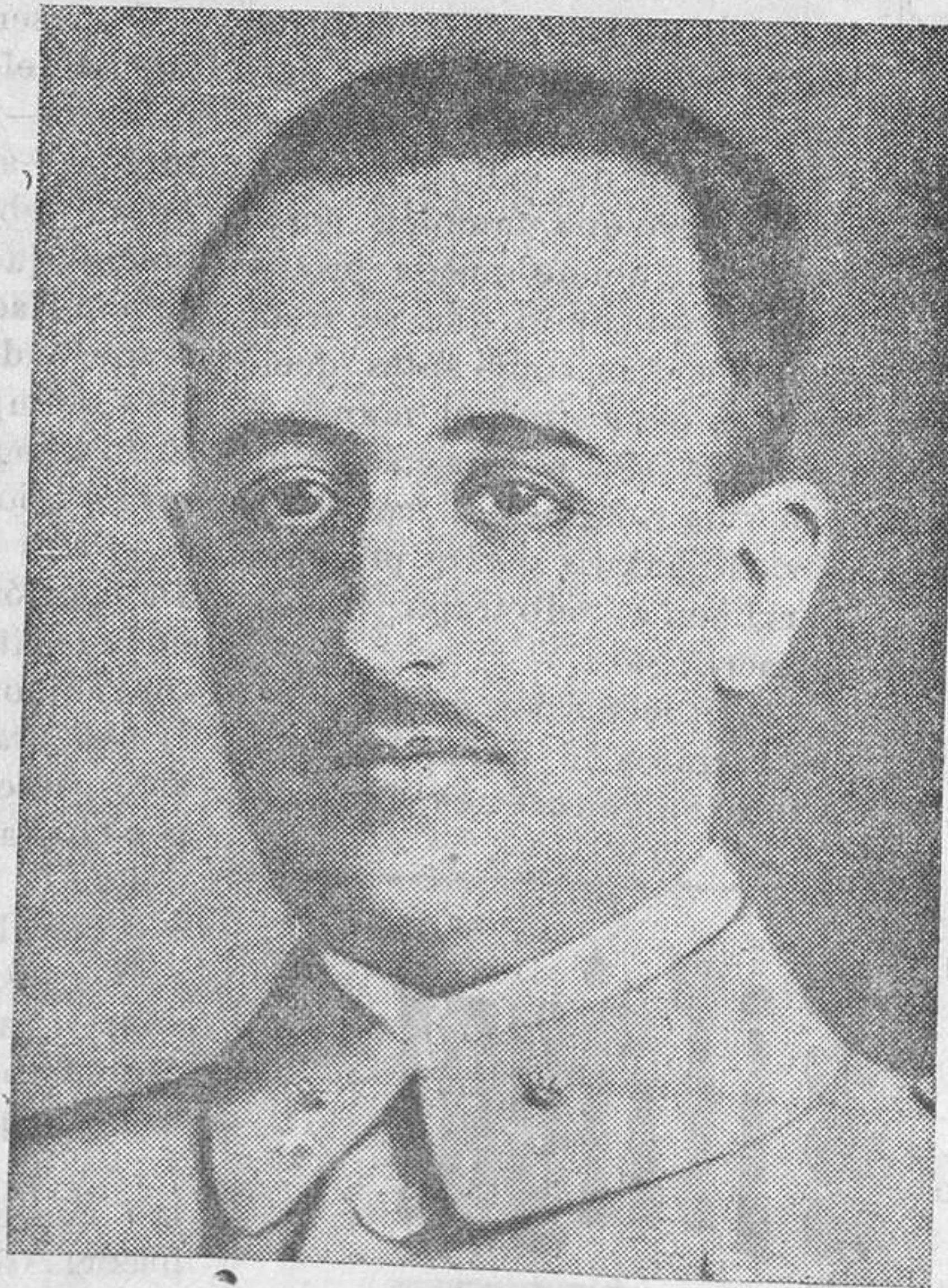
¡SALUDO A FRANCO!

Los cañones cogidos al enemigo son los siguientes: Seis del quince y medio, seis del diez y medio, tres del siete y me-