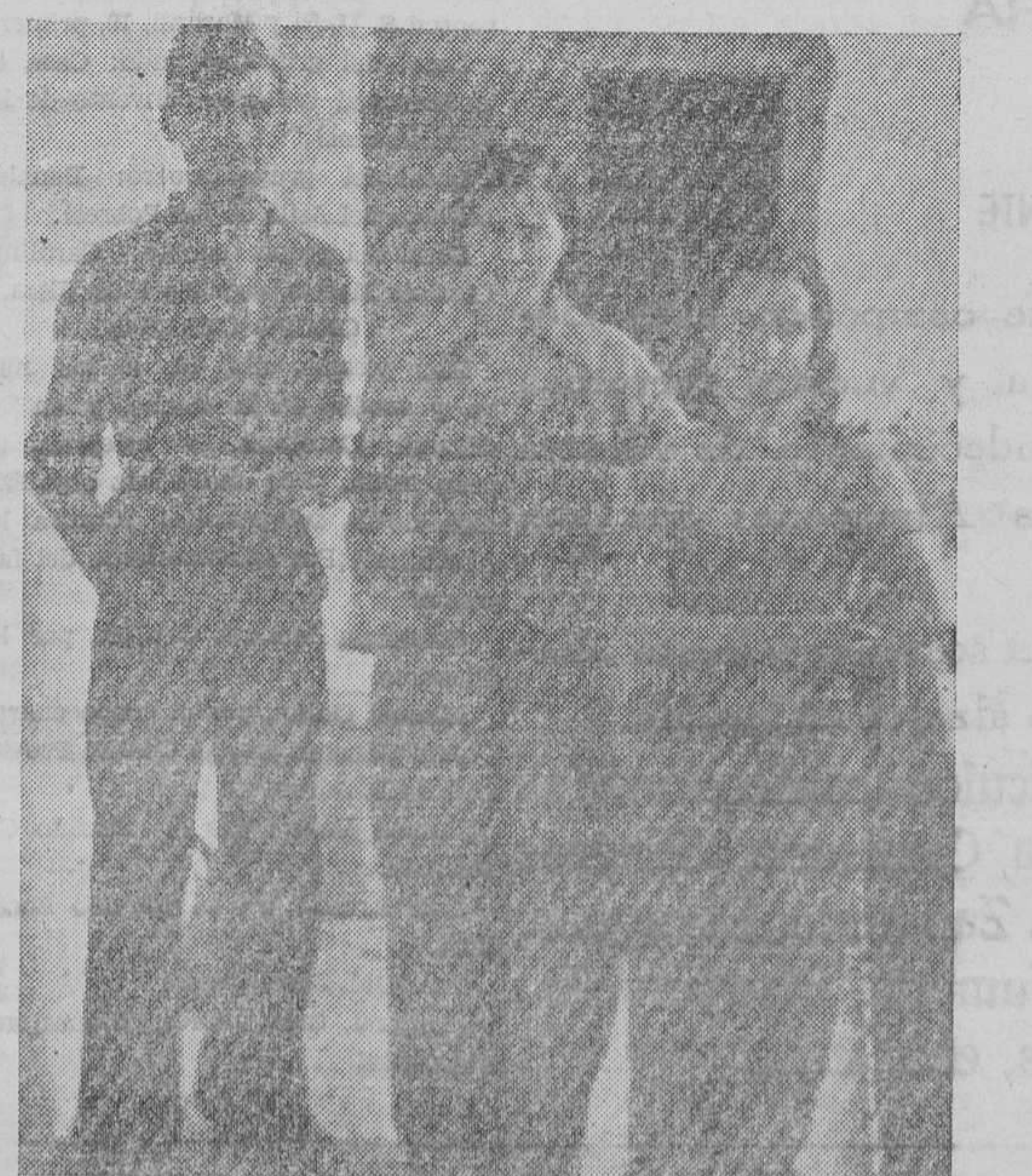
Dos muchachas nos sirven la cena. Alfredo me pregunta si las conozco. Contesto negativamente y me dice: Son de Elche. Mejor dicho, una es de Elche. La otra de Crevillente.

En todas, al saber que vamos a transmitir noticias suyas a la lejana tierra, por medio de las columnas de EL LUCHADOR, no pueden ocultar su alegría. Todos desean les haga fotografías para que puedan verles sus fa-