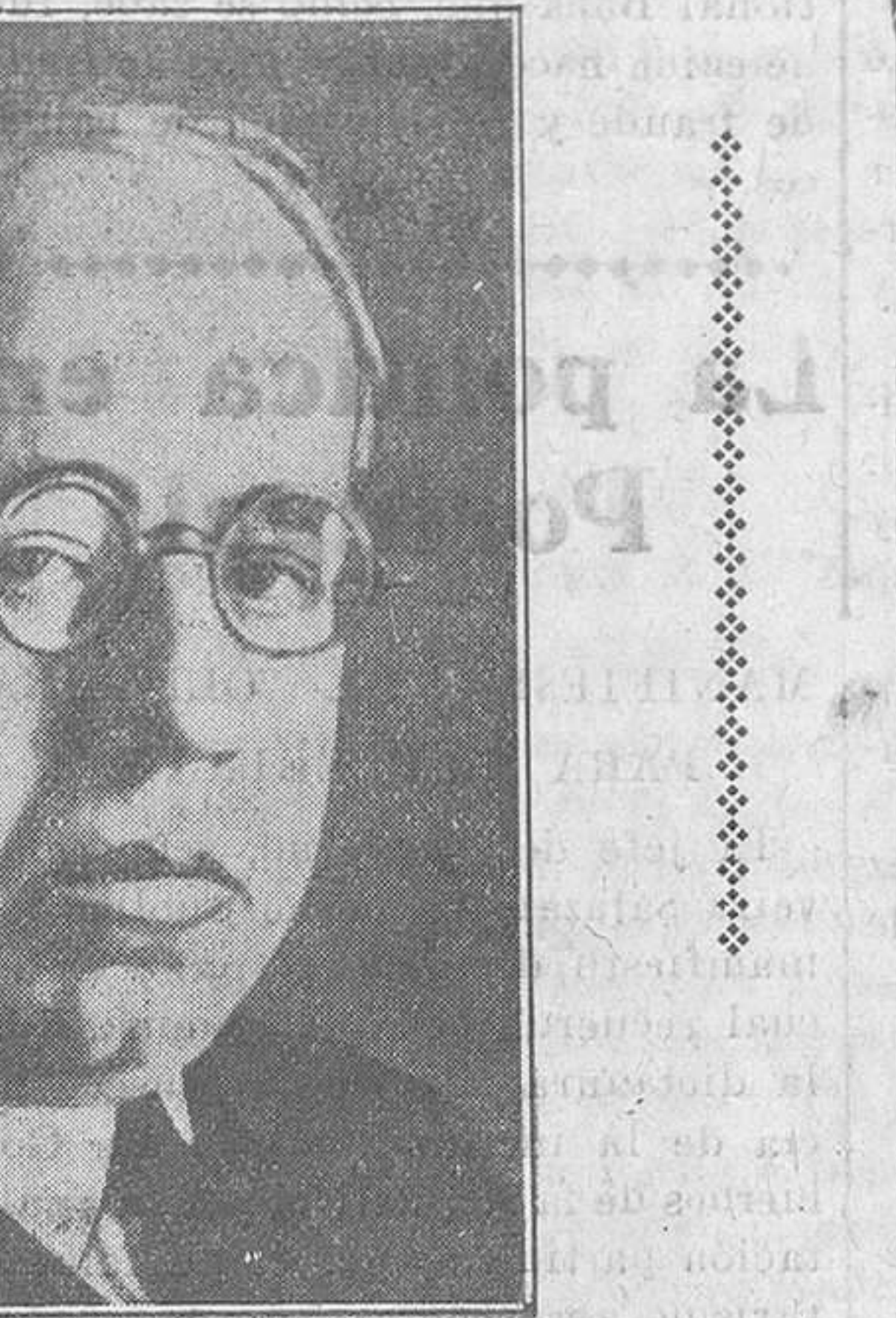
D. MANUEL AZANA, el presidente del Consejo de Ministros, que hará, con obstrucción o sin ella, las elecciones.

biñana unos «legionarios», para combatir a los republicanos en los días de las dictaduras? Los socialistas y los republicanos de izquierda, de la misma suerte, deben de agruparse y ponerse a su frente. Y en los casos de alborotos callejeros—recuérdese, señores, el privilegio que gozaban los «legionarios»!— que la fuerza pública preste asistencia a los ciudadanos de la República y persigan a los enemigos del res-