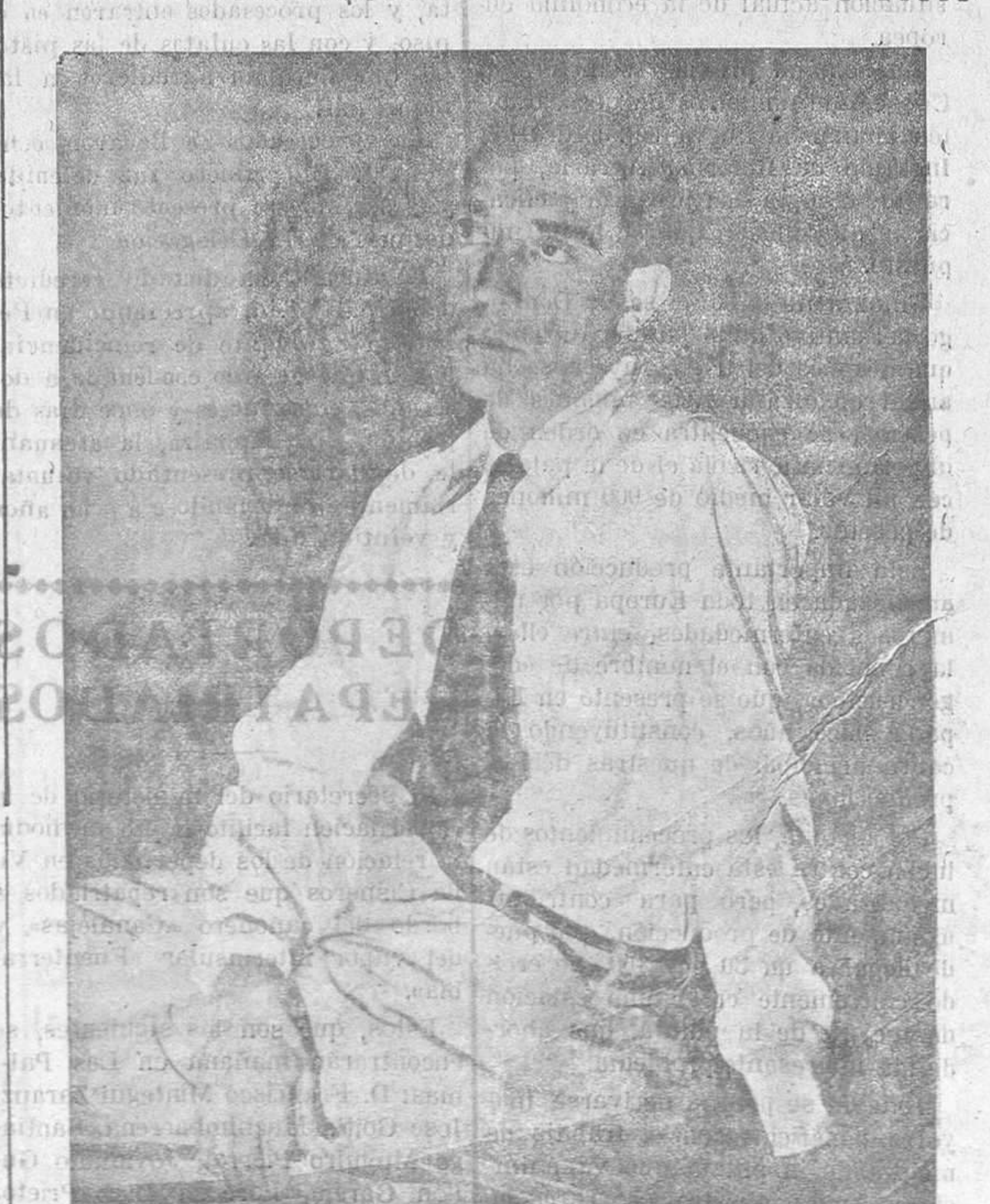
BUSTER KEATON «PAMPLINAS» Protagonista de «Un amante im providado» que, con singular regocijo, manda de risa al pública que va al Palacio de la Música.