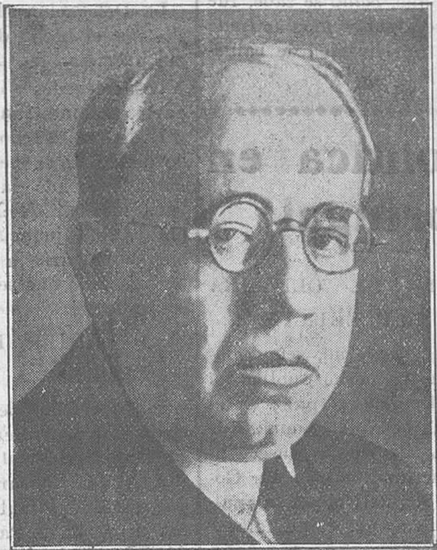
D. MANUEL AZANA, el presidente del Consejo de Ministros, que hará, con obstrucción o sin ella, las elecciones.

la calle, que no se presentarán... van a estar como para comerse. El saludo a la romana, si lo adoptan, se va a parecer mucho a la