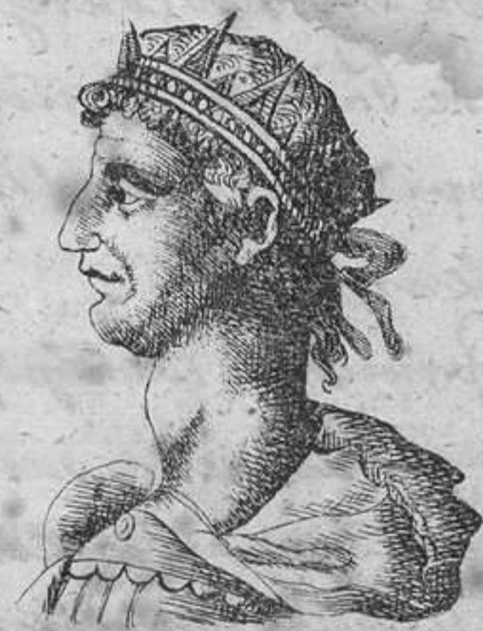
ROMULO I.º REY DE ROMA.

¿ Que son el oro y las piedras preciosas, si- no lucidas heces de la tierra que aprisionan el corazon del que los aprisiona, y poseen al que los posee? ¿ Que son las gloriosas alaban- zas sino humosos alientos de las bocas que las pre- fieren las cuales tan pronto ensalzan como zahie- ven incitadas por la envidia? ¿ Que son los cetros, coronas y altos empleos, sino esplendidos preci- picios en donde muchos que se creen felices hallan en ellos un fin desastroso? No se puede llamar feliz, quien dependien- do de la instable fortuna, pende continuamente entre el gozo y el peligro, entre la esperanza y el temor. Infeliz el que teme, y mas infeliz el que no teme, porque aquel temiendo siempre lo que frecuente- mente suele acontecer, siente primero la desgua- cia que suceda; y este, no temiendo lo que pue- de suceder, merece que le suceda lo q. no teme. Desde luego la felicidad verdadera no pue- de estar en los bienes exteriores; veremos si ecsiste en los bienes corporeos.